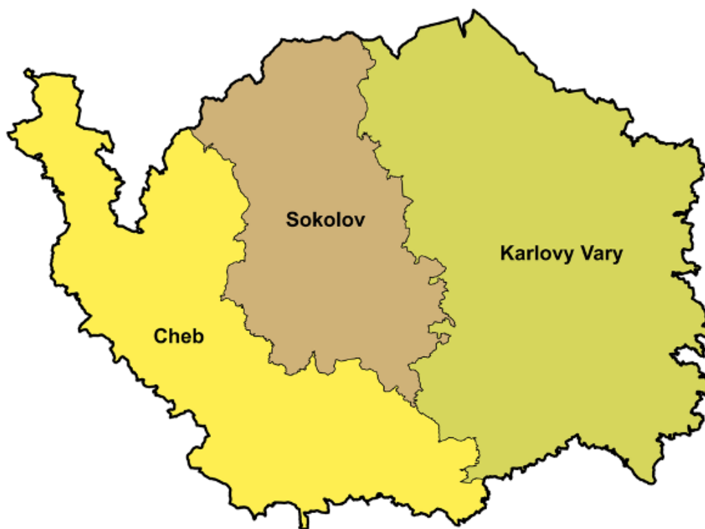
Obrazek 1 Karlovarský kraj