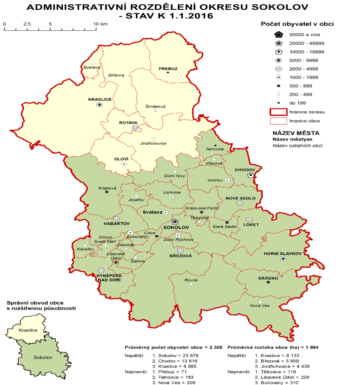
Obrazek 2 Administrativní mapa okresu Sokolov