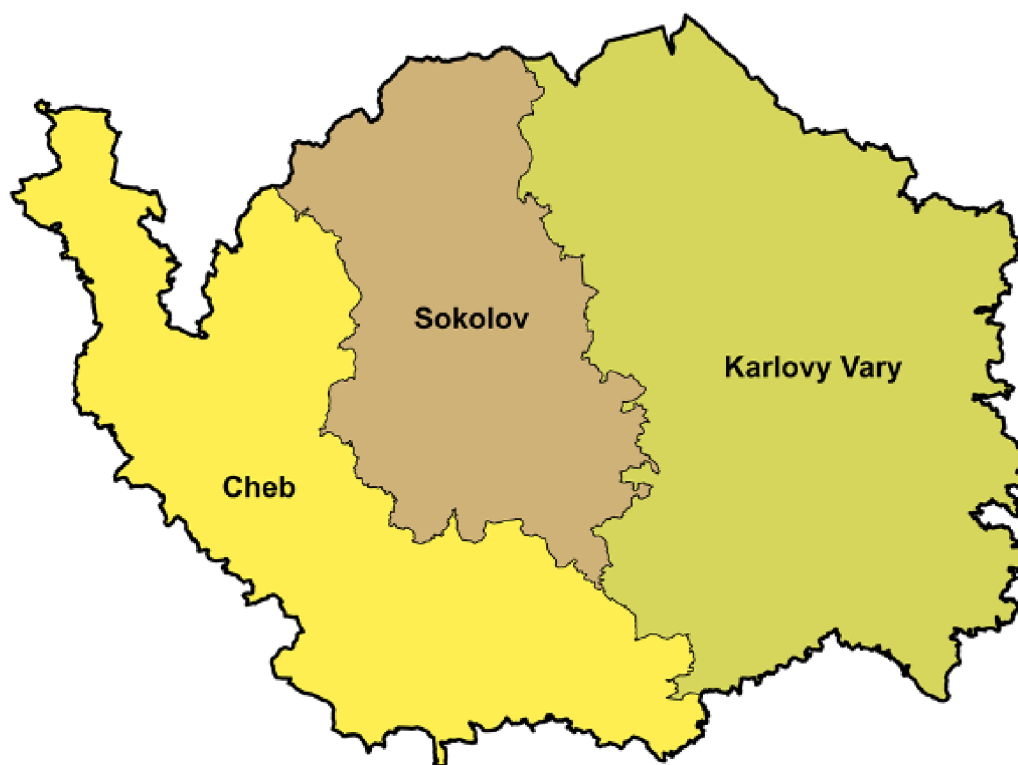
Obrazek 1 Karlovarský kraj