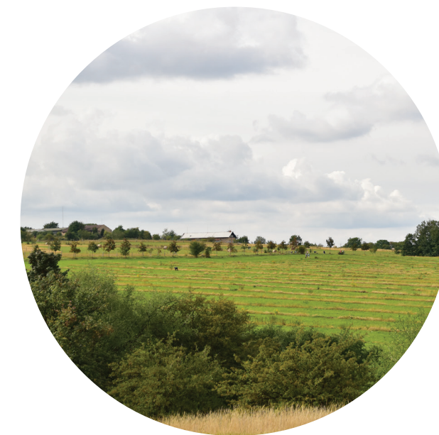
Otevřená krajina náhorní plošiny s plochami ekologického zemědělství, loukami a pastvinami doplněnými stromoadím a rekreačními cestami

Vstup Galerie Butovice Otevřený prostor spojující Prokopské údolí s okolím retenční nádrže Asuán navazující na pobytové louky. Z otevřeného území vede přehledná cesta k obchodnímu centru umožňující pohodlný přístup do údolí. V místě vybavení hygienickým zařízením, lavičkami pro odpočinek a plochami umožňující aktivní rekreaci (dětské hřiště, přírodní hřiště, vzdělávací či workoutové prvky).