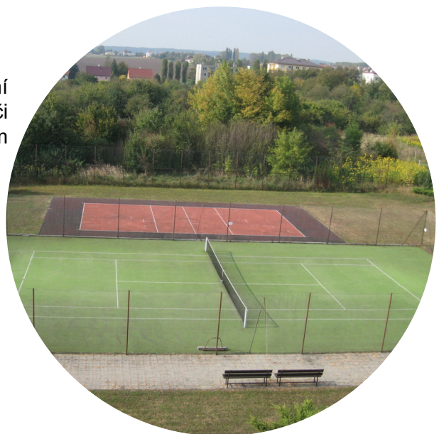
Sportovní zázemí města Prostor pro venkovní sportoviště jako tenisové či fotbalové hřiště s příslušným zázemím