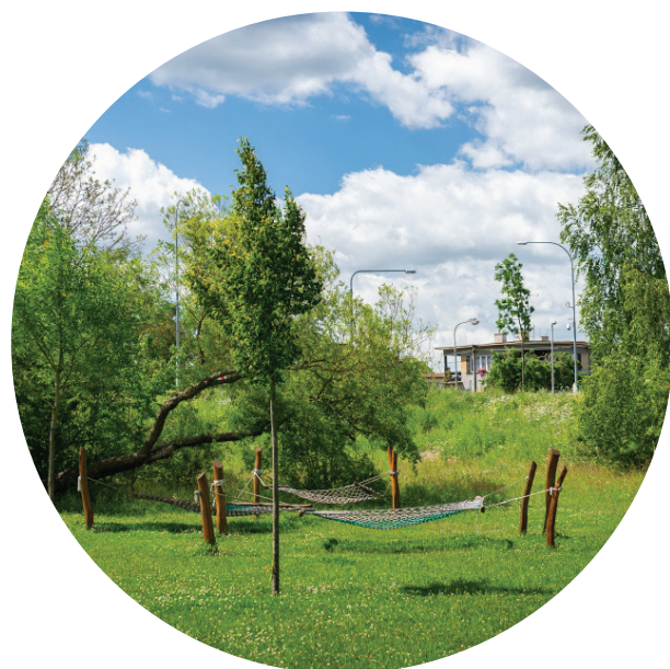
Městské krajinné zázemí s intenzivní rekreací