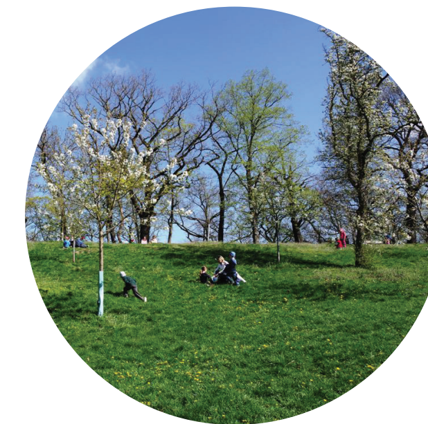
Záhumní krajina s dostupným rekreačním prostorem navazujícím na sídlo