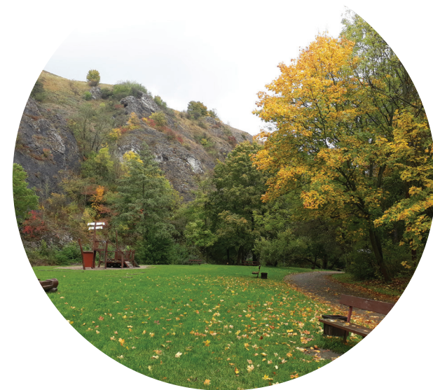
Přírodní lesní krajina na svazích Prokopského údolí

Prokopské údolí je romantickým údolím s protékajícím Dalejským a Prokopským potokem a strmých skalnatých svahů, které místu dodávají jedinečný charakter. Díky tomu je také rekreačním místem s celoměstským významem.