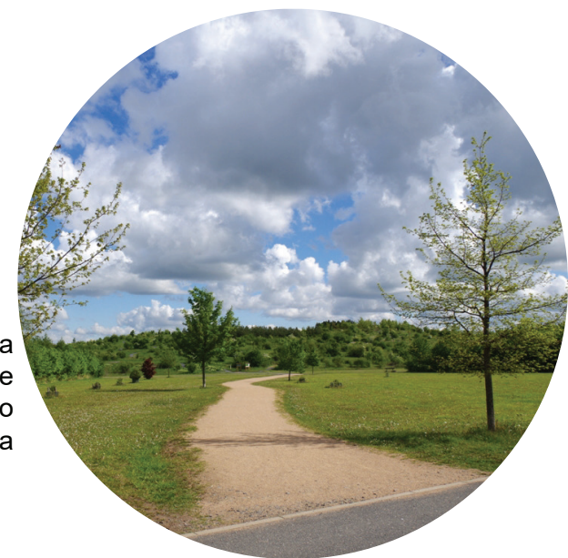
Záhumní krajina s rekreačním pásem navazujícím na sídlo

Vstup Jinonice Přístup s výborným napojením na MHD s jasně definovanou přístupovou cestou do náhorní plošiny s odděleným provozem pro cyklisty a pěší návštěvníky. Přístup provázán s areálem sportoviště. Veřejný prostor je vybaven vhodným mobiliářem, hygienickým zařízením a je doplněn komerčními prostory pro stravovací zařízení a dětským hřištěm. Veřejný prostor tvoří zpevněné plochy a plochy s parkovou úpravou.