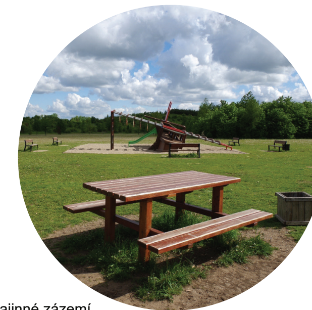
Městské krajinné zázemí s intenzivní rekreací v lesních plochách a otevřených plochách luk a pastvin a sadů