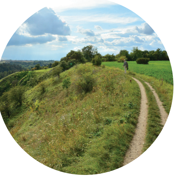
Krajina s historickým odkazem - Butovické hradiště. Náhorní plošina dávného hradiště ohraničená strmými svahy