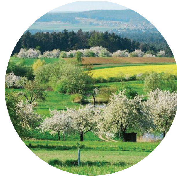
Mozaikovitá krajina zemědělství doplněná ovocnými stromy a lesními porosty

Vstup Galerie Butovice Otevřený prostor spojující Prokopské údolí s okolím retenční nádrže Asuán navazující na pobytové louky. Z otevřeného území vede přehledná cesta k obchodnímu centru umožňující pohodlný přístup do údolí. V místě vybavení hygienickým zařízením, lavičkami pro odpočinek a plochami umožňující aktivní rekreaci (dětské hřiště, přírodní hřiště, vzdělávací či workoutové prvky).