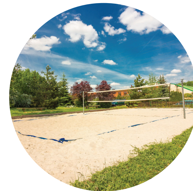
Sportovní rekreační zázemí města s parkem a pobytovými loukami

Vstup Jinonice Přístup s výborným napojením na MHD s jasně definovanou přístupovou cestou do náhorní plošiny s odděleným provozem pro cyklisty a pěší návštěvníky. Přístup provázán s areálem sportoviště. Veřejný prostor je vybaven vhodným mobiliářem, hygienickým zařízením a je doplněn komerčními prostory pro stravovací zařízení a dětským hřištěm. Veřejný prostor tvoří zpevněné plochy a plochy s parkovou úpravou.