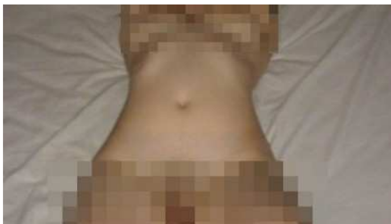
Obrázek 2: Fotografie z případu sextingu z Měřína 26

Serveru idnes.cz se podařilo získat i zhodnocení případu dětskou psycholožkou Václavou Masákovou. Ta se k případu vyjádřila především z pohledu mravního. V rozhovoru přiznává, že mladiství pachatelé jsou rozumově vyspělí, aby pochopili, že se při šíření dopouští trestného činu. Na druhou stranu ale komentuje, že jejich uvědomění si závažnosti jejich chování zaostává ku prospěchu získání obdivu u ostatních teenagerů 25 .