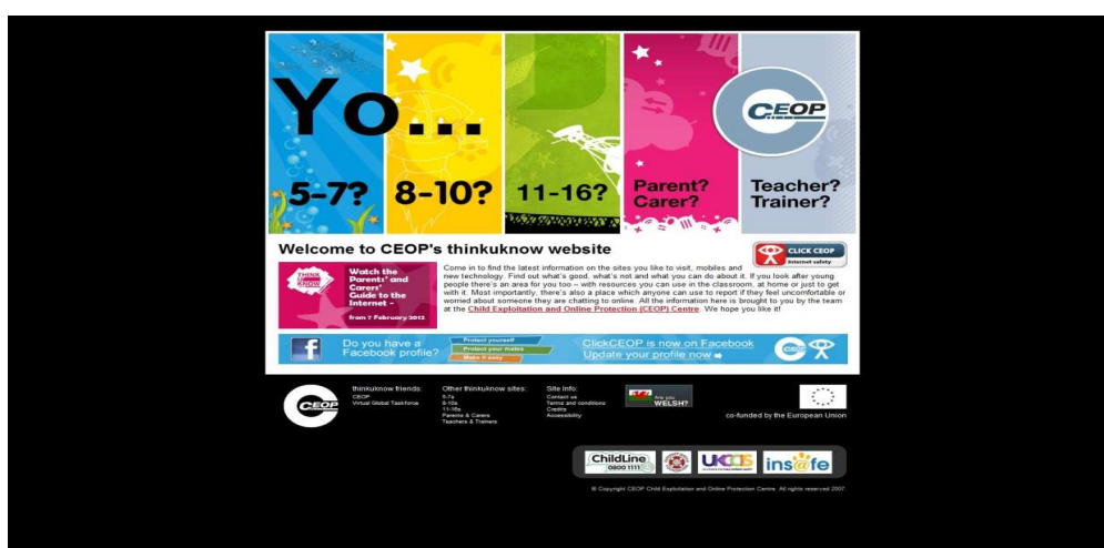
Obrázek 4: Internetové stránky kampaně Thinkuknow 62

Produktem CEOP je kampaň Thinkuknow. Ta na svých internetových stránkách nabízí edukaci pro bezpečné užívání internetu. Stránky nabízí rozcestník podle věkových kategorií dětí a mládež a nabízí také sekci pro rodiče, opatrovníky a pedagogy. Jak ukazuje obrázek 6. první kategorie je určena dětem od 5 do 7 let. Protože děti v tomto věku často ještě neumí číst, nabízí jim Thinkuknow možnost sledovat krátké animované filmy. Některé texty jsou nahrány a děti si je mohou poslechnout.