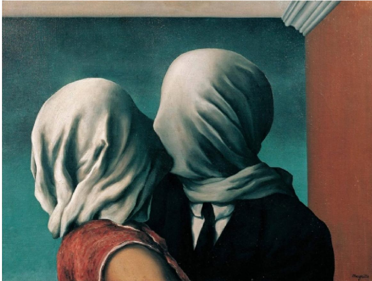
Abb.2: Die Liebenden, 1928 (Les amants), Öl, 54x73 cm, Quelle: http://www.cosmiq.de/qa/show/2756994/Interpretation-von-Die-Liebenden-Gemaelde-von-Rene-Magritte/

Abb.1: Die Liebenden, 1928 (Les amants), Öl, 54x73 cm, Quelle: David Sylvester, Magritte , Brussel 2009, S. 19.