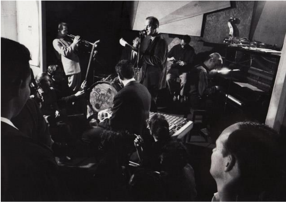
Ilustrace 5: Lawrence Ferlingetti čte poezii za hudebního doprovodu v klubu Cellar roku 1957.