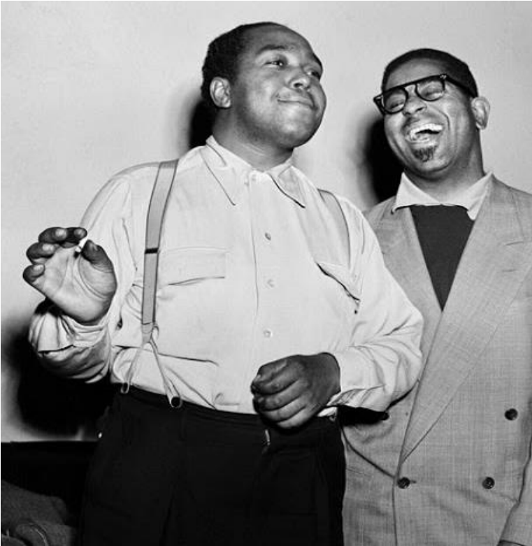
Ilustrace 3: Velikáni bopu Charlie Parker (vlevo) a Dizzy Gillespie v New Yorku roku 1949.