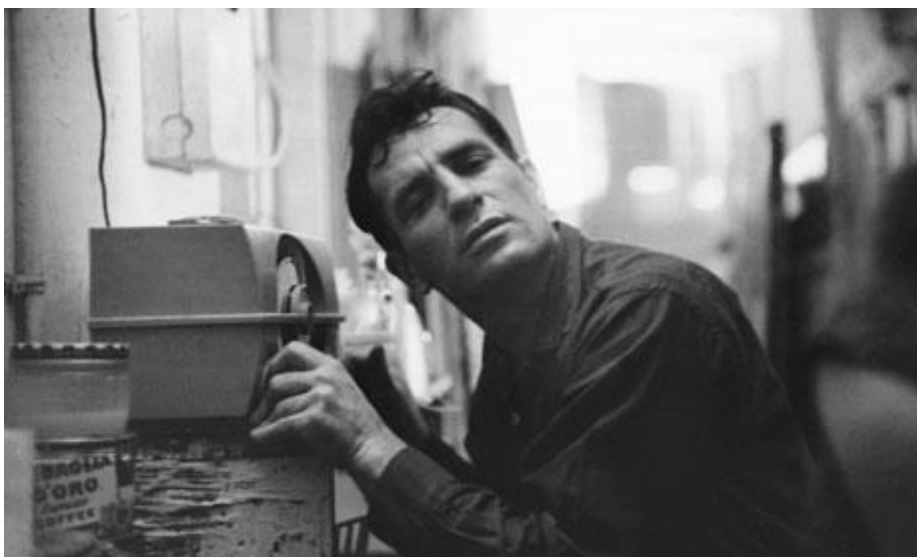
Ilustrace 2: Jack Kerouac fotografovaný roku 1959.