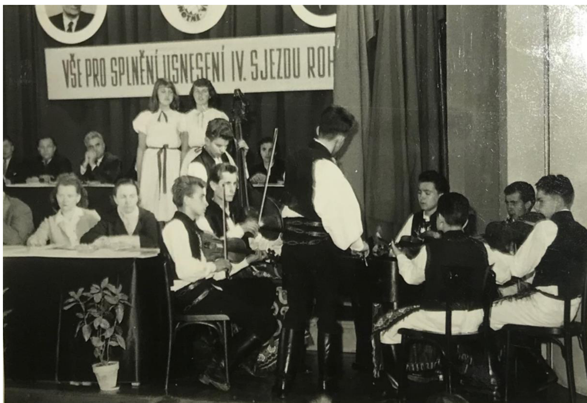
Příloha č. 4: Slováký krúžek před kulturním domem v Osvětí, 1962