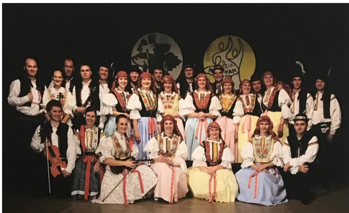
Příloha č. 2: Vystoupení Slovákého krúžku na MFF Strážnice 1957