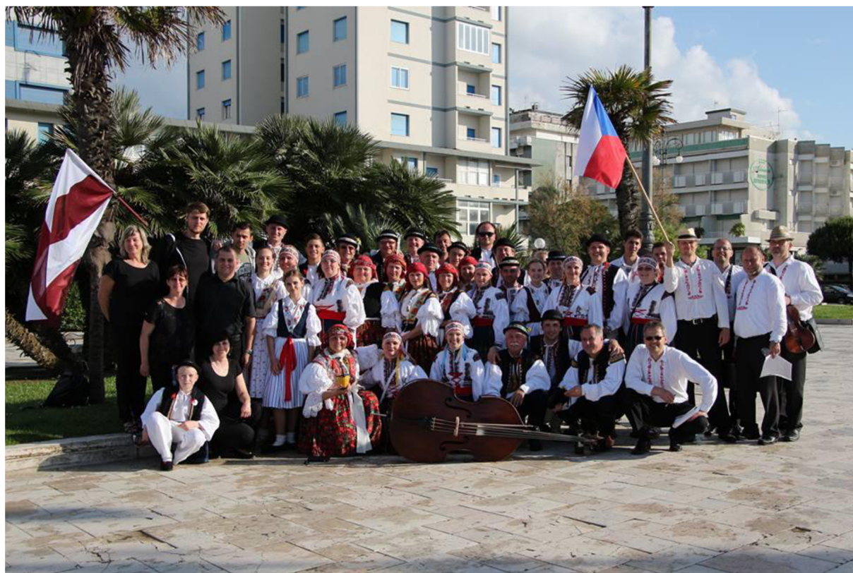
Příloha č. 14: Kulturní léto v Senátu, 2016