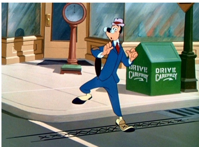
Obr. 19 - Motor Mania - 1950. Slušný občan

Z hlediska znaků, zde můžeme pozorovat signalizaci, a symboly z hlediska dopravních značek. Signalizaci nacházíme z hlediska semaforů, které světelně signalizují, kdy má vozidlo jet a kdy stát. Dopravní značení zde nacházíme například ve formě značky STOP, které znamená, že má řidič na místě zastavit a pokud je to možné pokračovat po zastavení v jízdě.