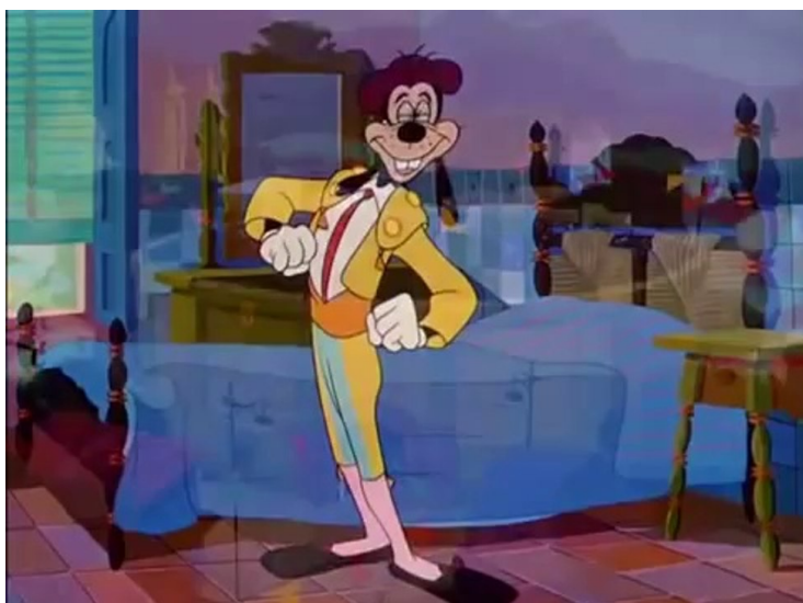
Obr. 26 - For Whom the Bulls Toil - 1953. Póza