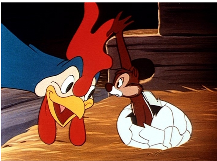
Obr. 22 - Chicken In the Rough - 1951. Mimika kohouta