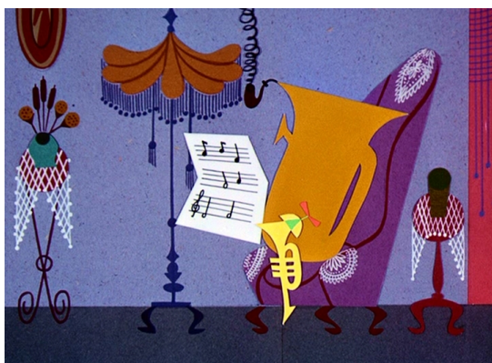
Obr. 9 - The Oomphs - 1952. Otec se synem

Postavy jsou hudební nástroje, a to doslovně. Není zde nic jako ruce či obličej. Pokud postava něco zvedá, tak se onen předmět pouze vznáší ve vzduchu. Nenachází se zde vyloženě vedlejší postavy, všechny mají svůj účel v příběhu, ale prioritou je rodina Oomphasových. Ta je tvořena třemi druhy trumpet. Malý Oompha má své přátele, buben, piano, kontrabas, flétnu a trumpetu. Dále je zde doktor, jehož roli ztvárnila opět flétna. Z hlediska absence obličejů či končetin zde nemůžeme najít přímá gesta a už vůbec ne mimiku. Gesta jsou zde použita jen díky předmětům, ale i tak se objevují minimálně. Příkladem je, když otec hubuje svému synovi, tak používá taktovou hůlku, jakoby ukazoval nám všem známé „ty ty ty“.