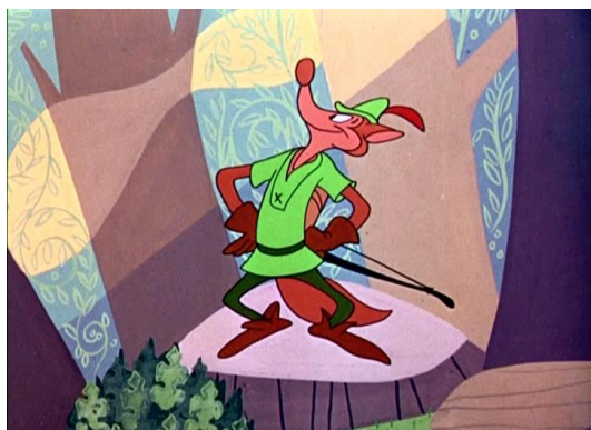
Obr. 2 - Robin Hoodlum - 1948. Lišák