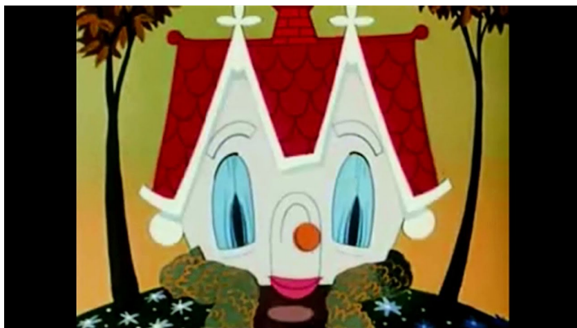
Obr. 23 - The Little House - 1952. The Little House

Lidské postavy pospolu s koňmi jsou zde velice realisticky vyobrazeny. Gesta jsou užita tak ve velmi reálné míře. Například v úvodu přijíždí seznámý pár v kočáře taženého koněm, kde kůň není nijak stylizován a plně odpovídá skutečné předloze. Žena při pohledu na dům upustí kytici v úžasu a otevřené dlaně se objevují v oblasti mezi rameny a výškou očí. Tvář je čitelná, otevřené oči s obočím nahoře a polo otevřená ústa.