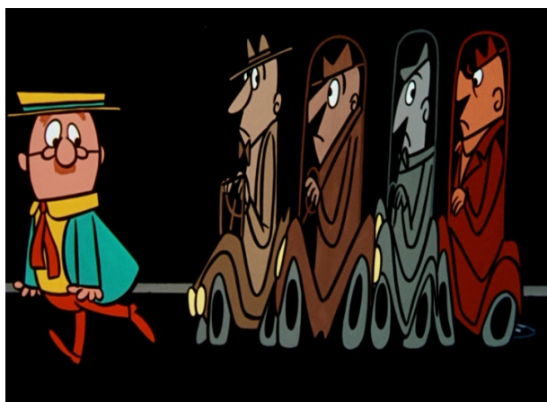
Obr. 13 - The Jaywalker - 1956. Kontrast postav.

Hlavní osoba je znázorněna více propracovaně. Má oblečení různých barev a pleťovou barvu pokožky. Mimika je zde vyjádřena pohyby vousů, které mu zakrývají ústa a pohyby obočí. Emoce jsou pomocí obličejové znázorněny blíže k realitě, gesta jsou zde využity taktéž v hojném počtu.