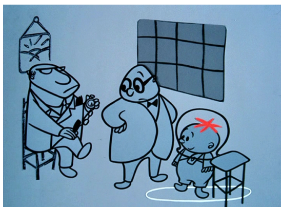
Obr. 11 - Christopher Crumpet - 1953.

Využití mimiky a gest je zde zejména v části z pohledu postav animátora dobře provedené v rámci reálna. V situaci, kdy jeden z přátel otce kuřecího chlapce žádá hoča, aby ukázal svou schopnost manažerovy, jsou použita gesta využita tímto způsobem. Manažer sedí na židli se zavřenýma očima, překříženýma rukama a nohama, vyjadřující své rozhořčení, že někdo plýtvá jeho drahocenným časem. Člověk, který žádá mladíka má v obličeji pohledy zoufalství, spíná ruce a žádá, zároveň v jednom momentě si dává ruce na tvář a vzhlíží vzhůru.