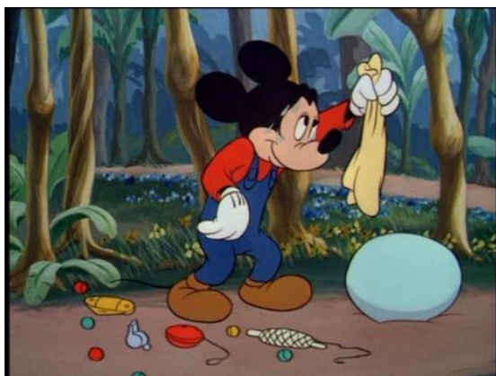
Obr. 15 - Mickey Down Under - 1948. Mickey Mouse