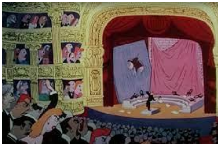
Obr. 3 - The Magic Fluke - 1949. Interiér divadla

Gesta a emoce hlavních postav mají největší projevy v celém snímku. V každé scéně, ve které se nacházejí, vyčnívají. Emoce a gesta jsou podobně jako u předchozího snímku brány s nadsázkou. Díky faktu, že se zde nenachází dialog je kladen větší důraz i na pózy k vyjádření s kým máme tu čest. Lišák je zde ve scénách ztvárněn ve vzpřímené poloze s hlavou nahoru a podle mimiky jsme schopni vidět namyšlený výraz. Zároveň ve chvíli, kdy na začátku hraje s vránou jde vidět díky přehnaným úsměvům a uvolněnému držení těla vyjádření spokojenosti a štěstí. Další důvod díky, kterému postavy vyčnívají je styl, kterým jsou nakresleny. Nedisponují obtaženou hranou a vybledlou barvou, jako zbytek kolem nich.