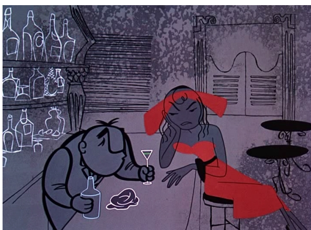
Obr. 8 - Rooty Toot Toot - 1951. Frankí v baru s barmanem.