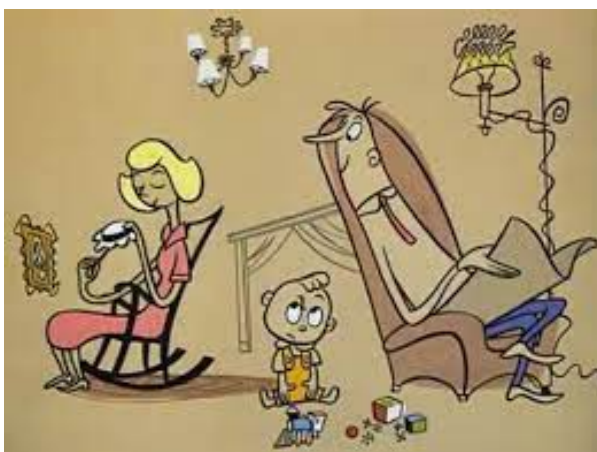
Obr. 5 - Gerald McBoing - Boing - 1950. Rodina v místnosti

Hlavní postavy se skládají z rodiny a chlapce Geralda McBoinga. Gesta a mimika jsou zde poměrně užívány, ale víc se zde projevují gesta. Otec Geralda například je zděšen, když poprvé jeho syn promluví a se zdviženými rukama a vysokým vykopáváním utíká k telefonu. Poslze když žádá doktora o pomoc dramaticky padne na kolena a v dramatické póze má ruku od sebe směrem k zemi.