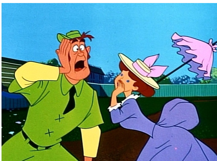
Obr. 27 - Casey Bats Again - 1954. Casey - mimika

Vedlejší postavy jsou zpracovány v ohledu mimiky a gest obdobně. Všechny osoby, na které je bližší záběr a je jich viděno více působí originálně. Každá vlastní jiný nos, vzdálenost očí, druh vousů a barvu či typ oblečení.