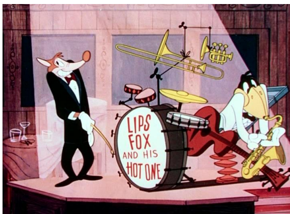
Obr. 4 - The Magic Fluke - 1949. Lišák a Vrána