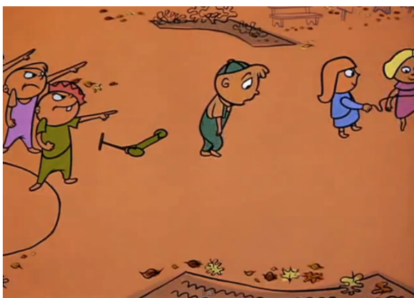
Obr. 6 - Gerald McBoing - Boing - 1950. Hlavní postava v parku