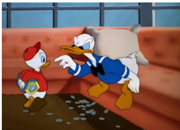
Obr. 18 - Donald's Happy Birthday – 1949. Gesto a Mimika