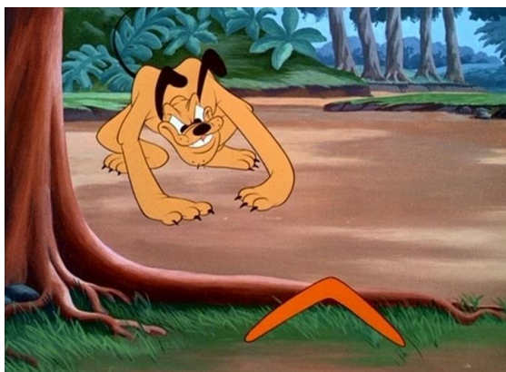
Obr. 16 - Mickey Down Under - 1948. Pluto