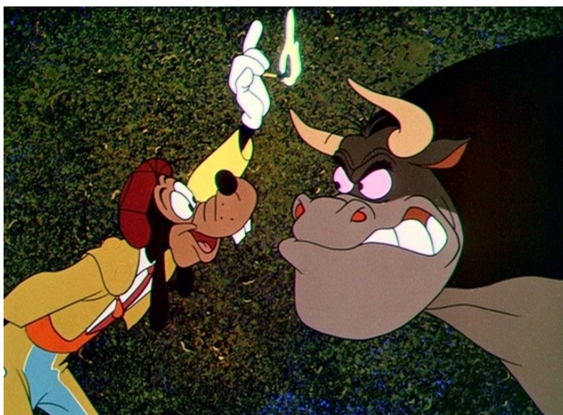
Obr. 25 - For Whom the Bulls Toil - 1953. Mimika

zarudlé oči. Při rozzuření můžeme vidět ústa v přední části zavřené, v zadní rozevřená s jasně viditelnými zuby, obočí v oblasti nosu blíže v zadní dále, a lehce zarudlé oči dokreslují vyjádření vzteku.