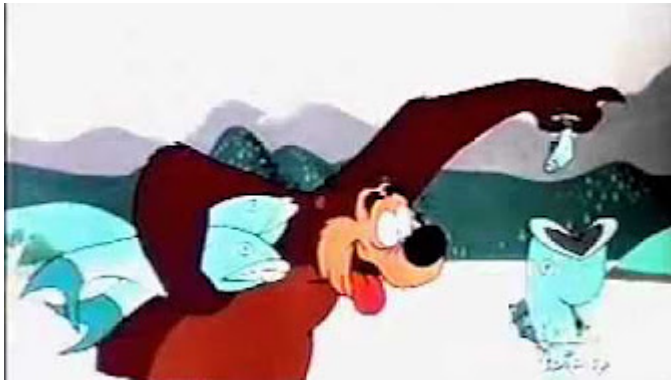
Obr. 30 - Hooked Bear - 1956. Medvěd