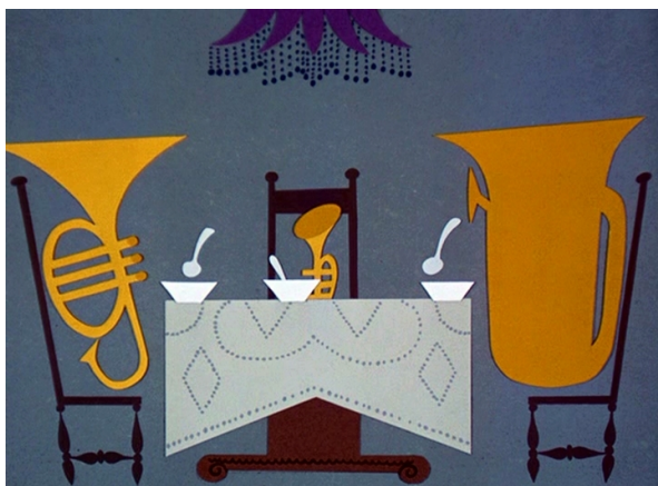
Obr. 10 - The Oompahs - 1952. Večeře.