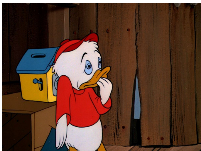
Obr. 17 - Donald's Happy Birthday – 1949. Zděšený výraz

Postavy jsou kačer Donald a jeho tři synovci. Všichni sice vedou dialog, ale v originálním znění jejich ikonický hlas, který je stylizován zvláštním zobákovým chrapněním, brání plnému verbálnímu porozumění. Tato hluchá místa nebrání plnému porozumění, díky gestům či detailu, kdy postava na něco ukazuje. Gesta zde nejsou nijak zvláštně přehrávána a drží se v realistickém ražení. Pozoruhodná scéna nastává na samotném konci příběhu. Donald je zděšen z důvodu, že spáchal špatnou věc. Začne se chytat za hlavu, a hlavně se začne zmenšovat, kdy jako malá myš propadne otvorem v podlaze. Můžeme tento akt označit za znak silného studu, kdy se postava samou hanbou propadne.