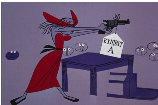
Obr. 7 - Rooty Toot Toot - 1951. Frankí a prostředí po výstřelu

Mimika i přes veškerý minimalismus je výrazná a čitelná. Postoje a gesta jsou do rytmu muziky a postavy i do rytmu při chůzi tančí.