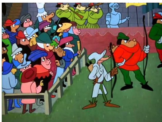
Obr. 1 - Robin Hoodlum - 1948. Turnaj v lukostřelbě

Postavy jsou zpracovány detailně a jsou zobrazeny jako humanoidní zvířata, jako například Mickey Mouse nebo Kačer Donald od Disneyho. Hlavní roli zde mají celkem tři postavičky, na jejich mimiku a gesta je kladen velký důraz. Například, když probíhá rozhovor na soutěži lukostřelby mezi králem a vránou jsou viditelná gesta, kdy král dává ruku vedle svých úst, aby ostatní z obecnstva nevěděli, o čem se baví. Taktéž mimika je provedena od širokých úsměvů, k velkému zděšení projevena otevřením úst a vyvalením očí, ale v reálném smyslu fyziologie. Oči tedy nevyletí a nezvětší se do šílených rozměrů jako tomu bývá u jiných tvůrců. Gesta jsou obecně přehrávána, ale fyziologicky přesná a úderná, zároveň podporují to, co postavy říkají a podle mimiky jsme schopni si domyslet, co se postavičkám honí v hlavě. Výjimka nastává, když se lišák osvobodí pomocí vypití čaje a jeho tělo se nafoukne tak, aby zpřetrhal provazy a osvobodil se. Ostatní osoby jsou taky zpracovány podobným způsobem, jejich mimika ale někdy zamrzá například pokud se jedná o dav lidí, kdy každý má dán jen výraz a jedno gesto, ale stále jsme schopni určit kde jedna začíná a druhá končí a jsme schopni se na každou zaměřit individuálně.