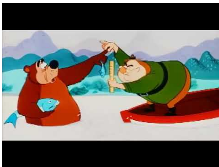
Obr. 29 - Hooked Bear - 1956. Správce parku s medvědem

Vedlejší lidské postavy jsou vyobrazeny více realisticky než postava správce parku. S tím, že každá se liší velikostí nosu, tloušťkou, množstvím svalové hmoty, a tak podobně. Mimické projevy jsou zde lehce přehnané. Příkladem může být chvíle, kdy se vyděsí. Jedna z postav zaujme pozici stáním na patách vytvářející tvar šipky směrem dolů. Ramena jsou výše a ruce jsou podél těla s roztaženými prsty a dlaněmi v horizontální rovině. Hlava se nachází v oblasti ramen, s doširoka otevřenými ústy, kdy nejsme schopni vidět bradu, oči jsou více protažené směrem vzhůru a obočí tvoří šipku směrem vzhůru, čili vnější strany se nachází níže nežli vnitřní.