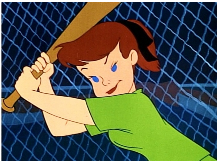
Obr. 28 - Casey Bats Again - 1954. Dívka