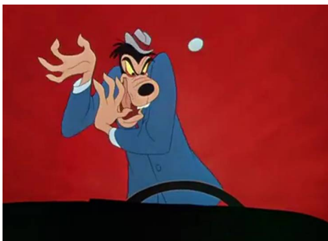
Obr. 20 - motor Mania - 1950. Šílený řidič