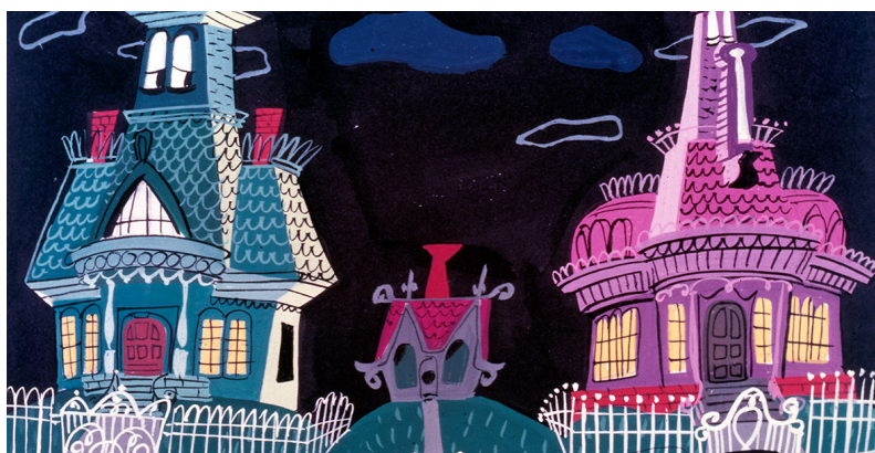
Obr. 24 - The Little House - 1952. Kontrast s ostatními domy.