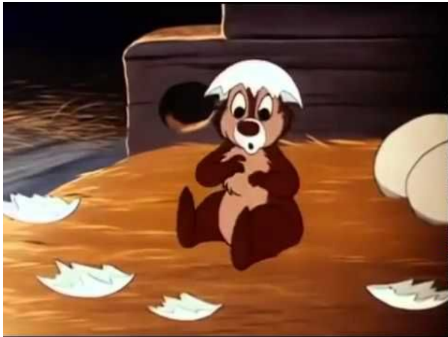
Obr. 21 - Chicken In The Rough - 1951. Překvapený výraz