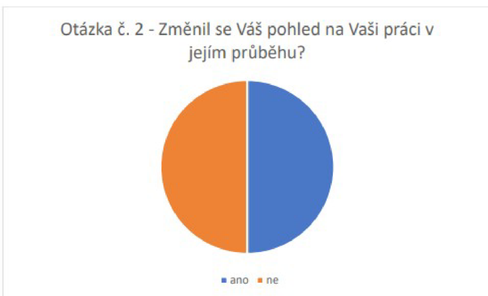
Graf 2: Vyhodnocení otázky číslo 2