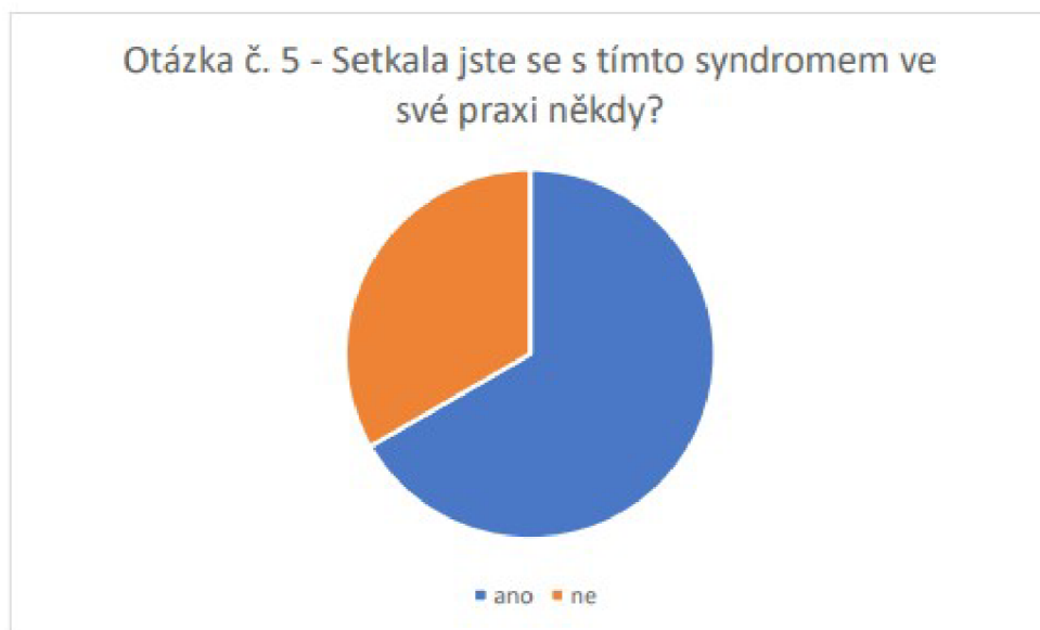
Graf 3: Vyhodnocení otázky číslo 5

nepřestala bavit, případně že se ještě nemohli z důvodu krátkého setrvání v pozici setkat právě se syndromem vyhoření.