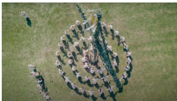
obrázek č. 4 – kompozice na střed

Sémantické prvky spojené s technikou záběrování nelze generalizovat. Můžeme však rozklíčovat společné parametry, které se objevují napříč folklórními horory. Podle Ricka Altmana do sémantických prvků patří obecná atmosféra snímku. Stylisticky je snímek nejpodobnější filmu The Wicker Man (1973), kde se pravý děs odehrává za bílého dne. Pro folklórní horor není ale podstatná paleta barev, ale atmosféra úzkosti vycházející ze strachu k jiné společnosti a jejich každodenním zvykům. Je tedy podstatné zobrazit onu každodennost, která se pojí jak s denním životem, tak s tím nočním. Co se týče technických aspektů záběrování, podobné sémantické prvky můžeme najít ve snímku The Blood on Satan's Claw (1971), kde je důraz na půdu vystavěn za použití celků a pohledů kamery, zatímco ve Slunovratu se element půdy zdůraznil velkými celky nebo ptačí perspektivou, při níž je v rámu pouze půda (obrázek č. 5). Technický rámeček je tedy použit jinak, ale zobrazuje stejný motiv. Podobnosti ale nalezneme v pohybu kamery. Ve všech filmech nesvaté trojice není kamera příliš aktivní, spíše nenápadně sleduje každodennost postav. Stejně tak je kamera použita v případě Slunovratu , až na jednu výjimku, kdy se jedna z postav dívá přímo do kamery.