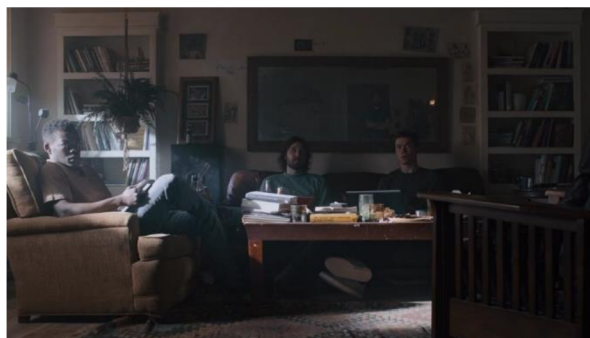
obrázek č. 2 – efekt zrcadla

Jakmile ústřední postavy docestují do Švédska, změní se celá paleta barev a s ní i atmosféra. Obraz je soustředěn zejména na krajinu, tudíž je často použit celek nebo velký celek s pomalým horizontálním švenkem. Detailnější záběry jsou použity především na postavu Dani a Christiana a jejich obličejové výrazy. Co se týče samotné Dani, jsou použity i záběry point-of-view (POV), které mají dvojí účinek. Zaprvé jsme vystaveni stejným vjemům jako Dani, což nás nutí s postavou empatizovat. Druhý účinek je spojen s vizuálními efekty, respektive, když je Dani vystavena psychedelickým látkám a tím i my jako diváci vidíme zdeformovaný obraz.