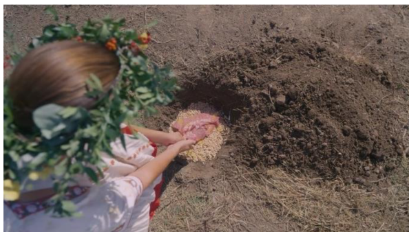
obrázek č. 5 – ptačí perspektiva

Tato výjimka je ale téměř nezaznamatelná a funguje jako pozvání diváků do světa Hårgy. The Wicker Man (1973), The Witch (2015) a Slunovrat mají zase podobné stylistické motivy v zobrazování a zdůrazňování zvěře. The Witchfinder General (1968) a The Blood on Satan's Claw (1971) explicitně zobrazují brutální rituální vraždy, což je prvek opakující se i v případě Slunovratu .