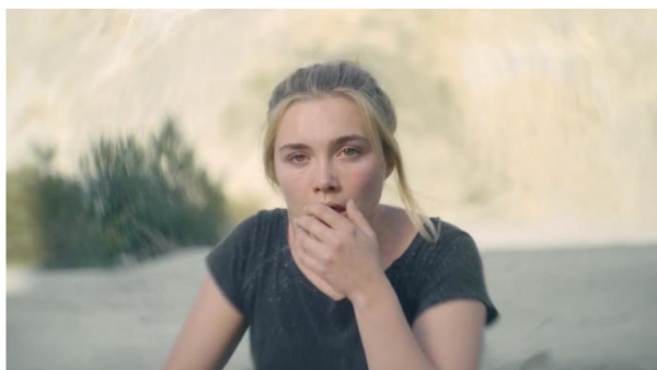
obrázek č. 8 – VFX efekt rozmazání