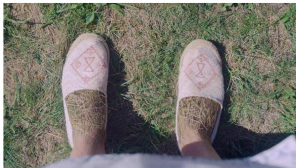
obrázek č. 7 – VFX efekt