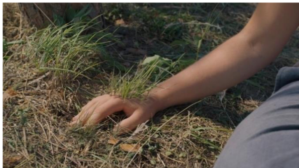
obrázek č. 6 – VFX efekt