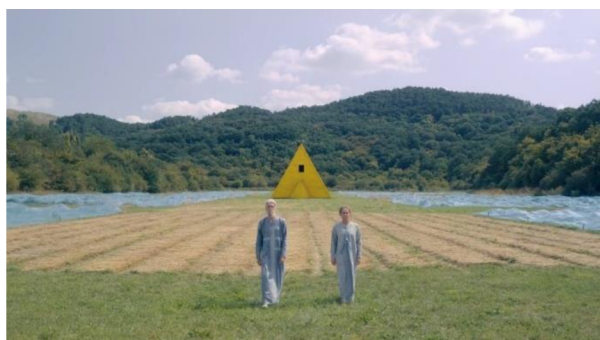
obrázek č. 3 – kompozice na střed

efektu přispívá i paleta barev. Louka je pastelově zelená, vnitřek domů je natřen na bílo a ozdoben kresbami a ornamenty, kostýmy jsou bílé s modrým lemováním a hlavní chrám je natřen svítivě žlutou barvou. Tyto výjevy jsou zesíleny i narativním časovým rámcem, kdy se celý děj odehrává v době švédského slunovratu, tudíž je stále „denní“ světlo. Nejlépe vystihl vizuální stránku herec Jack Reynor ztvárňující postavu Christiana v rozhovoru pro Rotten Tomatoes: „Nikde, v žádném rohu není stín, ale temnota je všude.“ 54