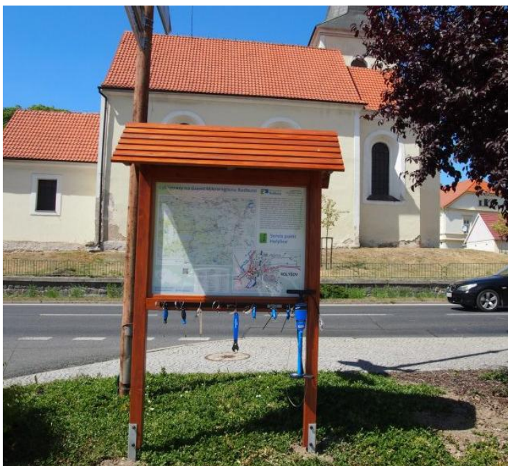
Obrázek 4 – Stanoviště s vybavením na opravu jízdních kol v Holýšově

Všechny tři vybrané projekty se týkají mimo jiných i tří zvolených obcí Holýšov, Stod a Dobřany. Jedná se o obce s největším počtem obyvatel, největší rozlohou a nejrozmanitější vybaveností (školy, školky, zdravotnická péče, policie). Podrobněji budou charakterizovány v další kapitole.