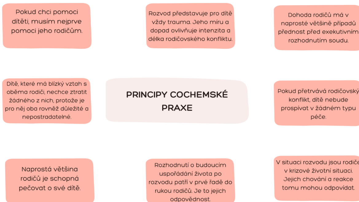
Obrázek 2: Principy Cochemské praxe, zdroj: Cochem, 2020, [online]

o sebezkušenostní skupiny, spolupráci s psychologem, zapojení do mediace apod (Cochem, 2020, s. 12-14, [online]).