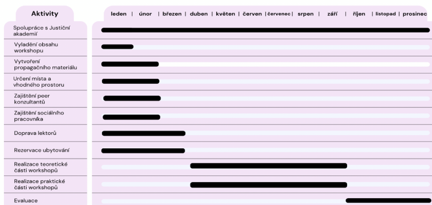
Obrázek 3: Roční harmonogram