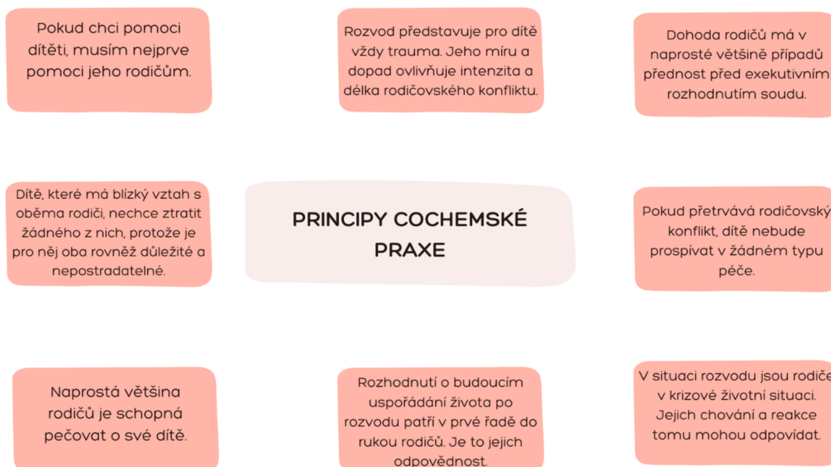
Obrázek 2: Principy Cochemské praxe, zdroj: Cochem, 2020, [online]

o sebezkušenostní skupiny, spolupráci s psychologem, zapojení do mediace apod (Cochem, 2020, s. 12-14, [online]).