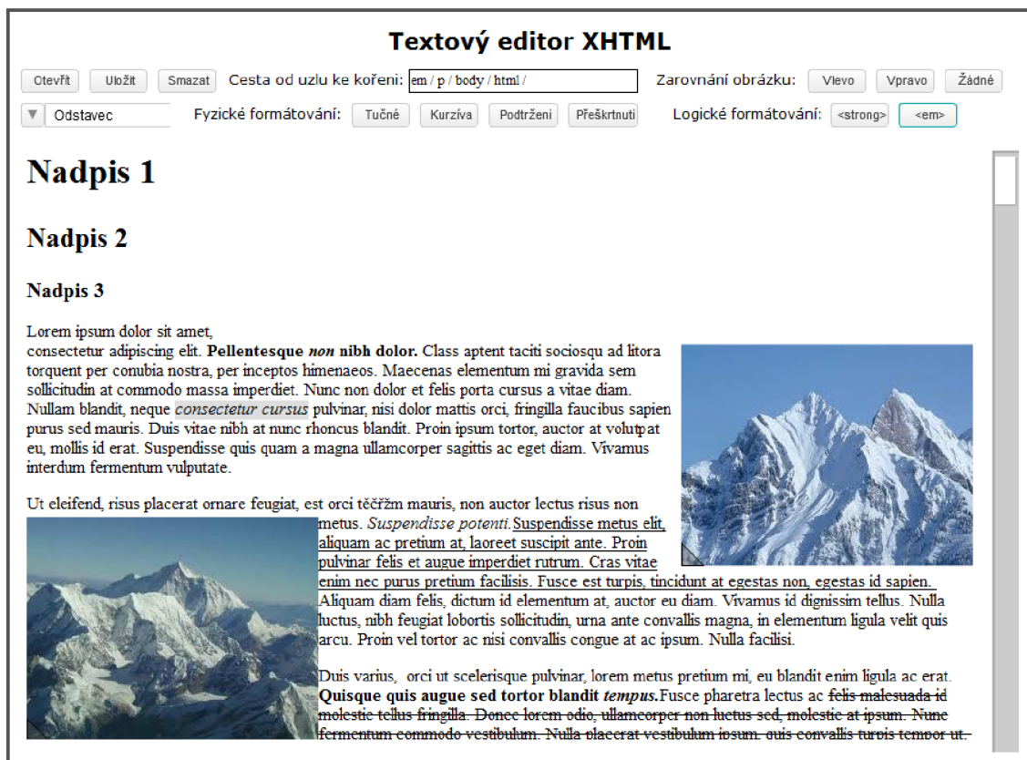
Obrázek 6.1: Ukázka výsledné funkcionality editoru

Vytvořením vlastních tlačítek a textových polí a jejich připojením k metodám editoru vznikají nástroje pro práci s textem. V příkladu jsem použil třídu pro tlačítka, kterou mi poskytl vedoucí bakalářské práce. Posuvník je převzat ze svobodného projektu „haXe minimalcomps“ (viz [9]). Popis aplikačního rozhraní je v následující kapitole.