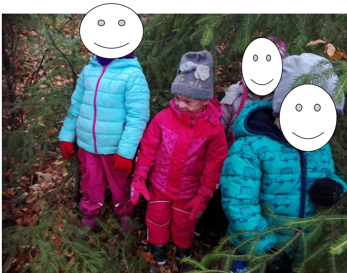
Obr. 2 Hry v lese