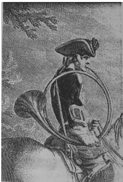
Obrázek 3: Pikér na koni s parforsním rohem v pravé ruce