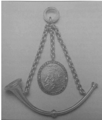
Obrázek 4: Oválný medailon Řádu sv. Huberta