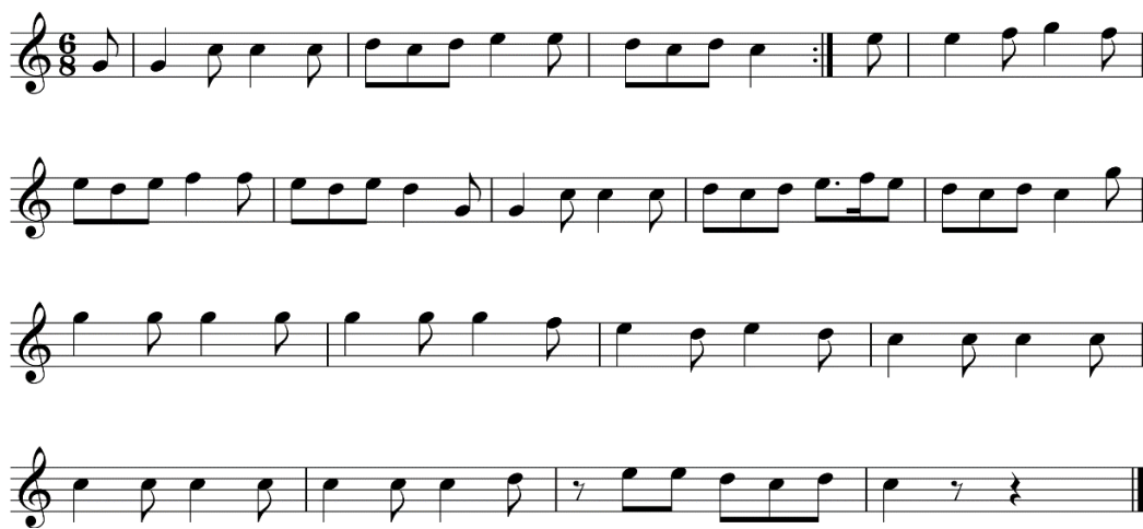
Obrázek 2: Hubertská árie