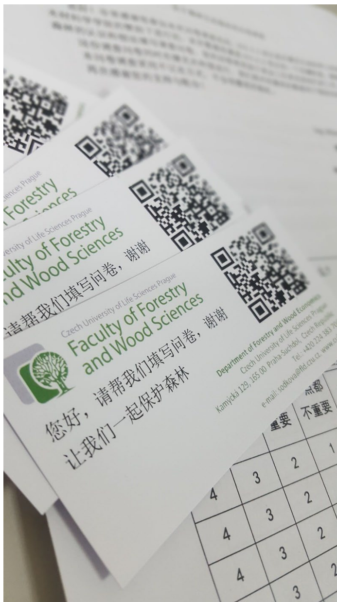
Příloha 2: Dotazníkové šetření v Číně, QR kódy odkazující na dotazník v elektronické podobě