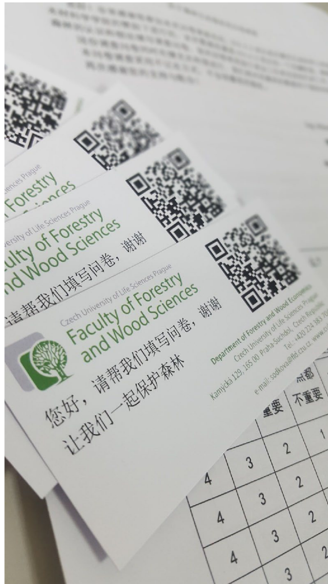
Příloha 2: Dotazníkové šetření v Číně, QR kódy odkazující na dotazník v elektronické podobě