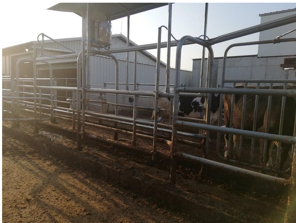
Obrázek 4: Snímač zvýšené aktivity