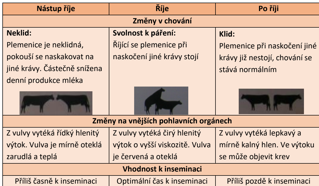
Tabulka 3: Typické projevy říje

Části estrálního cyklu se dělí na fáze proestru, estru, metestru a diestru. Tyto fáze jsou charakteristické vnějšími projevy i typickými změnami na pohlavních orgánech (Tabulka 3) (Fradson et al. 2009).