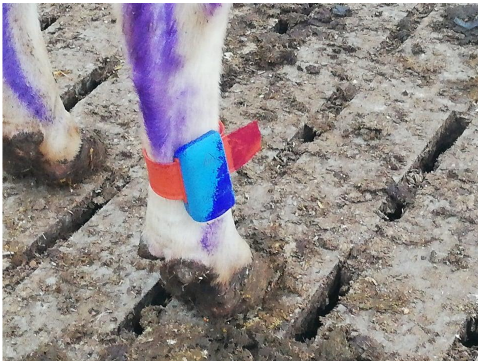
Obrázek 3: Pedometry používané na farmě skotu v Násedlovicích