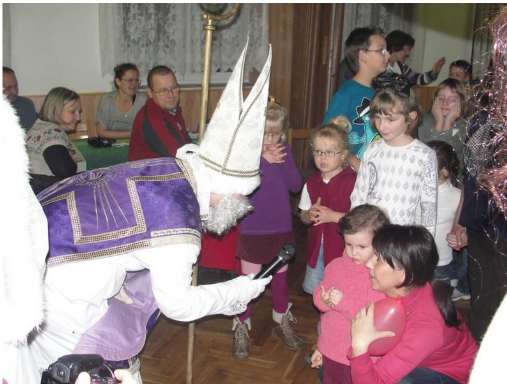
Obrázek 7: Mikulášská nadílka pro děti