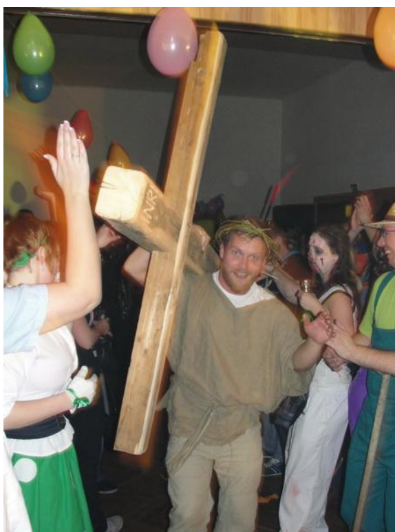
Obrázek 4: Večerní maškarní zábava