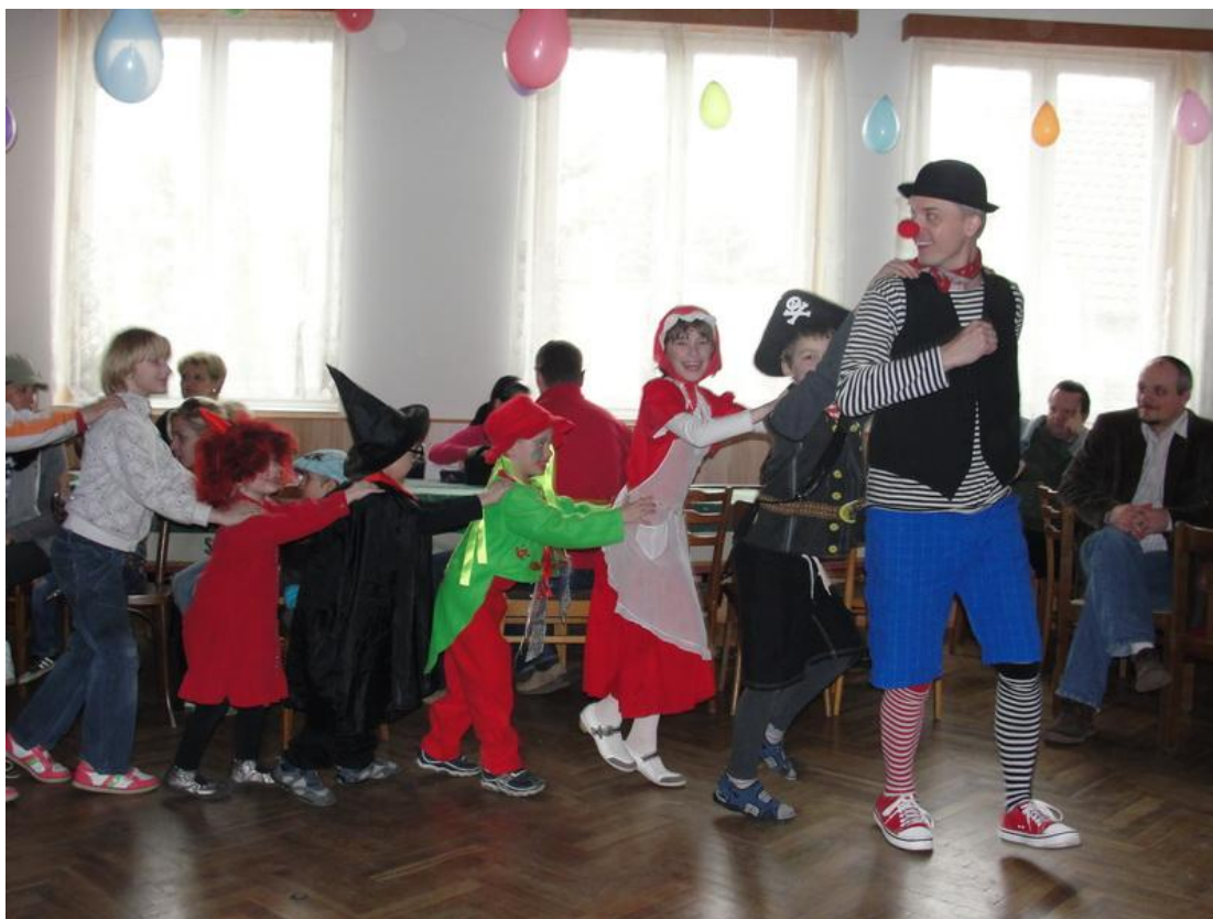
Obrázek 3: Děský maškarní karneval