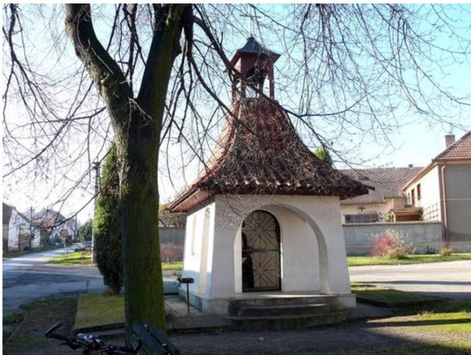
Obrázek 2: Kaplička v horní části obce