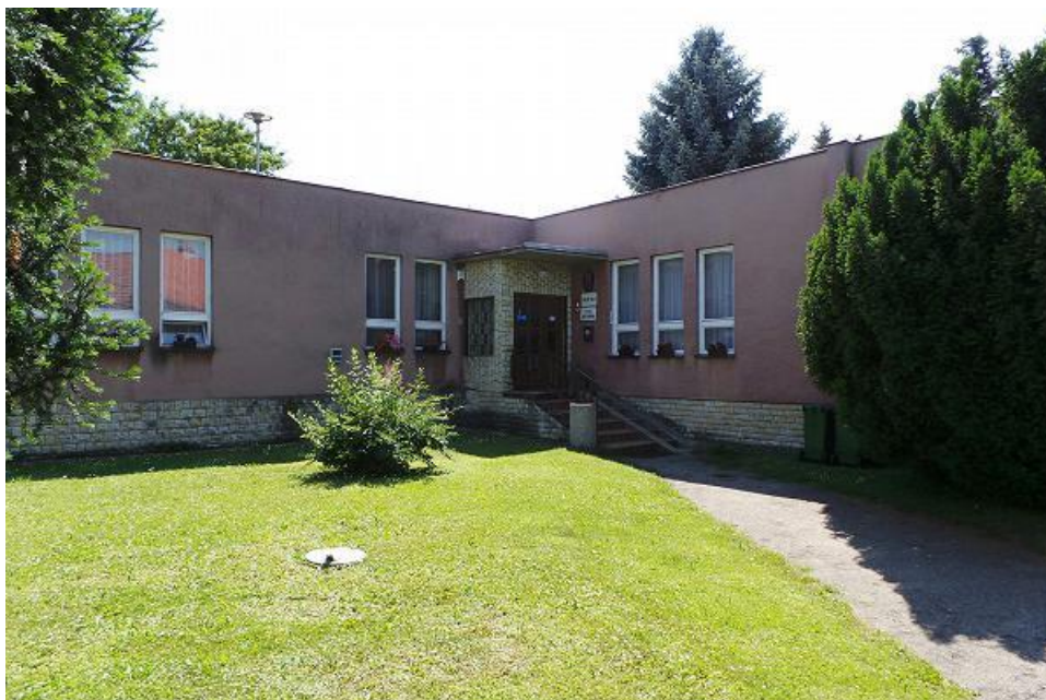
Obrázek 1: Obecní úřad Ptice