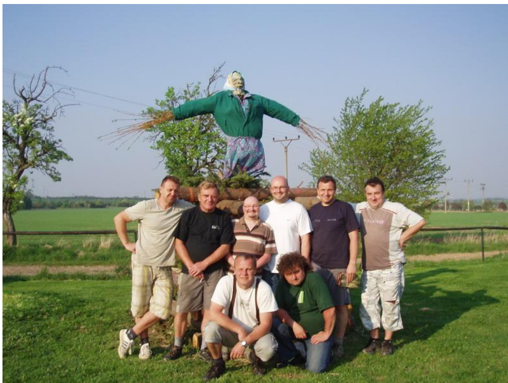
Obrázek 8: Příprava na pálení čarodějnic a někteří členové spolku