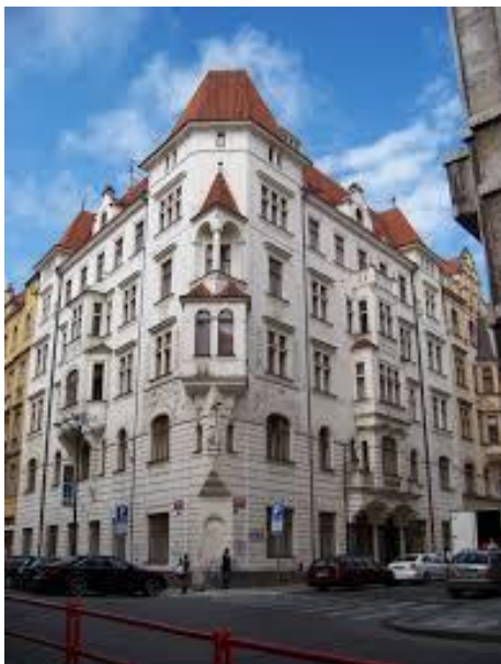
Obr. 10 Slovanský dům v Praze

Finanční zajištění mu umožnilo pořídit si v Praze v domě ve Valentinské ulici byt a protože byl velmi společenský člověk, zval si a hostil své kolegy a také si zde umístil svou vlastní odbornou knihovnu. Dům je v těsném sousedství Klementina (sídlo Univerzitní knihovny). Dnes je dům ve Valentinské ulici sídlem Slovanského ústavu .