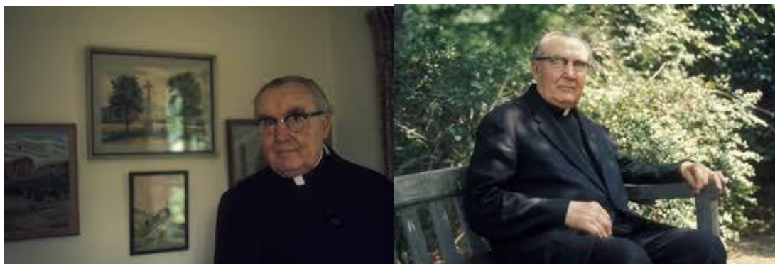
Obr. 14 a 15 František Dvorník v Dumbarton Oaks

Dumbarton Oaks. Současně byl také jmenován řádným profesorem Harvardovy univerzity. Bylo to poprvé, kdy byl katolický kněz ustanoven řádným profesorem této jinak výrazně protestantské univerzity. V Dumbarton Oaks našel profesor Dvorník mimořádně příznivé podmínky pro svou práci.