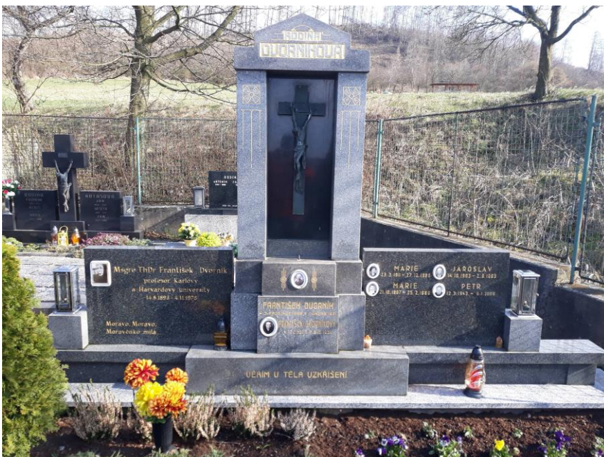
Obr. 17 Hrobka rodiny Dvorníkovy v Bílavsku