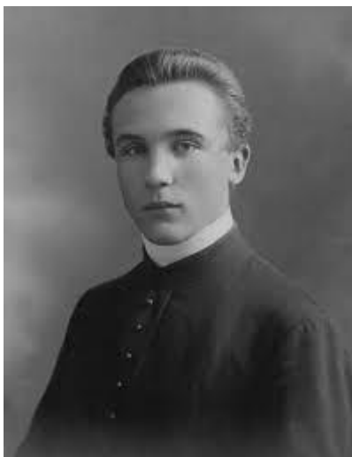
Obr.5 František Dvorník jako mladý kněz (1916-1919)

On se však zajímal o vědeckou činnost a proto na začátku roku 1919 požádal o uvolnění z této povinnosti s odůvodněním, že chce dokončit práci na své dizertaci. Po její úspěšné obhajobě získal v roce 1920 hodnost doktora teologie.