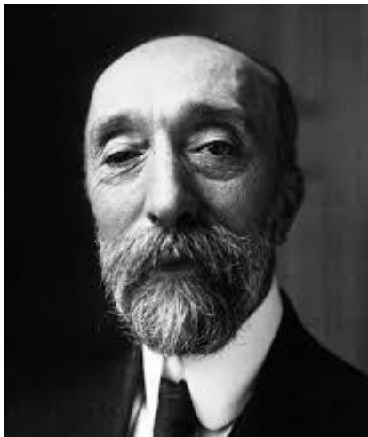
Obr.7 Charles Diehl

Obrat v osudu profesora Dvorníka přineslo jeho setkání s představiteli Národního svazu amerických katolíků, na něž mladý kněz tak hluboce zapůsobil, že se rozhodli poskytnout mu stipendium ve výši 500 dolarů, které mu mělo pomoci ke studiu v cizině - mladý student mohl uskutečnit svůj sen – odjet do Francie a zapsat se ke studiu na pařížské Sorbonně. Mohl tam využít bohatství knihoven, stejně jako příležitost studovat u řady vynikajících vědců, z nichž ho nejvíce zaujal Charles Diehl , jeden z předních byzantologů té doby.