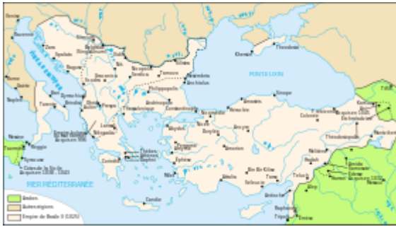
Obr.2 Byzantská říše