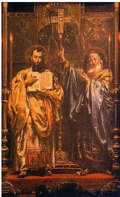
Obr.8 Svatí Konstantin a Metoděj

Svatí Konstantin (Cyril) a Metoděj (Solunští bratři, Apoštolové Slovanů či Slovanští věrozvěstové) byli bratři ze Soluně, kteří v rámci své misie na Velké Moravě – přišli v roce 863 – prosadili staroslověňštinu jako bohoslužebný jazyk, pro který Konstantin také vytvořil písmo, hlaholici.