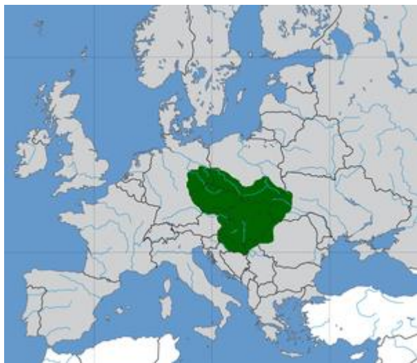
Obr. 9 Mapa Velké Moravy

Svatí Konstantin (Cyril) a Metoděj (Solunští bratři, Apoštolové Slovanů či Slovanští věrozvěstové) byli bratři ze Soluně, kteří v rámci své misie na Velké Moravě – přišli v roce 863 – prosadili staroslověňštinu jako bohoslužebný jazyk, pro který Konstantin také vytvořil písmo, hlaholici.