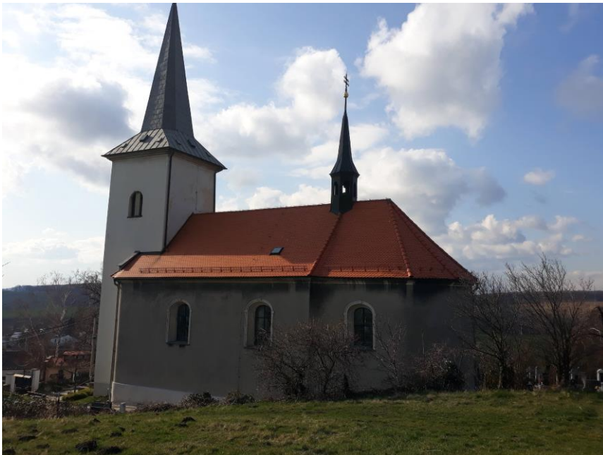
Obr. 16 Kostel sv. Bartoloměje v Bílavsku, kde František Dvorník slavil svoji primiční mši svatou

poslední knihu už bohužel nedokončil. Zemřel 4.listopadu 1975. Jeho pohřbu se zúčastnilo téměř 100 duchovních nejen ze širokého okolí, ale i z Prahy. Byl pohřben v rodinném hrobě na hřbitově při kostelíku, v němž kdysi jako nově vysvěcený kněz sloužil svou první mši svatou.