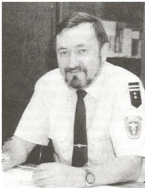
(Obr. 4. JUDr. Miroslav Kárník, Hodnotíme rok 1995 . Clo-Douane, 1995, roč. XXIX, č. 12, s. 3)