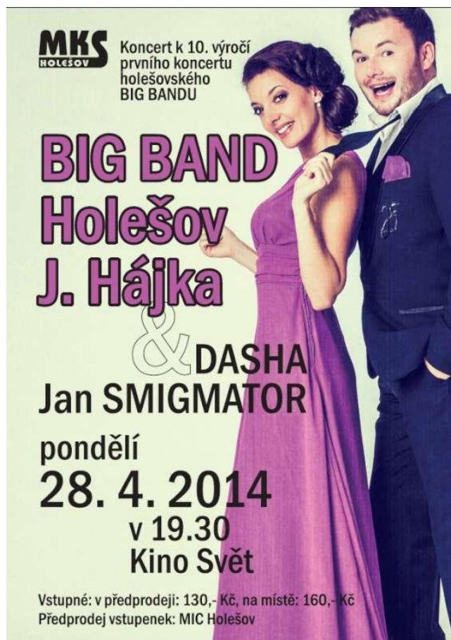
Příloha č. 16 - Plakát Big Bandu Holešov