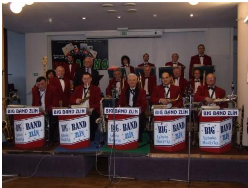
Příloha č. 8 - Big Band Zlín