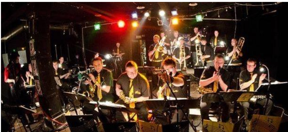
Příloha č. 12 - Avion Big Band