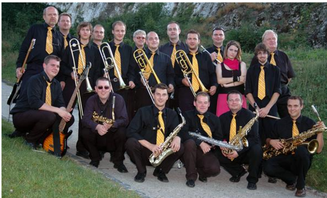
Příloha č. 10 - Avion Swing Band

(dostupné z www.avionswingband.cz/foto.php?dir=Kapela&page=2 )