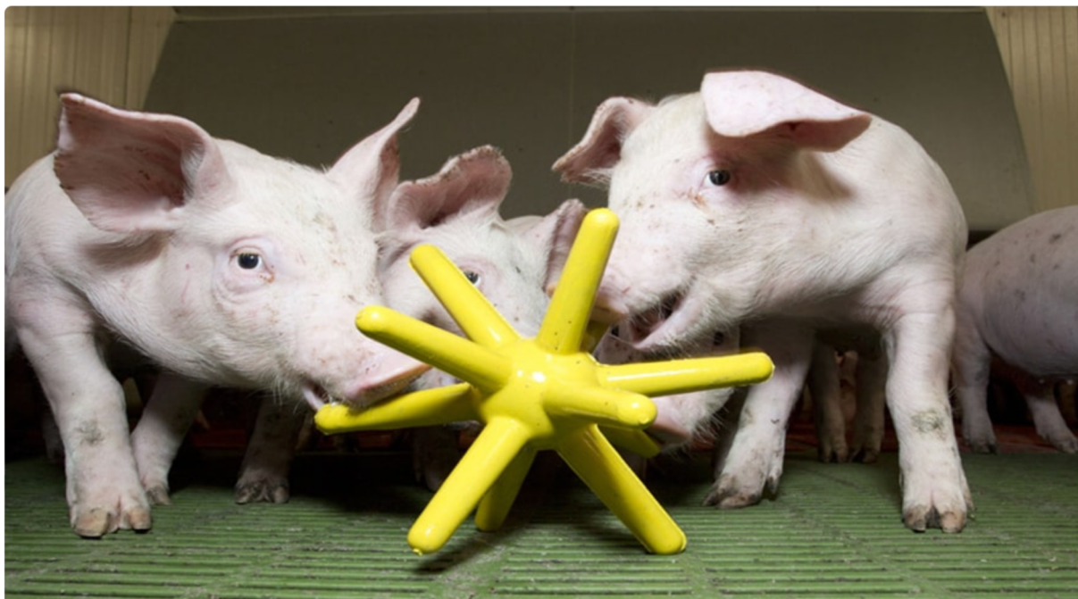
Obrázek 1 – Vhodná hračka pro prasata (O'Driscoll)