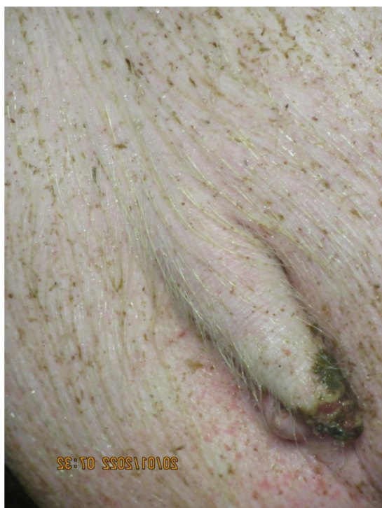
Obrázek 2 - Poranění ocásku, kdy větší část chybí (Štroblová 2022)