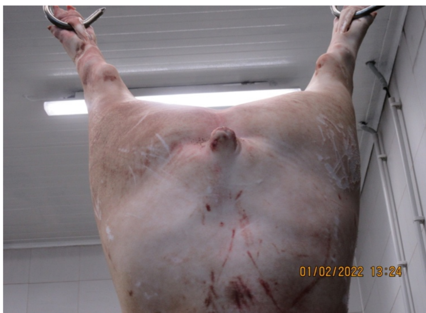
Obrázek 3 - Na jatečném těle chybí celý ocásek (Štroblová 2022)