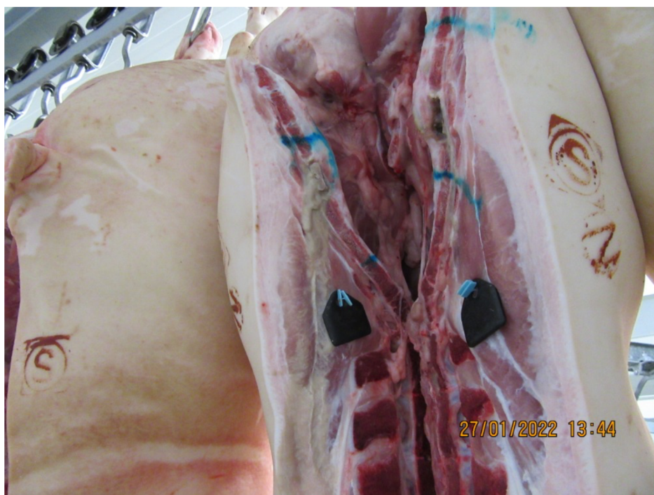
Obrázek 6 - Zánětlivé změny postoupily krevní cestou až do bederní krajiny (Štroblová 2022)