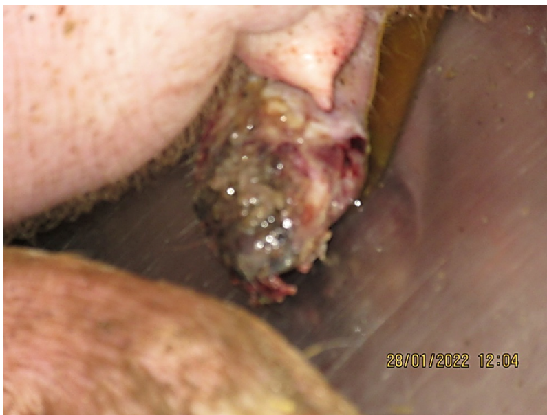
Obrázek 5 - Poranění ocásku s velkými nekrotickými změnami (Štroblová 2022)