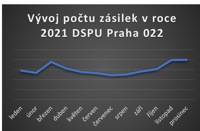
Graf 1 - Vývoj počtu zásilek v roce 2021

Kapitola se zabývá kvantitativní využití DSPU Praha 022 v Malešicích v průběhu jednoho roku (2021). Poptávka po využití služeb České pošty nebo i jiných spedičních firem není v průběhu roku konstantní. Takzvaná hlavní sezóna začíná od přelomu září a října a končí až začátkem března. Primární náplní hlavní sezóny jsou samozřejmě Vánoce, na které se lidé začínají připravovat již v říjnu a vyšší poptávka po zasilatelských službách přetrvává až do nového roku kde se v jeho počátku často vyřizují reklamace či nákupy zboží ve slevách.