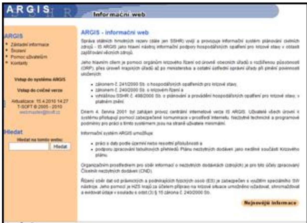
Obrázek 1: Stránka programu ARGIS