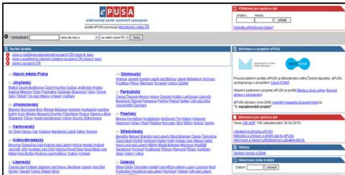
Obrázek 2: Úvodní stránka programu e-PUSA

Úvodní stránka portálu zobrazuje rozvržení podle krajů ČR spolu s odkazy (zkratkami) přímo na větší města daného kraje. Popisky: vyhledávání nahoře, rychlé zkratky těsně pod, zkratka kraje vlevo, správní obvody a úřady, sekce odkazy. v každém momentě navigace je v horní části stránky formulář pro vyhledávání obce, subjektu či zřizované organizace podle názvu, nebo osoby podle jména na území celé ČR nebo na aktuálně zvoleném území. K dispozici jsou taktéž tzv. rychlé zkratky, které umožňují přeskokovat jednotlivé úrovně vypisování a umožňují např. výpis všech okresů na území ČR bez potřeby výběru kraje.