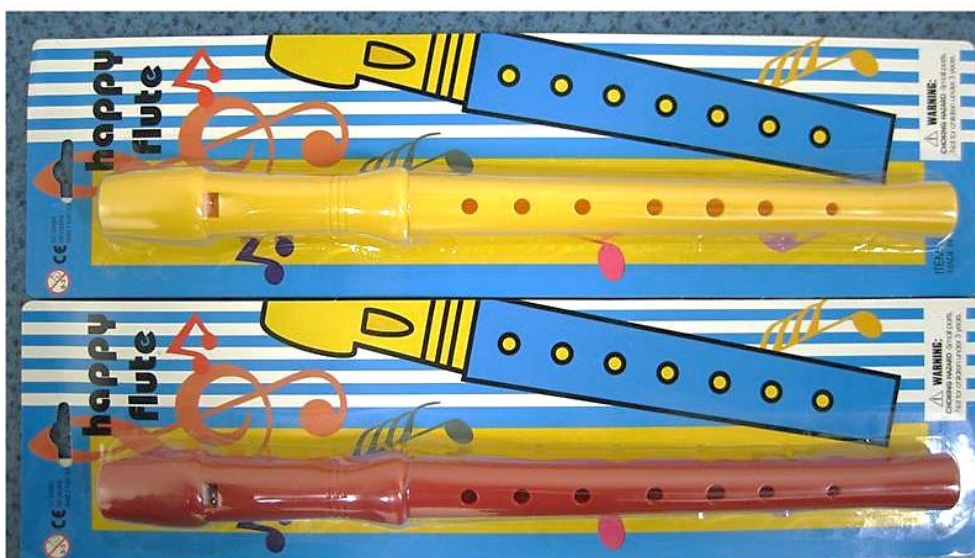
Obrázek č. 10.: Plastová flétna Happy Flute rozbalená 80