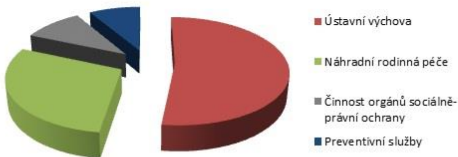
Graf č.1 – Struktura výdajů v systému o ohrožené děti. 2014.