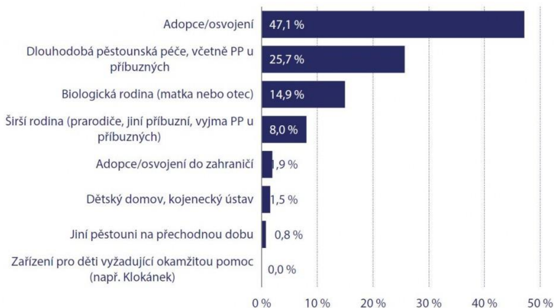
Graf č. 16: Kam děti odešly z PPPD

Graf č.2 - Kam odcházejí děti z přechodné pěstounské péče.