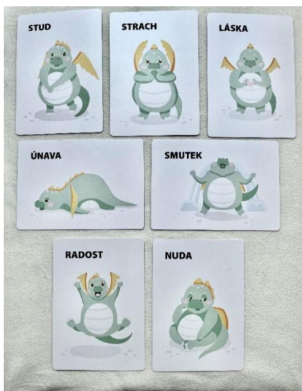
Obrázek 1 – emoce (Pešáková, 2022)

Dílčím cílem bakalářské práce bylo zmapování emocí. Aby se tento cíl mohl zrealizovat, využily se ilustrační kartičky s emocemi z publikace Školka pro mě – Jak si užít školku zábavně a citlivě. (Pešáková, 2022) K zhotovení obrazu vnímání hudby u dětí se sluchovým postižením, tak posloužilo schéma ilustrovaných emocí, ke kterým děti přiřazovaly kartičku se zvířátkem.