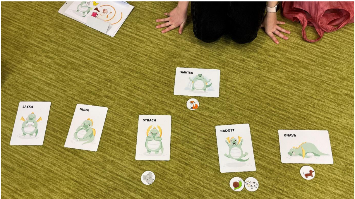
Obrázek 5 – emoce dětí po hudební aktivitě