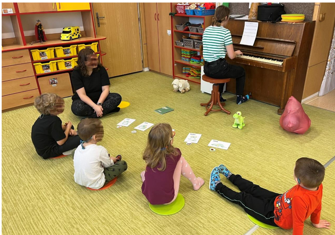
Obrázek 4 – interpretace hudební aktivity

k lepšímu vnímání vibrací. K počátečnímu strachu z narušení průběhu činnosti nedošlo a děti balonky držely vzorně na zemi, a to po celou dobu písně.