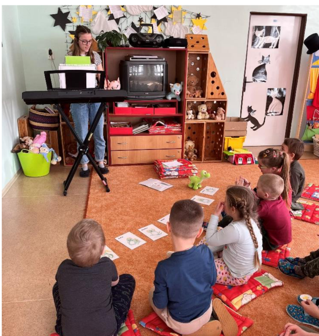
Obrázek 6 – hudební aktivita MŠ Velký Týnec