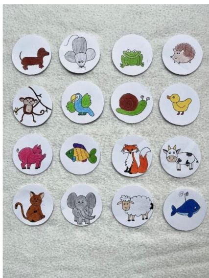
Obrázek 2 – kartičky se zvířátky