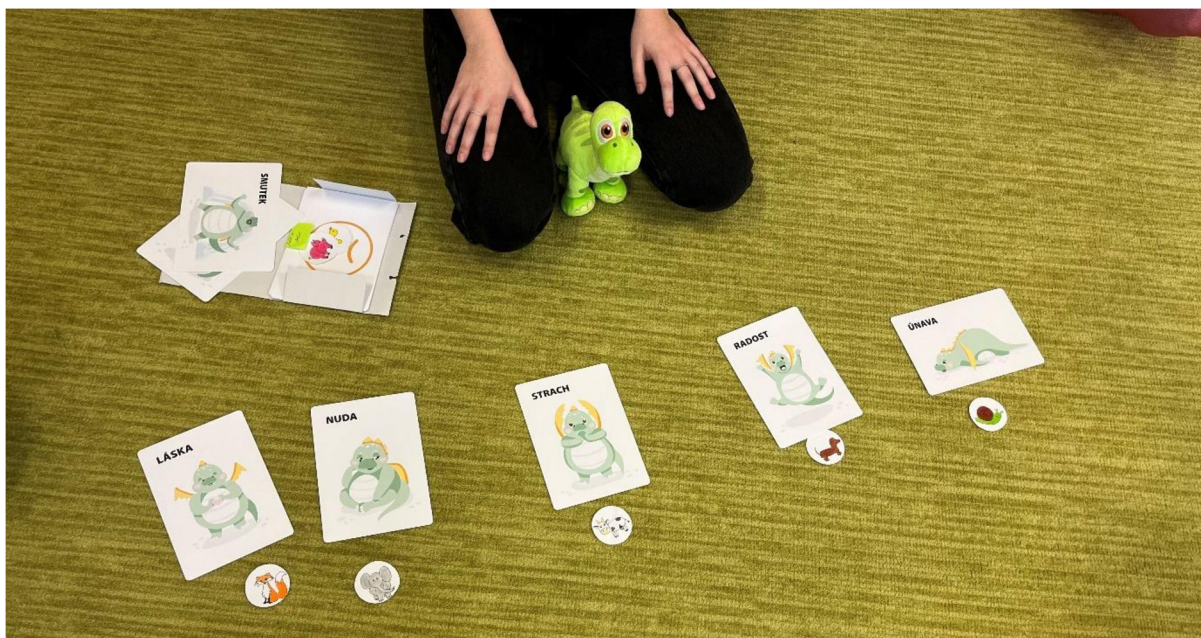
Obrázek 3 – emoce dětí před hudební činností

Pro lepší pochopení a názornou ukázkou, se zapojila i autorka a jako první vyjádřila svou emoci a položila kartičku k dané ilustraci. Některé děti s určováním problém neměly a kartičku přiřadily okamžitě. U nejmladšího chlapce bylo patrné, že váhá. U něj by bylo vhodnější, kdyby se s emocemi pracovalo delší dobu, třeba po dobu týdne. Nicméně, takhle nám vznikla odpověď na otázku, jak se děti cítí před hudební činností.