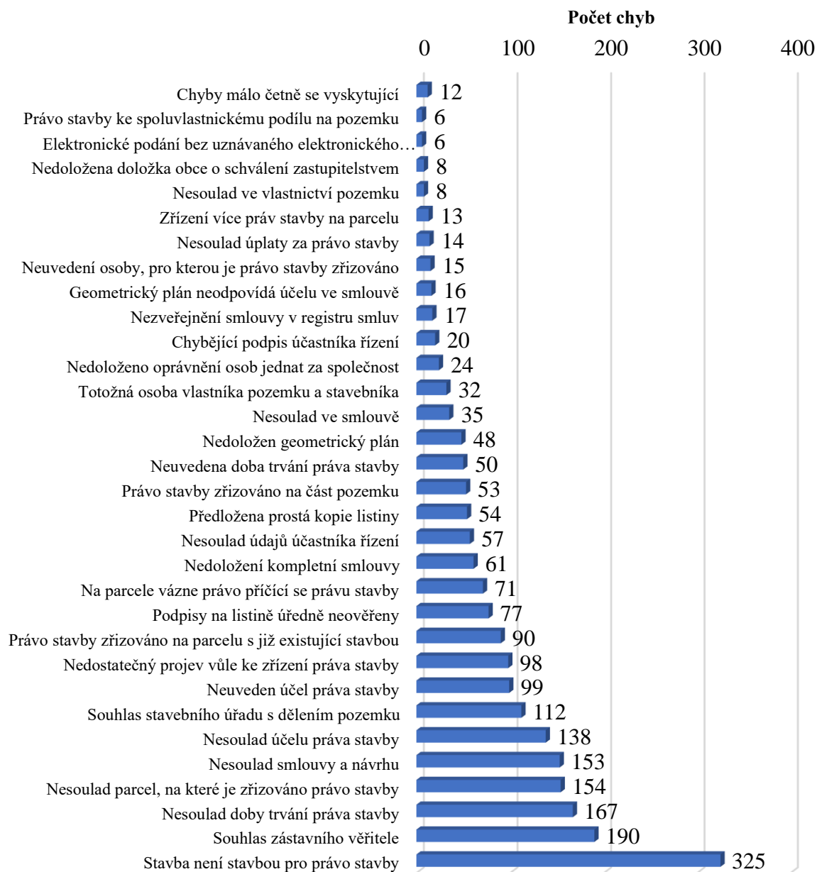
Graf 3 Počty jednotlivých chyb dle kategorie