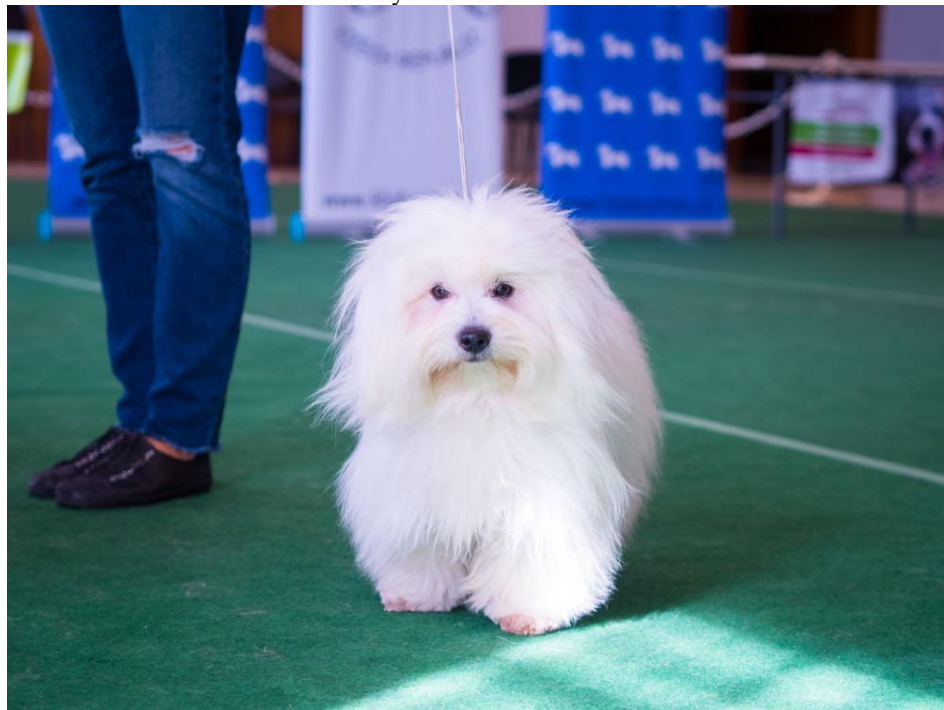
Obrázek 1 - výstava Coton de Tuléar