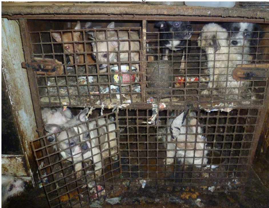
Obrázek 6 - ilustrační fotografie množíren