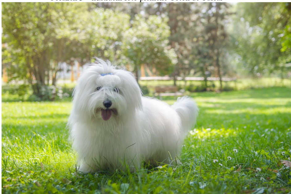
Obrázek 3 – ilustrační foto plemene Coton de Tuléar