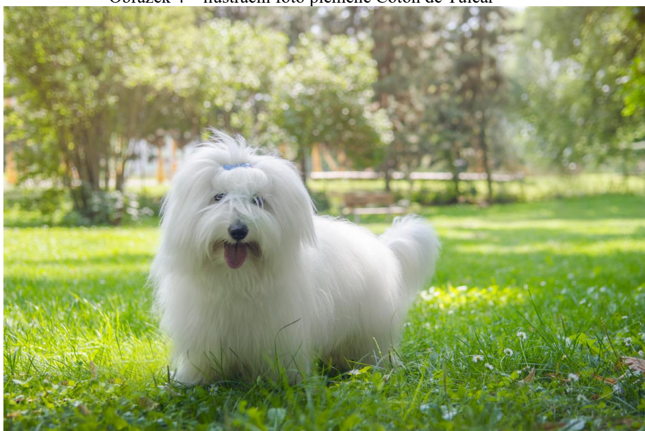
Obrázek 4 – ilustrační foto plemene Coton de Tuléar