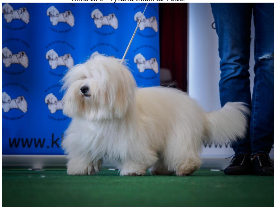
Obrázek 2 - výstava Coton de Tuléar