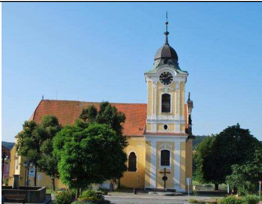
Obr. 9. B. Langmaier - kostel sv. Jakuba