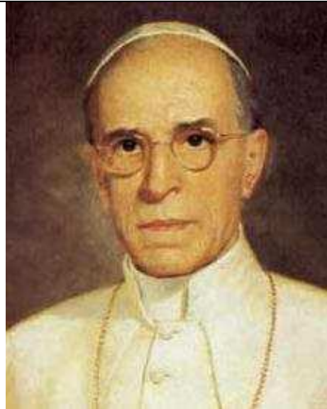
Obr. 2. Internet – Pius XII.