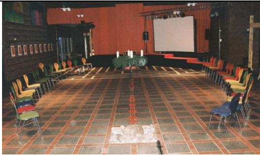
Obr. 7. Z. Demel - Do elipsy uspořádaný prostor bohoslužby slova v Jugendkirche Tabgha.