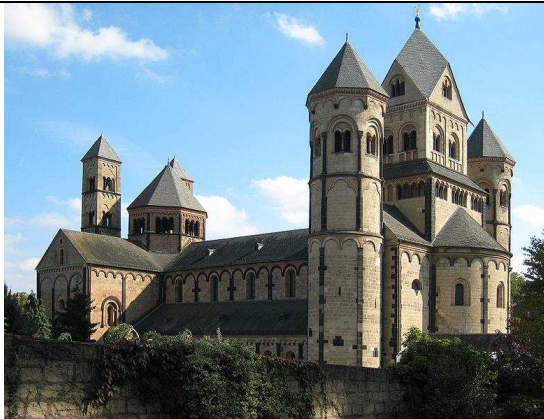
Obr. 12. Internet – klášter Maria Laach