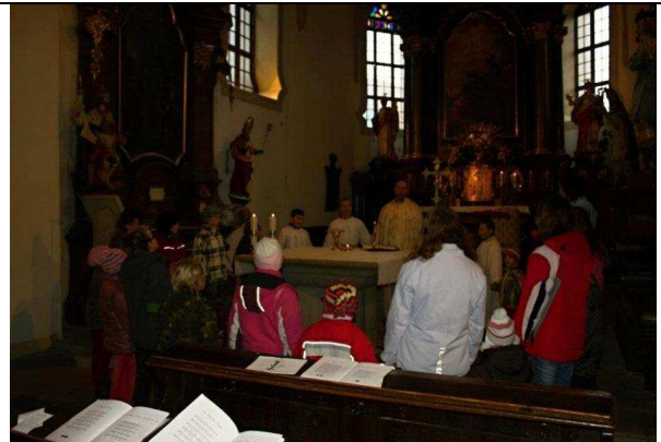
Obrázek 10. B. Toman – Mše sv. s dětmi