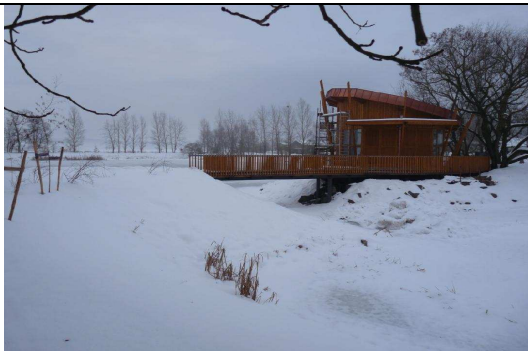
Obr. 11. J. Netík - kaple sv. Anežky v Čihovicích