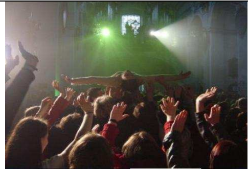
Obr.8. K. Gutwirthová - Find•fight•follow Messe