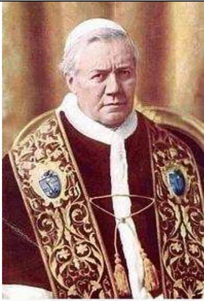
Obr. 1. Internet – Pius X.