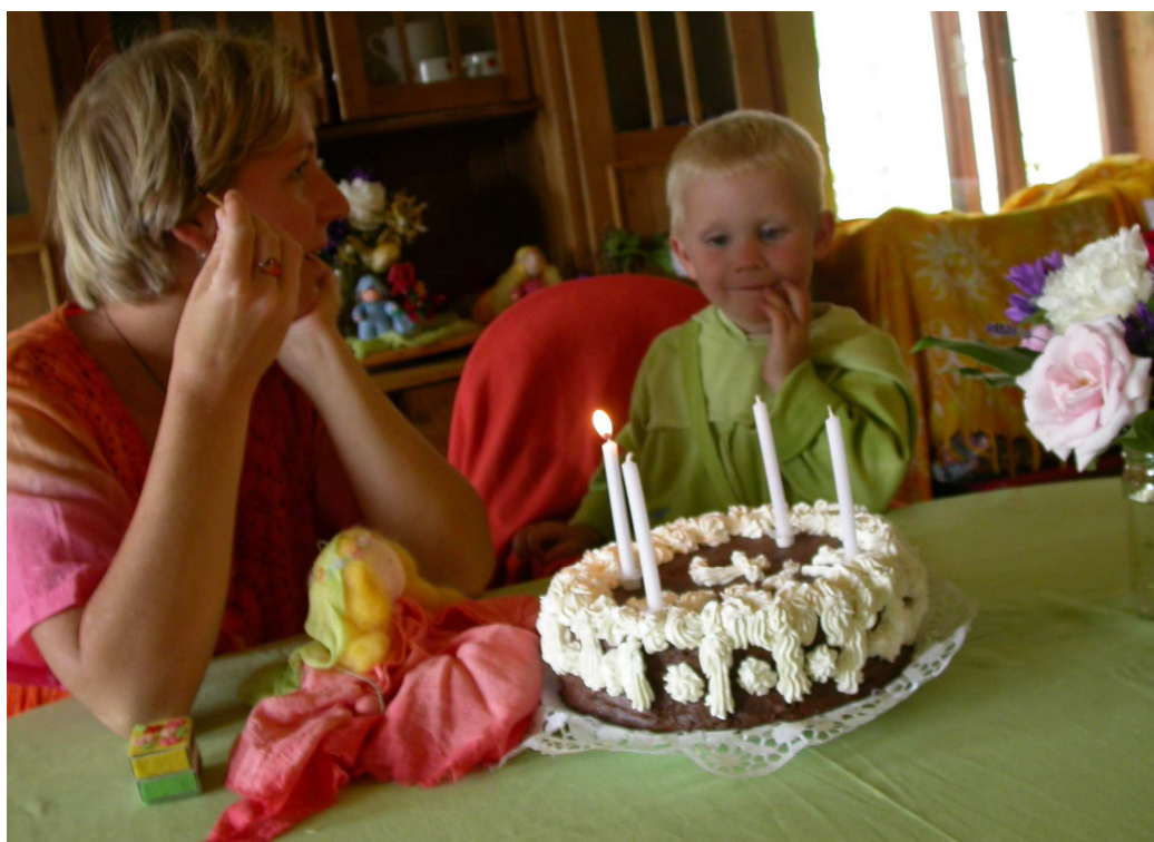
Obr.č. 7: Vyprávění příběhu o narození při zapalování svíček.