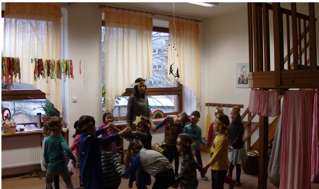
Obr. č. 3: Zlatá brána v MŠ Sluníčko, Písek