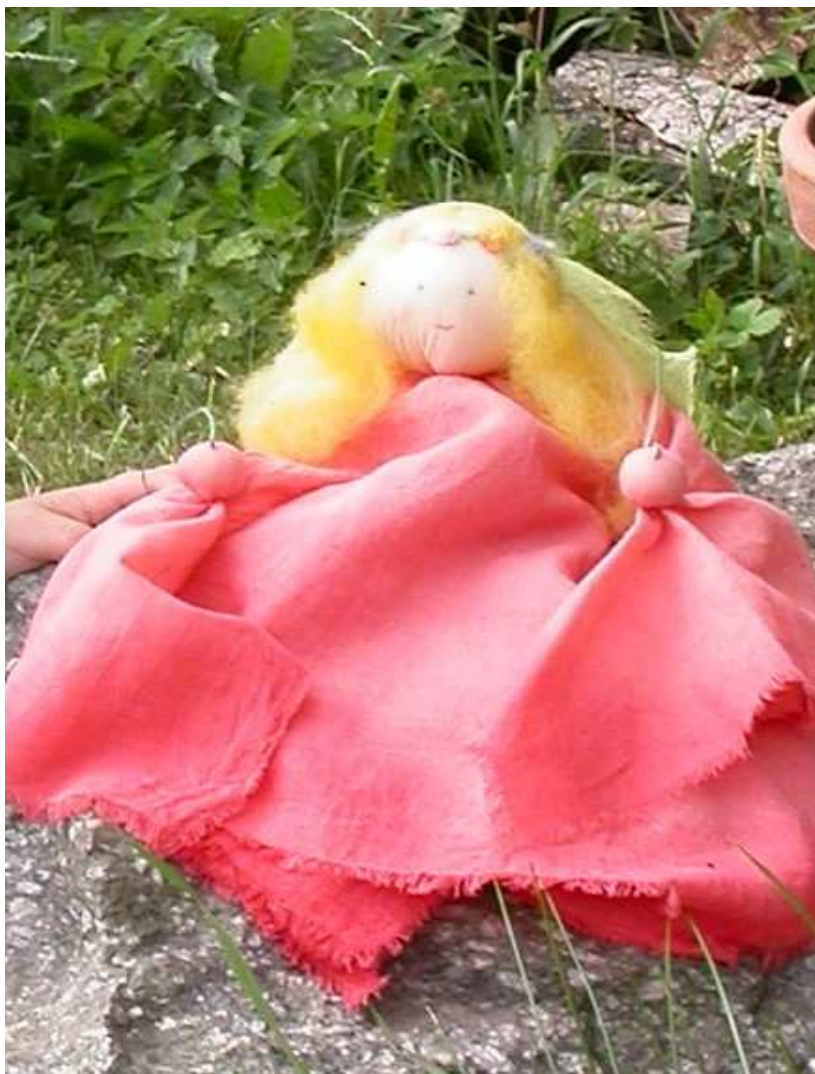
Obr.č. 10: Narozeninová víla pro dítě, které se narodilo v červnu