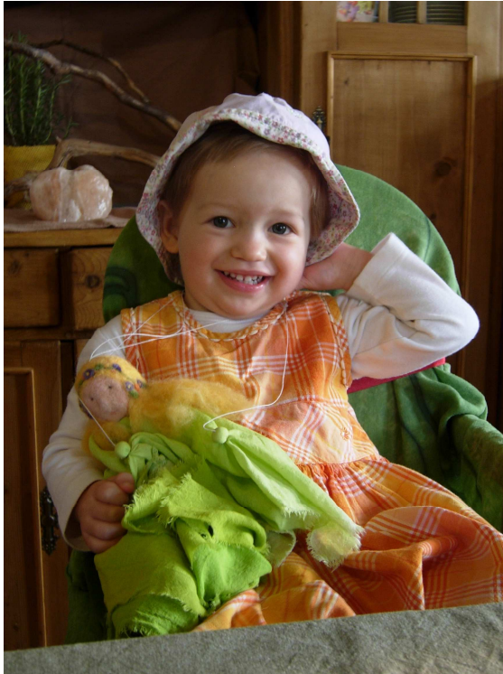
Obr. č. 8: Víla dubnová