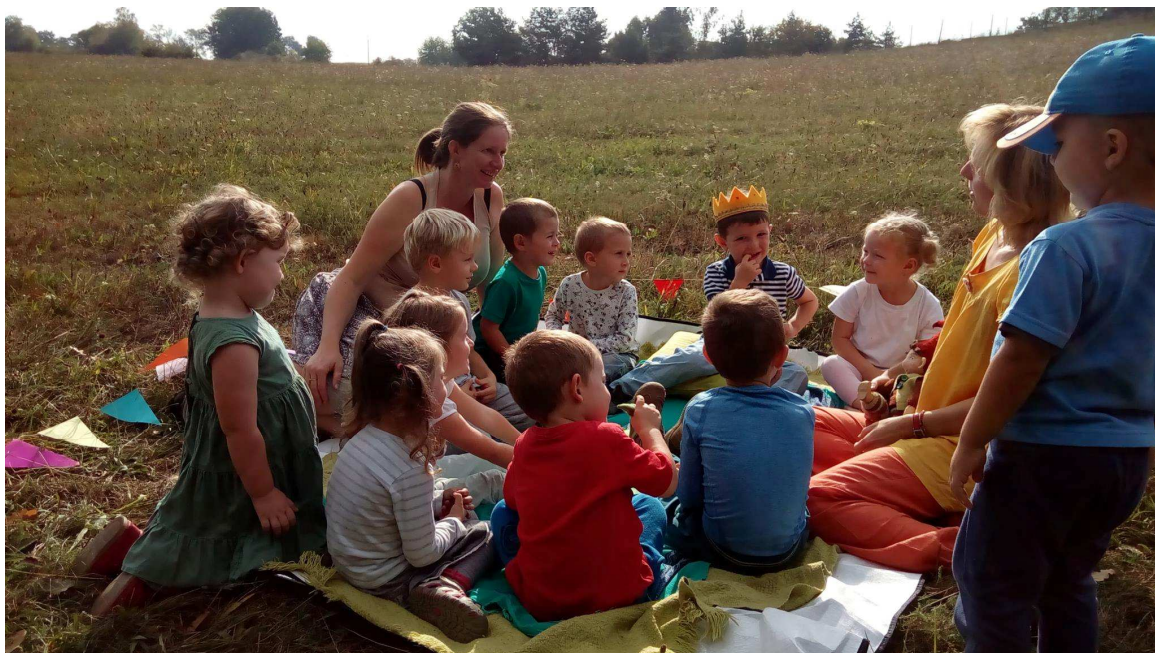
Obr. č. 6: Oslava narozenin v přírodě, Rodinná školka Trepník