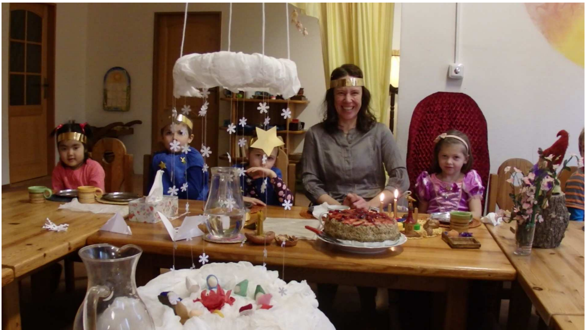
Obr. č. 5: Paní učitelka vypráví narozeninový příběh