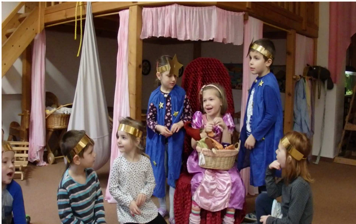
Obr. č. 4 Oslavenkyně na trůnu, právě rozbaluje dárek od třídního skřítky