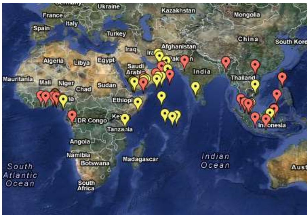
Obr. 2: Počet pirátských útoků v roce 2012