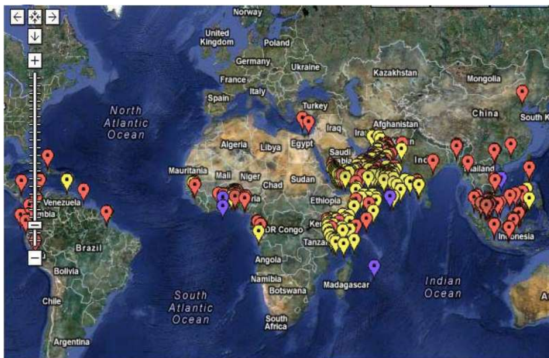
Obr. 1: Množství pirátských útoků celosvětově v roce 2011 (velmi výrazný výskyt v oblasti Adenského zálivu)