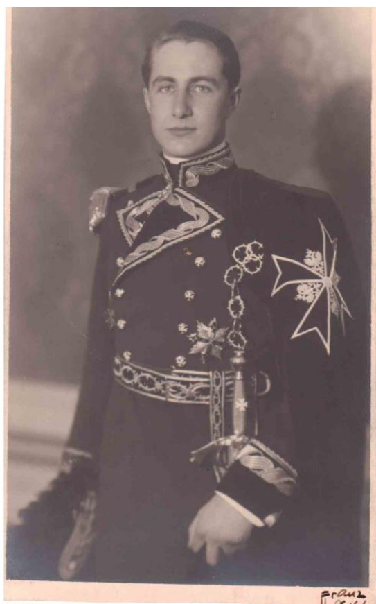
14. Princ František Schwarzenberg v řádové uniformě maltézských rytířů.