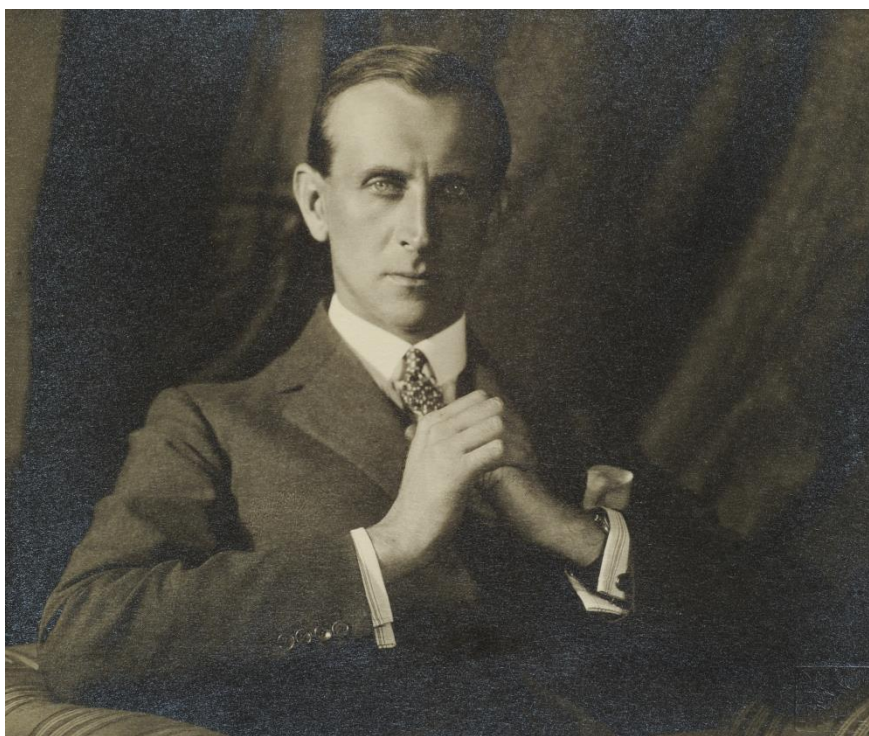
17. Diplomát Maximilian Erwin kníže Lobkovicz