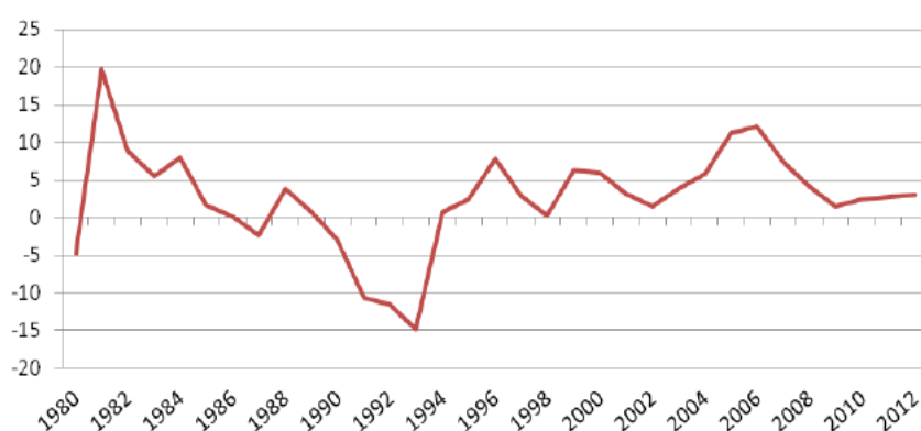
Kubánské HDP 1980 – 2012 (%)

Samotná Kuba však na začátku 90. let musela spíše než ideologické debaty řešit především praktické dopady rozpadu SSSR a RVHP, stejně jako změn politických režimů u dalších východoevropských obchodních partnerů. Již v závěru předchozí dekády v souvislosti s osekáváním sovětské podpory kubánská ekonomika klesala, po rozpadu východní velmoci se stav ještě zhoršil. V rozmezí mezi roky 1989 až 1992 poklesl import o 70 %, významně také klesalo HDP (Gott 2005: 358).