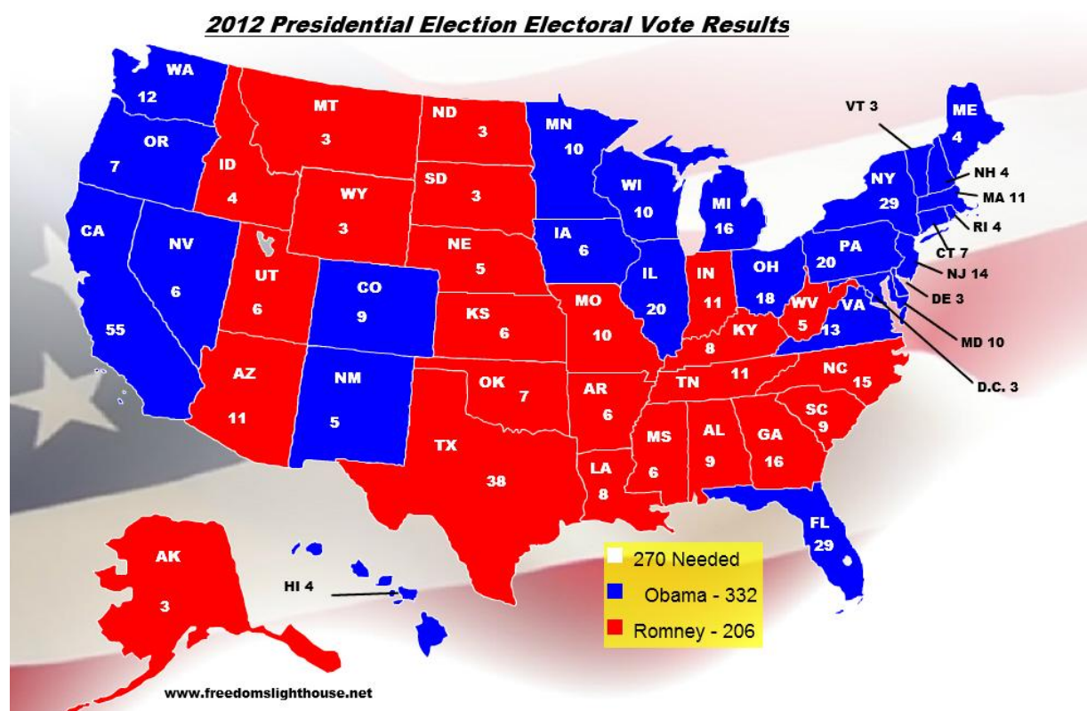
Obrázek 5: Volební výsledky prezidentských voleb v roce 2012