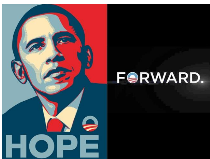
Obrázek 1 a 2: Volební plakáty Baracka Obamy v roce 2008 a 2012