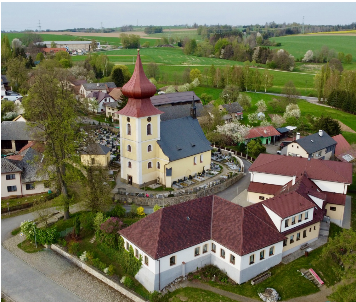
Obr. č. 1: Kostel sv. Mikuláše ve Skuhrově u Havlíčkova Brodu