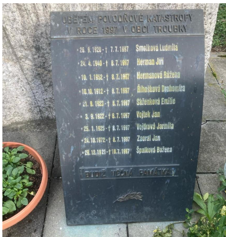
Obrázek 4: Pamětní deska obětem povodní v roce 1997

V případě povodní z roku 1997 se nelze bavit pouze o materiálních škodách, ale také o újmách na lidských životech. Povodeň si vyžádala 9 lidských životů a několik set lidí bylo zraněno. Obětem této události by postaven pomník a deska s jejich jmény. Tato deska je znázorněna na obrázku č. 4. Jak jsem již zmiňovala, Troubky jsou především zemědělskou obcí. V roce 1997 bylo postiženo mnoho zemědělců, kterým povodeň zničila pole a usmrtila dobytek a drůbež. Dále bylo zničeno okolo 338 domů, které byly stavěny z nepálených cihel. 79 Pro představu lze vidět zdevastovaný dům na obrázku č. 5. Jedná se o materiál, který se při styku s vodou rozpouští, proto se také po tomto roce vydal zákaz stavění domů z tohoto materiálu a dále je také stanoveno, že domy musí mít patro pod obytnou částí, kde toto patro může sloužit jako technická místo, nikoliv však obytná. V tomto roce se celková škoda po povodních vyčísčila na sedm set miliónů korun.