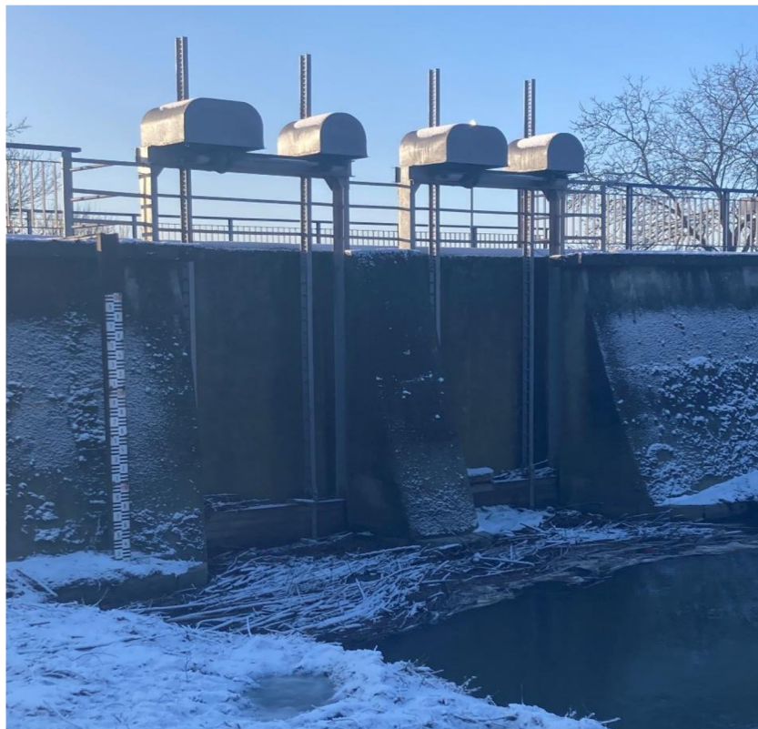
Obrázek 11: Stavidlo na Malé Bečvě