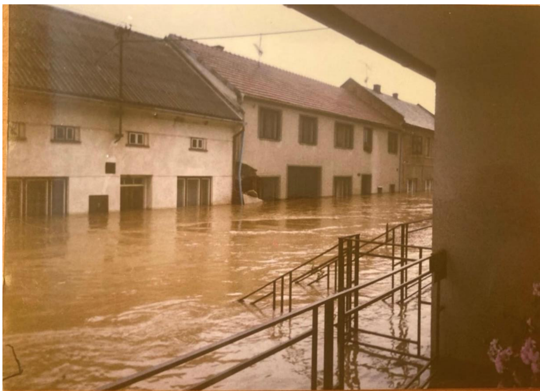
Obrázek 3: Zaplavená ulice

Pro znázornění zaplavené ulice je uveden obrázek č. 3