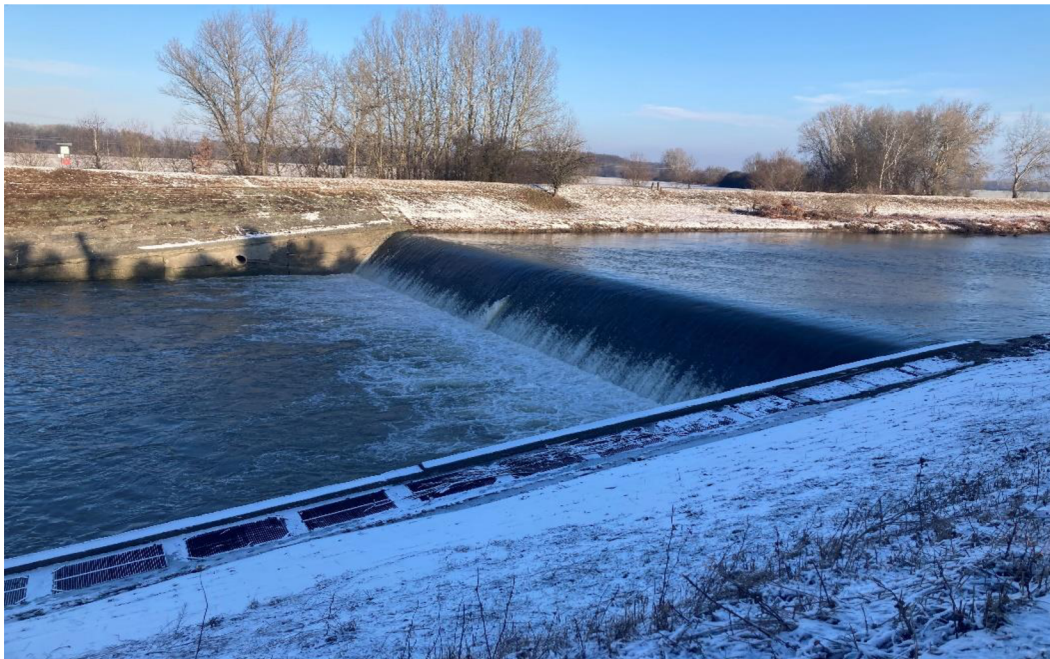
Obrázek 9: Jez na řece Bečvě