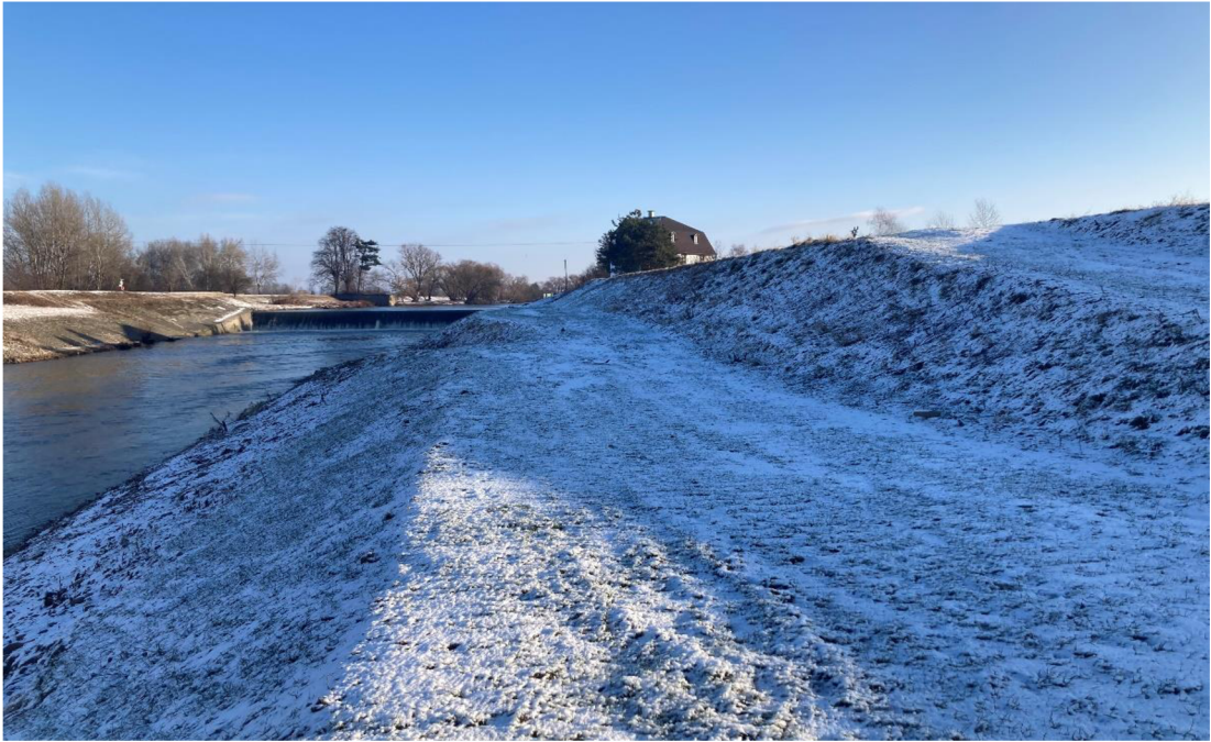
Obrázek 8: Vyvýšené místo mezi polem a řekou Bečvou od Troubeckého mostu směrem k Malé vodní elektrárně Troubky