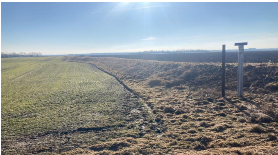
Obrázek 6: Val nazývající se Závalí