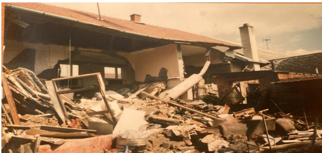
Obrázek 5: Zničený dům povodněmi