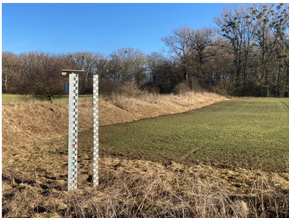
Obrázek 7: Val nazývající se Závalí s vodočetem