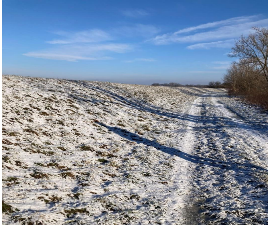
Obrázek 10: Jeden z valů podél řeky Bečvy