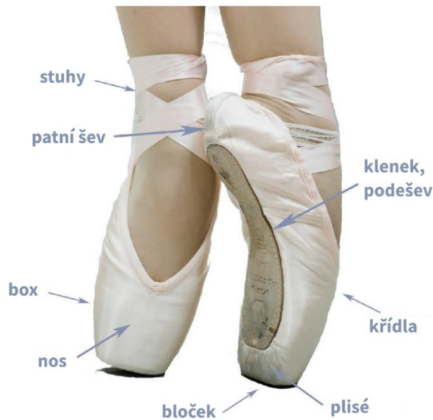
Obrázek 4 Baletní špička a její části (Sandercock, 2021)

Mnoho typů tanečních technik vyžaduje, aby tanečnice během tanečních výstupů nosily boty na vysokém podpatku. Bylo zjištěno, že převážná část problémů s chodidly u žen je spojena s nošením bot na vysokém podpatku. Stereotyp chůze je v obuvi s podpatkem významně změněn, stejně tak i biomechanika nohy. Dochází ke změnám v rozložení zátěže na nohu a zvyšuje se metabolická náročnost lokomoce, což vede k urychlení únavy svalstva dolní končetiny. Ve studii zkoumající rozložení tlaku na chodidlo a sílu nárazů při tanci s různou výškou podpatku Gu et al. (2010, pp. 297-304) uvedli, že hlavním účinkem vyvýšení paty při tanci je přesouvání tlaku z paty do oblasti předonoží, především na laterální metatarzy. Tato změna je nejen jedním z faktorů, které přispívají k vysoké míře akutních úrazů u tanečnic, ale může také vést k chronickému přetěžování předních partií nohy a je rizikovým faktorem pro plantární fasciitidu. Autoři studie tedy poukazují na důležitost tlumících vlastností obuvi v oblasti předonoží, které mohou omezit přetěžování anatomických struktur při tanci na podpatcích.