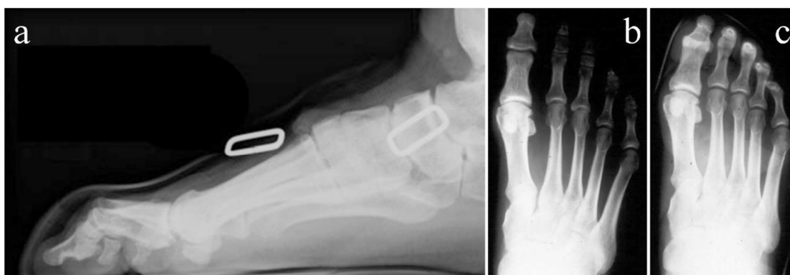
Obrázek 3 Změna biomechanického nastavení nohy viditelná na RTG snímcích; a – pohled v bočné projekci, b – pohled v dorzoplantární projekci na bosou nohu, c – pohled v dorzoplantární projekci na nohu v lezečce (Schöffl et al., 2022), upraveno

Další charakteristickou vlastností této obuvi je již zmíněný asymetrický tvar. Délka laterální strany lezečky je větší než délka mediální strany, což vede ke konstantnímu tlaku na palcovou hranu nohy. Dle Schöffl et al. (2022, p. 153) 80-96% dotázaných lezců uvedlo, že při nošení lezecké obuvi pociťují bolest. Nejčastějším důvodem byla bolestivost prstců, především palce u nohy. Pomocí radiografické analýzy bylo zjištěno, že lezečka staví palec do valgózního postavení v úhlu o asi 7° větším než u zdravého jedince (viz Obrázek 3c, p. 17). Tato změna postavení palce je u jedinců věnujících se dlouhodobě tomuto sportu pozorována i bez lezecké obuvi. Jednostranný hallux valgus je popisován u 53% lezců, oboustranný u 20% probandů, což je výrazný nárůst oproti běžné populaci, u které je udávána prevalence 4,5%. Výskyt hallux valgus je častější u zkušenějších lezců (Lejonagoitia-Garmendia et al., 2023, p. 108; Schöffl et al., 2022, pp. 152-155).