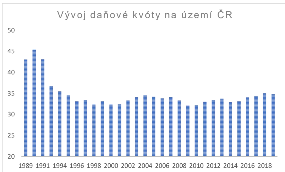
Obrázek 1: Vývoj celkové daňové kvóty v ČR