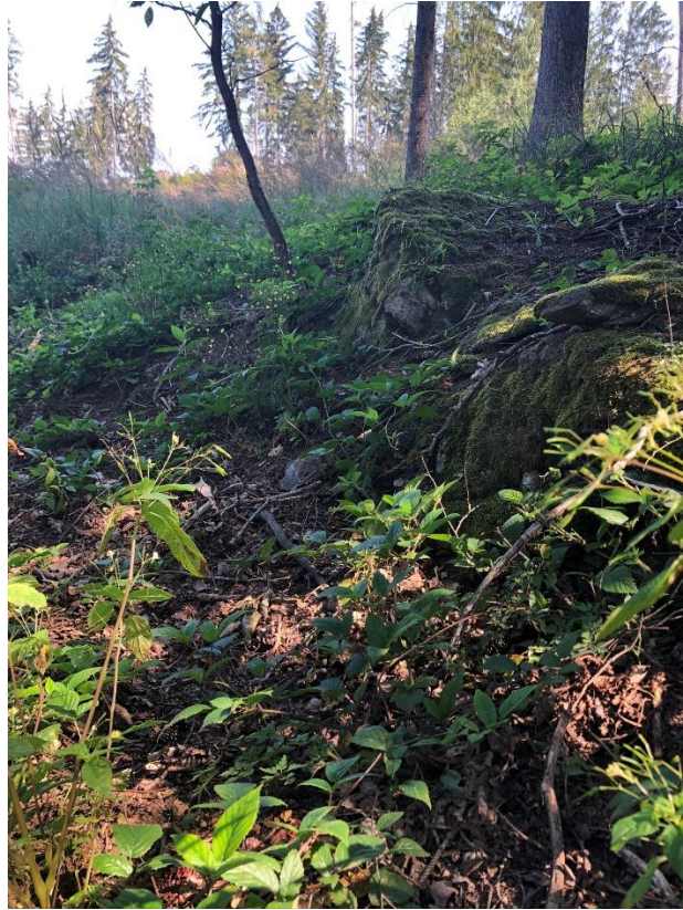
Foto 4.1 Celkový náhled na zaniklou lokalitu, pohled k severu.