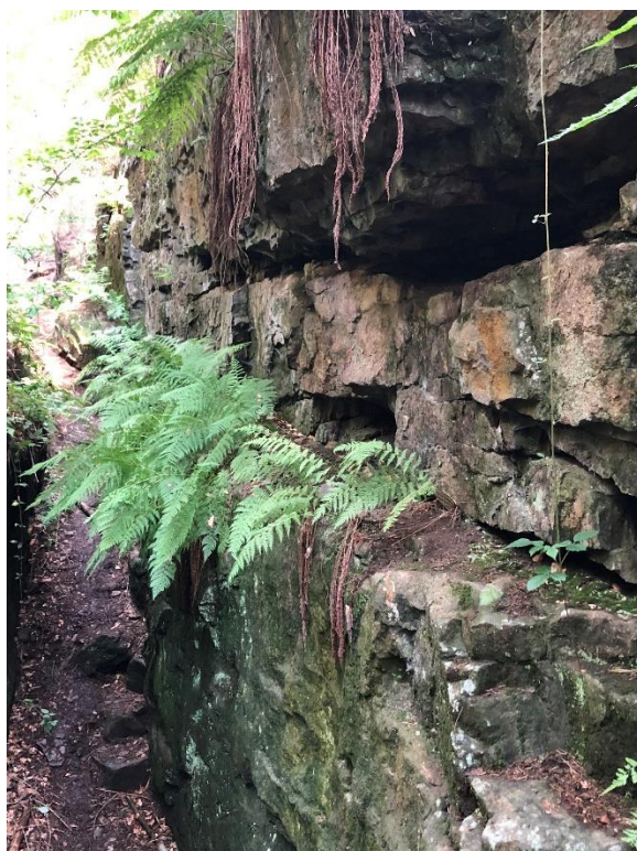
Foto 2.3 Detailní pohled hlavní dobývky.