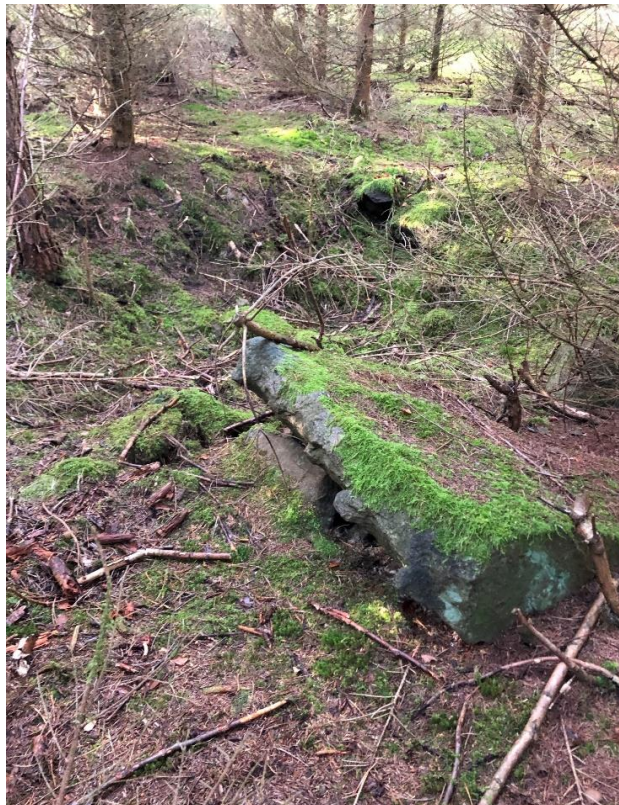
Foto 13.2 Detailní pohled na pozůstatky těžby granitu.