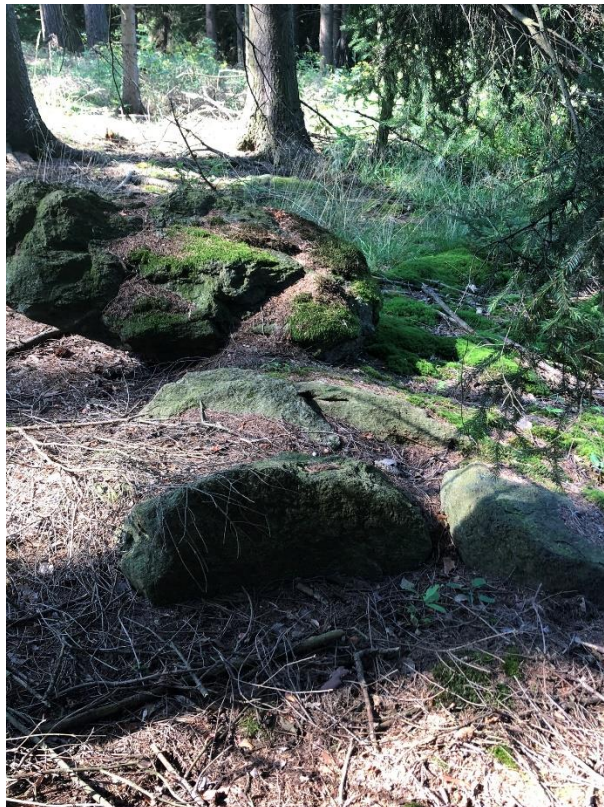
Foto 8.2 Detailní pohled na pozůstatek po těžbě migmatitu.