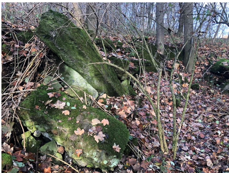
Foto 9.2 Detailní pohled na pozůstatky po těžbě žuly.