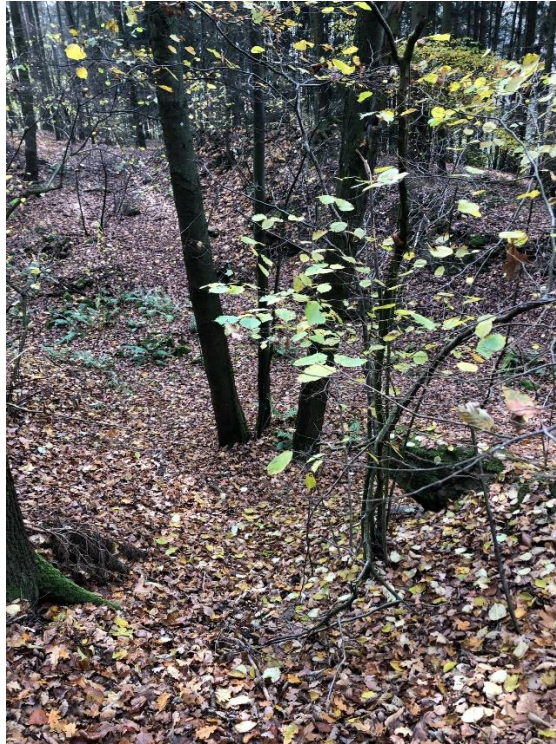
Foto 18.1 Celkový pohled na lokalitu, pohled k jihu.