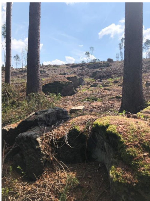
Foto 6.3 Zasazení lokality v krajině, pohled k severozápadu.