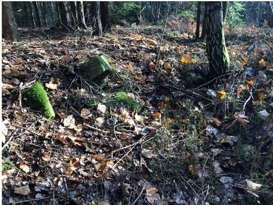
Foto 10.2 Detailní pohled na pozůstatky lokalit.