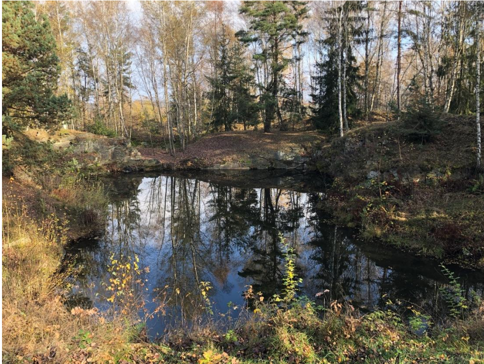
Foto 16.1 Celkový pohled na zasazení lokalit do krajiny, pohled k severu.