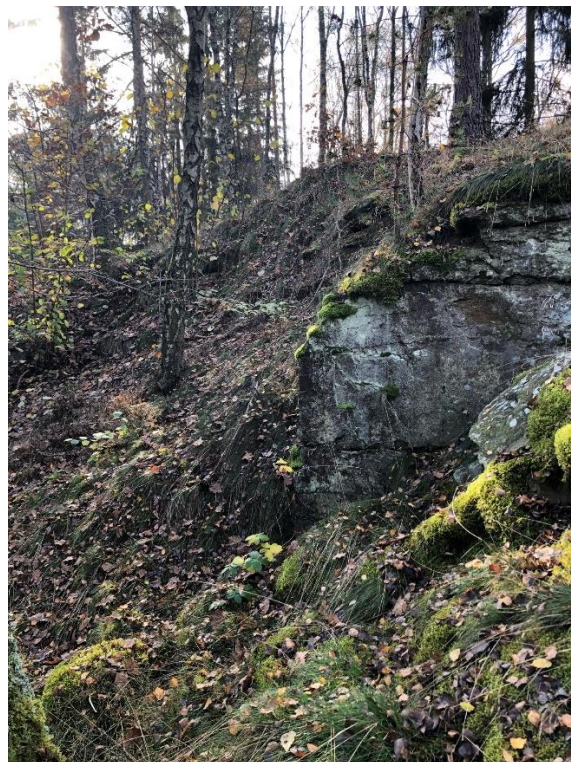
Foto 16.2 Pohled na skalní výchoz