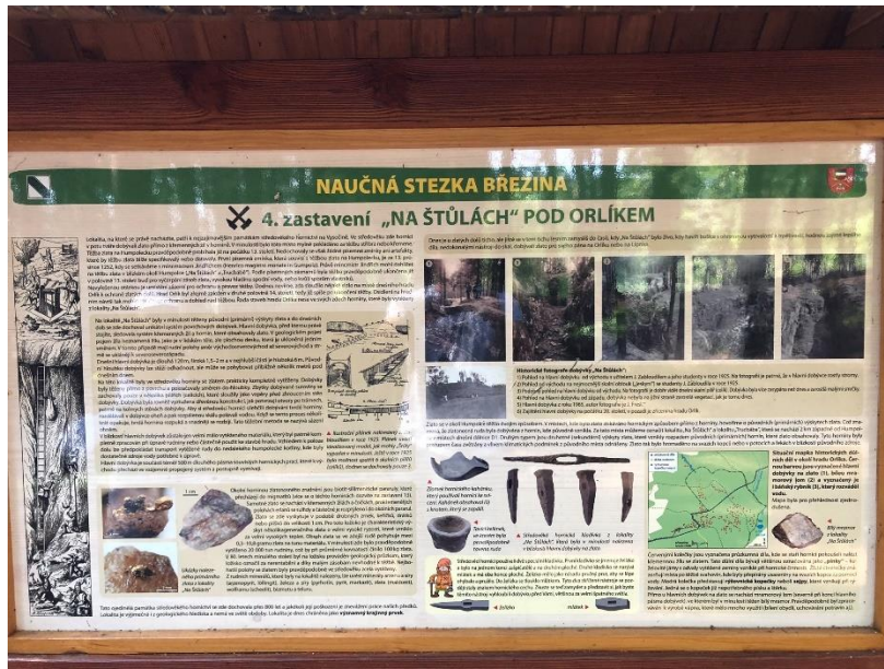
Foto 2.1 linformační tabule k naučné stezce Březina.