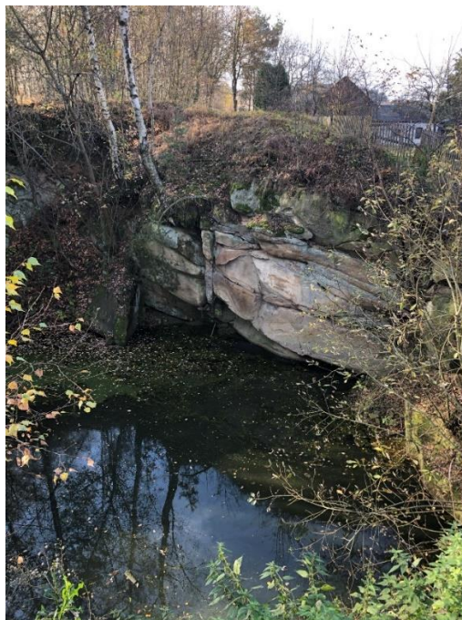
Foto 15.2 Pohled na část skalního výchozu zatopené lokality.