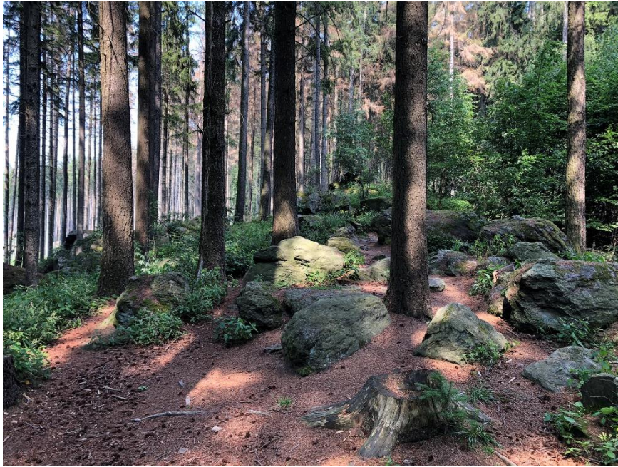
Foto 1.1 Pohled na lokalitu, pohled k jihozápadu.