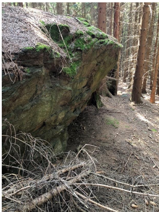
Foto 7.1 Pohled na skalní výhoz, pohled k západu.