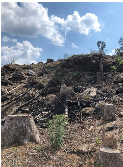
Foto 6.2 Pohled na skalní výchoz, pohled k západu.