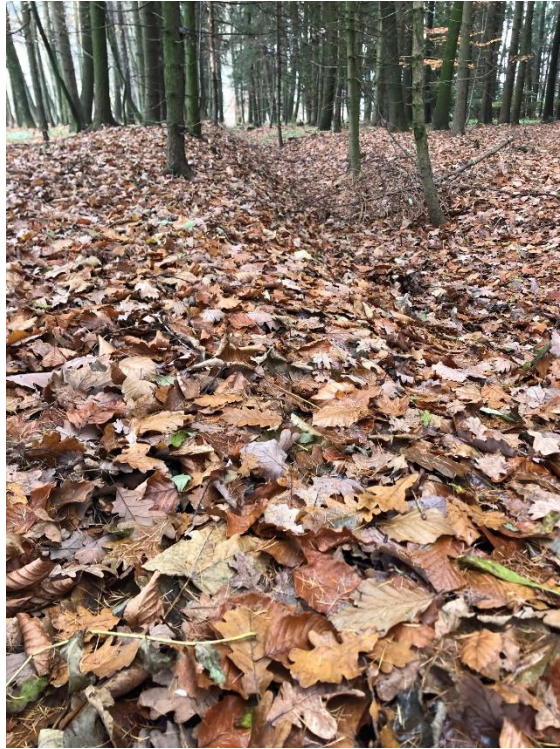
Foto 19.1 Celkový pohled na lokalitu, pohled k východu.