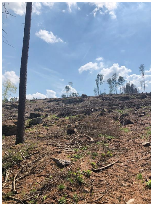
Foto 6.1 Pohled na odlesněný kuželovitý vrchol kopce Orlík, pohled k západu.