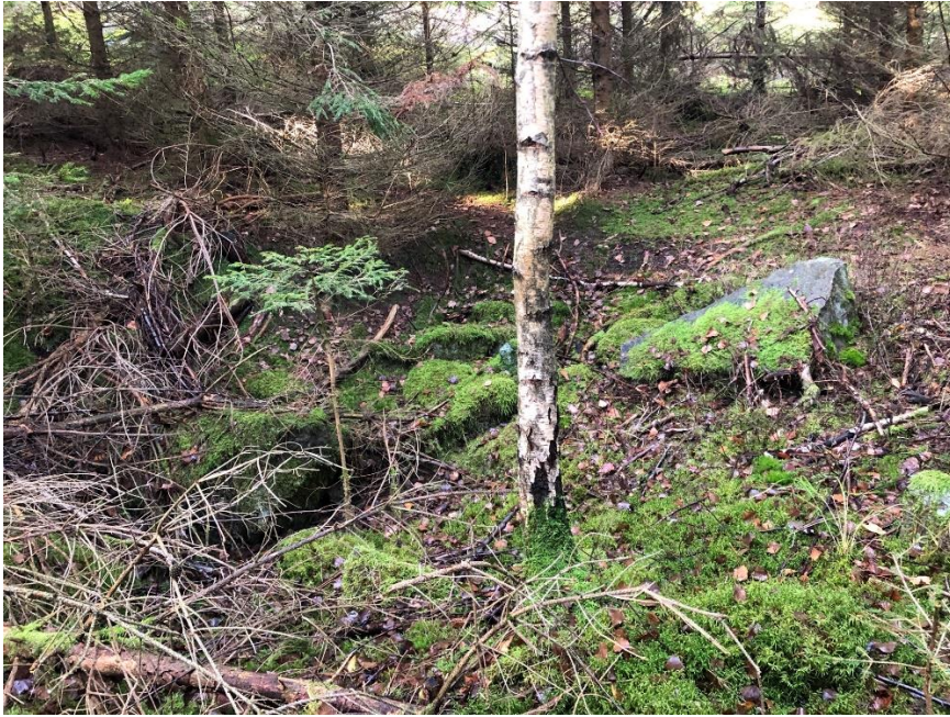
Foto 13.1 Celkový pohled na lokalitu, pohled k jihovýchodu.