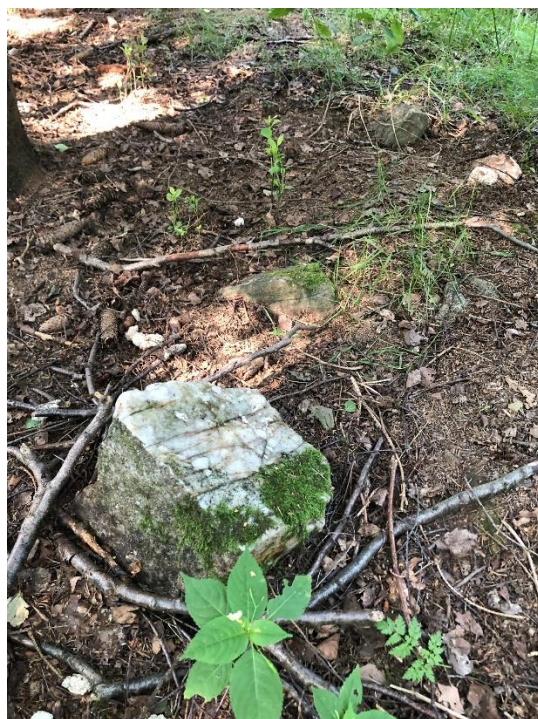
Foto 5.2 Detailní pohled na pozůstatky těžby pegmatitu.