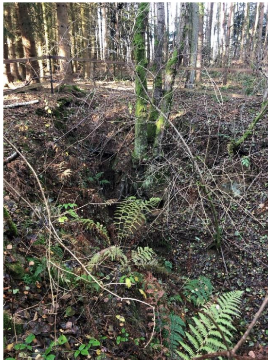
Foto 12.1 Pohled na pozůstatky hlavní dobývky, pohled k severozápadu.