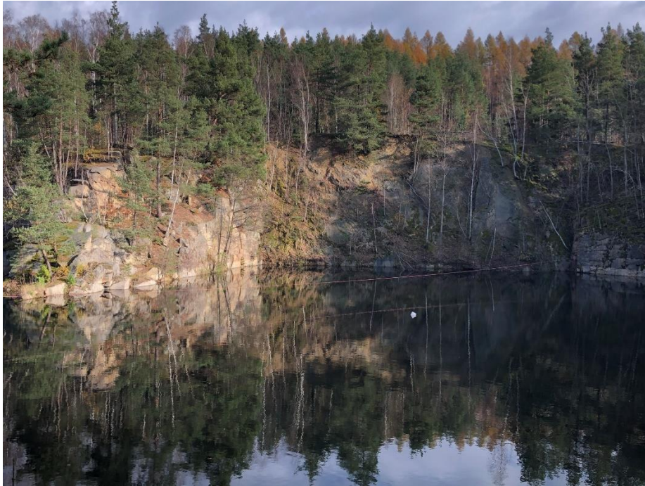
Foto 14.1 Pohled na zatopenou lokalitu, pohled k východu.