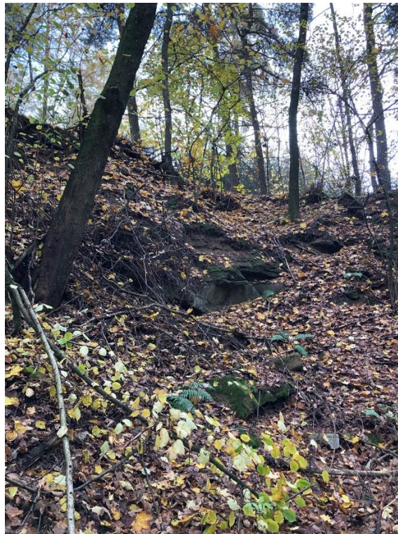
Foto 18.2. Pohled na skalní výchoz.