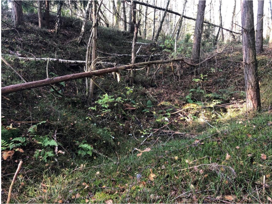
Foto 10.1 Pohled z lesní přístupové cesty na lokality, pohled k severovýchodu.