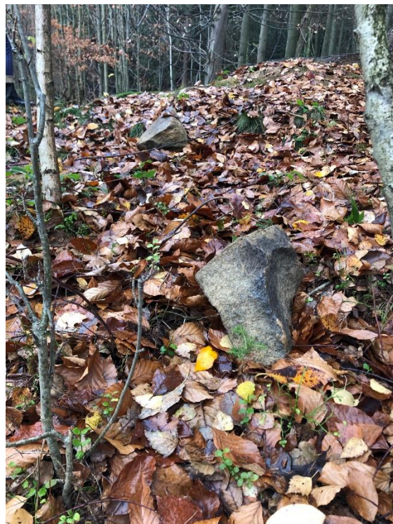
Foto 19.2 Detailní pohled na zbytky těžby pararuly.