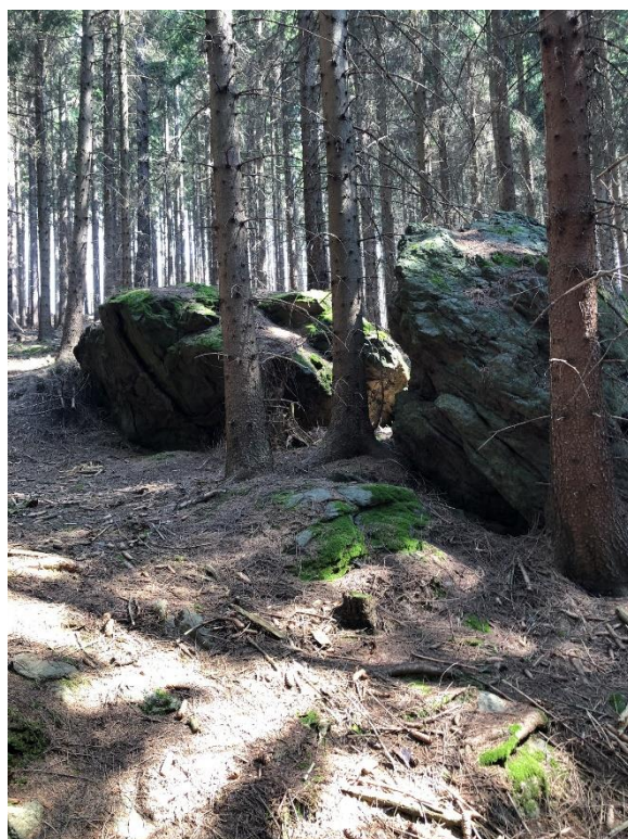
Foto 7.2 Pohled z lesní přístupové cesty, pohled k východu.