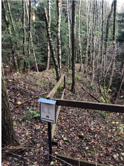
Foto 12.1 Pohled na zabezpečení lokality s dezinformační informační tabulí.