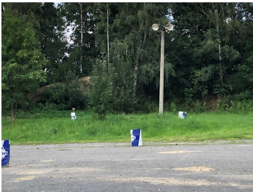
Foto 3.2 Pohled na skalní výchoz v areálu Auto-moto klubu- Zálesí, pohled k východu.