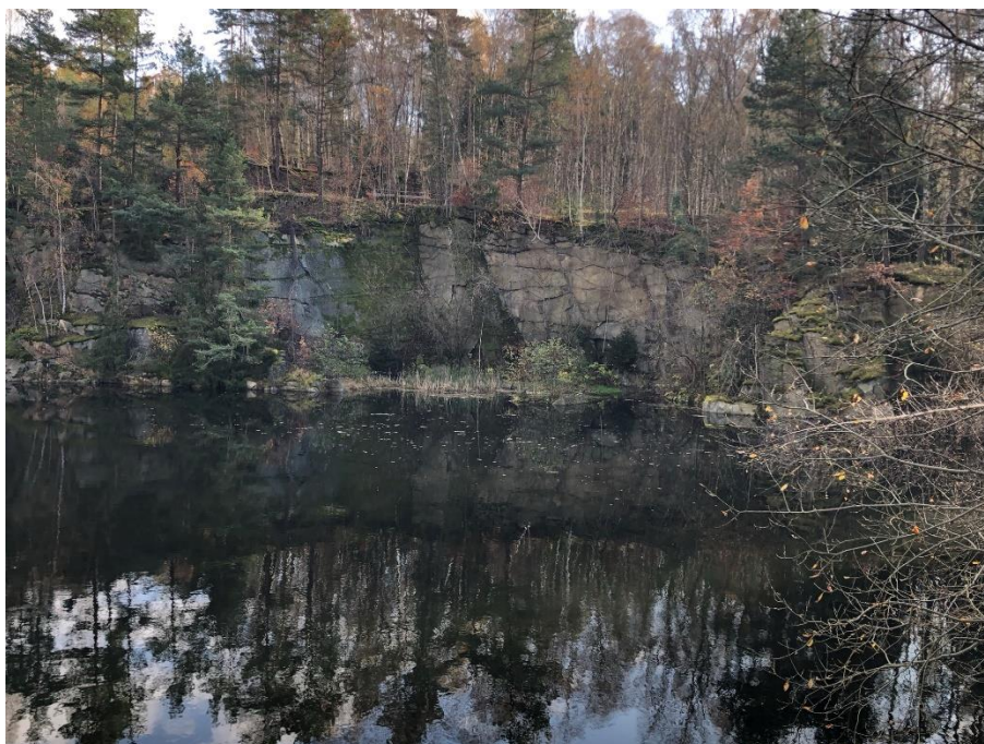
Foto 14.3 Pohled na zatopenou lokalitu, pohled k jihovýchodu.