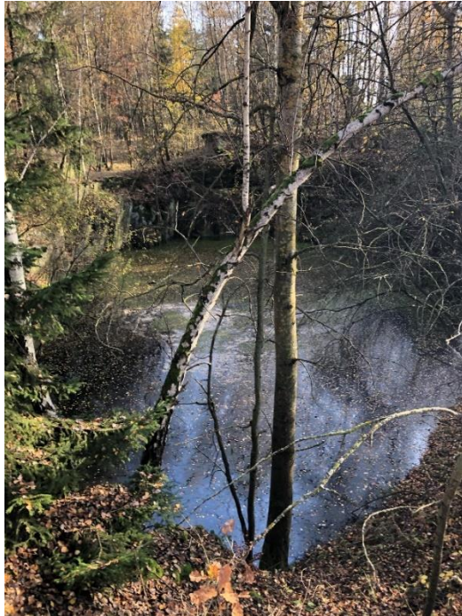
Foto 15.1 Celkový pohled na zatopenou lokalitu, pohled k jihu.