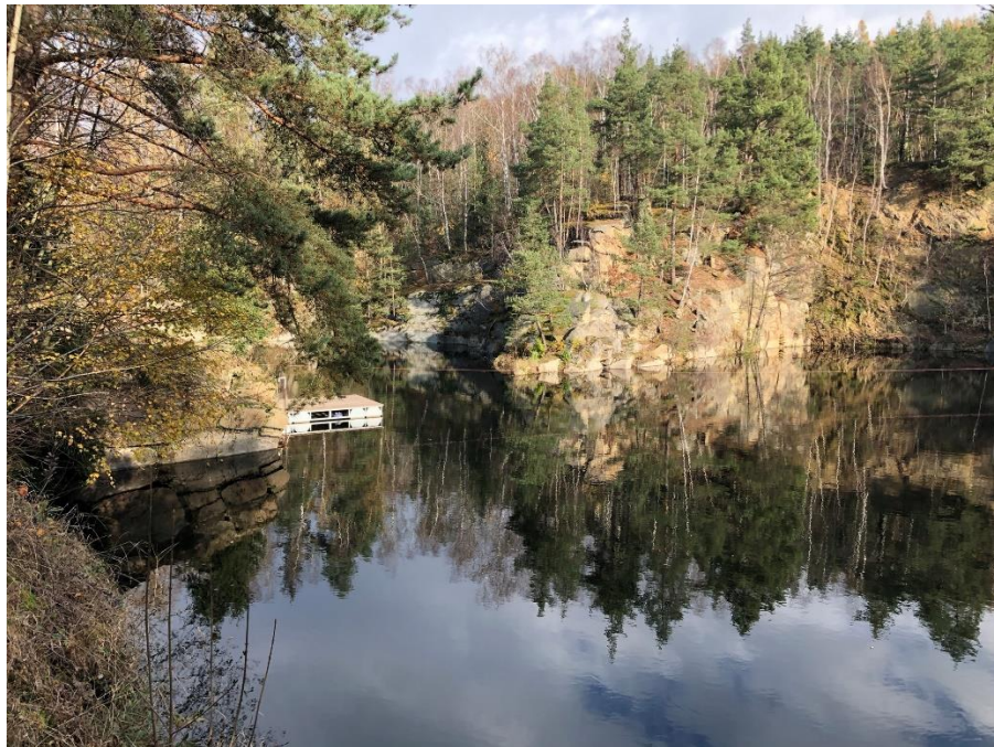
Foto 14.2 Pohled na zatopenou lokalitu, pohled k severovýchodu.