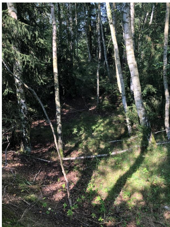
Foto 5.1 Celkový pohled na lokalitu, pohled k severozápadu.