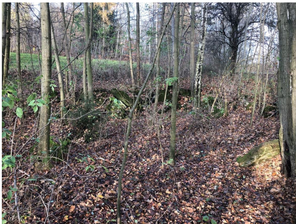
Foto 9.1 Celkový pohled na lokalitu, pohled k jihozápadu.