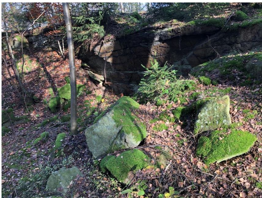
Foto 16.1 Detailní pohled na pozůstatky těžby migmatitu