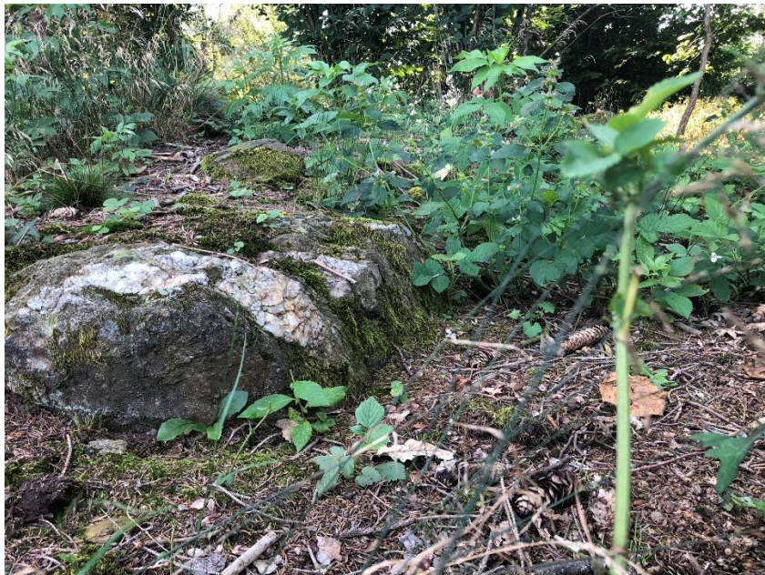
Foto 4.2 Detailní pohled na zaniklou lokalitu.