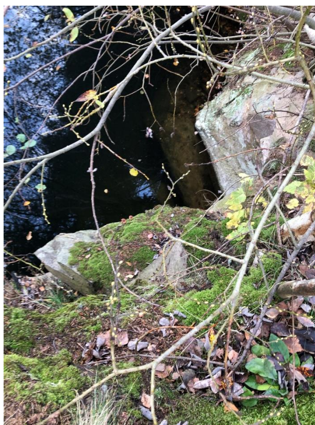
Foto 14.4 Detailní pohled na pozůstatky těžby granitu.