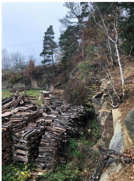
Foto 20.2 Pohled na skalní výchoz, pohled k západu.