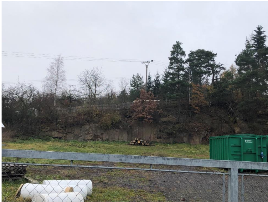
Foto 20.1 Pohled na oplocenou lokalitu z přístupové cesty, pohled k severu.