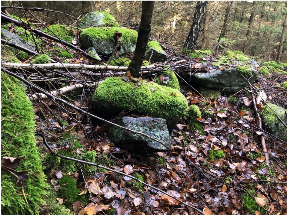
Foto 13.3 Detailní pohled na pozůstatky těžby granitu.