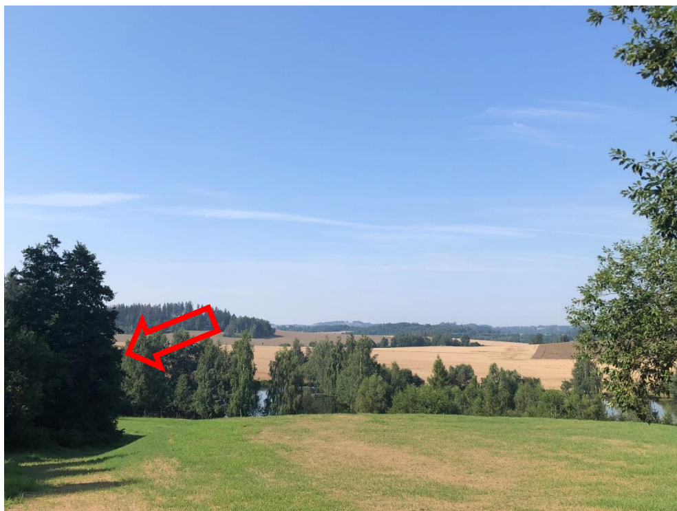
Foto 8.1 Zasazení lokality v krajině, pohled k jihozápadu.