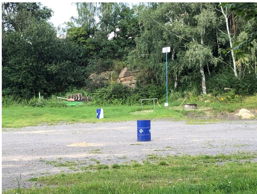
Foto 3.1 Pohled na skalní výchoz v areálu Auto-moto klubu- Zálesí, pohled k východu.