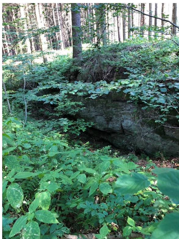
Foto 2.4 Pohled na skalní výchoz.