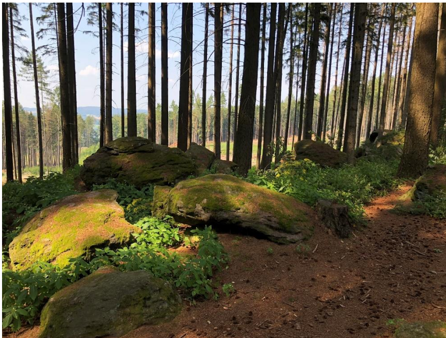
Foto 1.2 Pohled od zříceniny hrad Orlík.