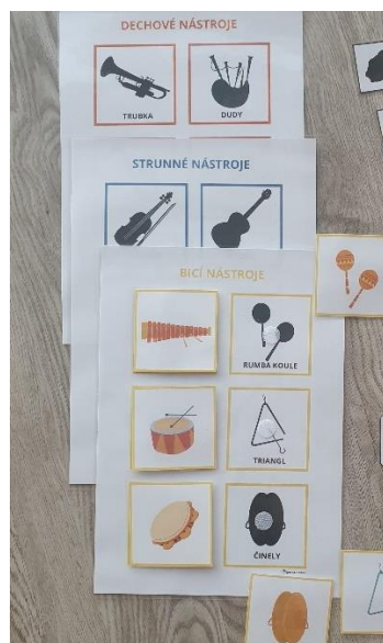
Obr. 2: Rozdělení hudebních nástrojů pro předškolní věk