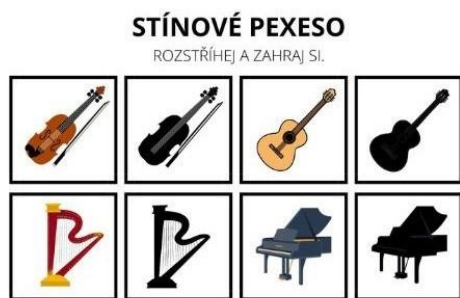
Obr. 15: Stínové pexeso – hudební nástroje