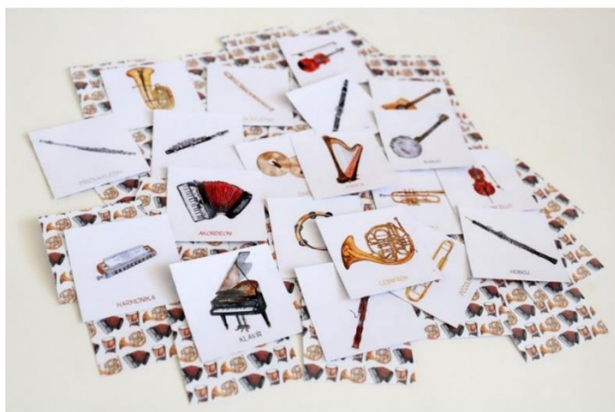
Obr. 14: Obrázkové pexeso – hudební nástroje

Dostupné z: https://www.ucitelnice.cz/produkt/14456