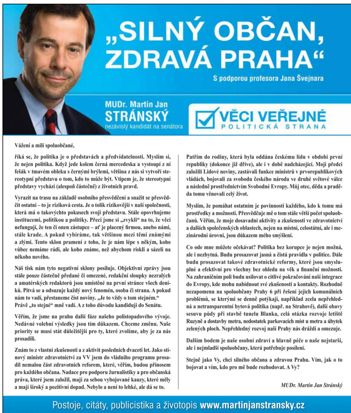
Obr. č. 5: Reklamní poutač Věcí veřejných v komunální kampani 2010 v Praze 6