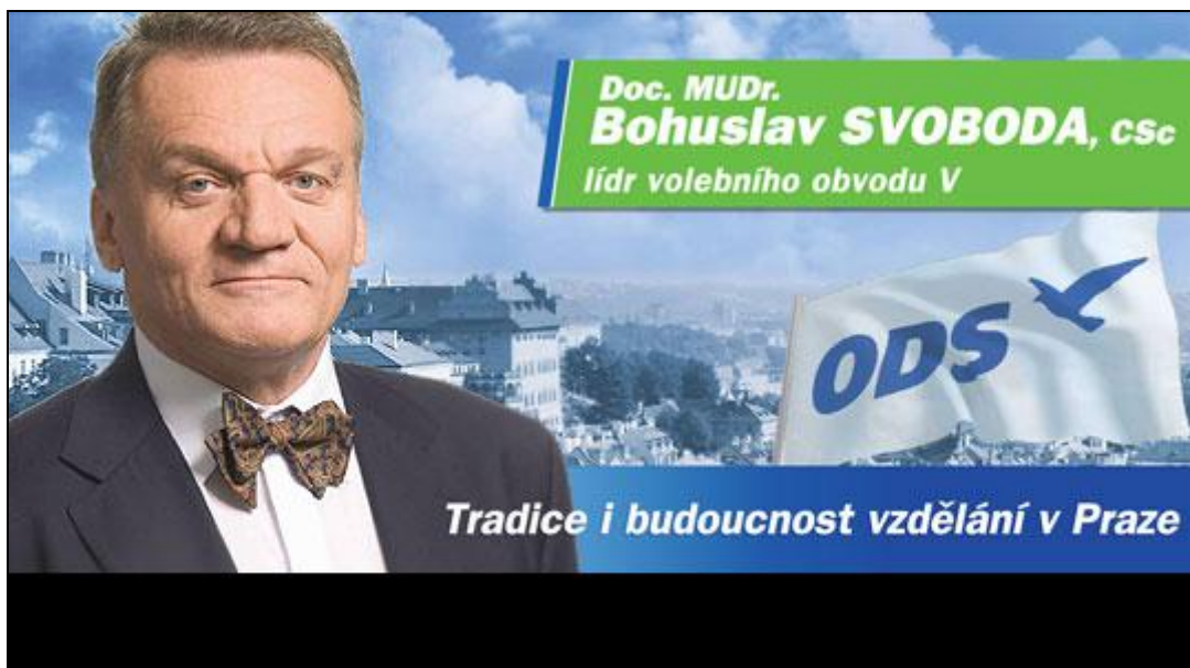
Obrázek č. 10 : srovnání billboardu ODS Praha 6 a ODS Praha