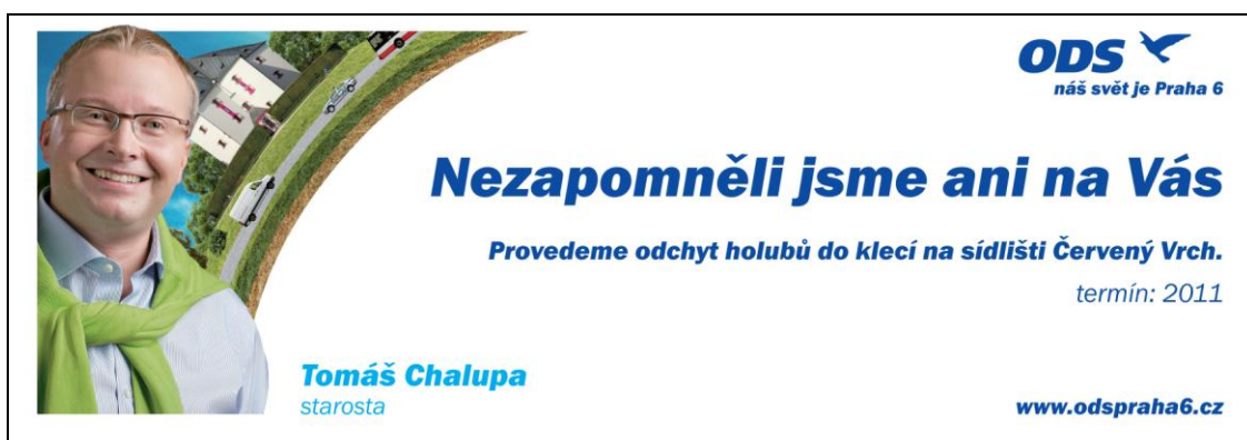
Obrázek č. 12: Příklady lokálního uplatnění volebního programu na letáčích

Druhý, lokální volební program ODS Praha 6 byl rozmělněn na dílčí volební programy doslova okresek po okrsku. Tyto lokální volební programy dostali všichni obyvatelé do svých schránek.