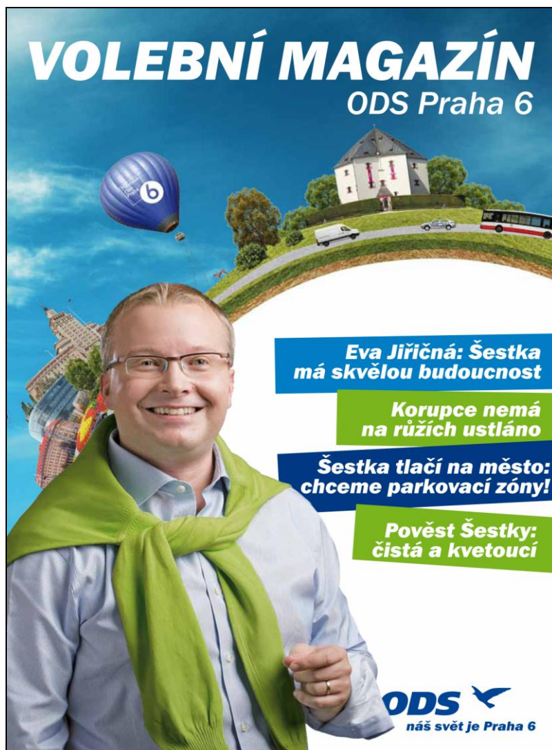
Obrázek č. 9: Titulní strana předvolebního magazínu ODS Praha 6