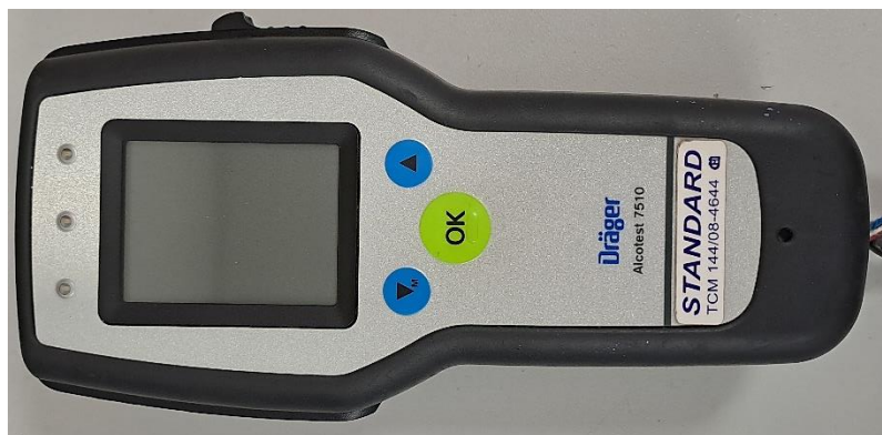
Obrázek 1 - Dräger Alcotest 7510

Oba systémy v přístroji Alcotest Dräger 7110 nezávisle na sobě měří koncentraci alkoholu ve vzduchu vydechnutém z hlubokých částí plic. Každý systém tak slouží jako kontrola druhého. Přístroj je navržen tak, aby detekoval jakýkoliv pokus o manipulaci s měřením nebo přítomnost ústního alkoholu (alkoholu, který zůstává v ústech, např. po nedávném pití) a v takovém případě automaticky ukončil měření a informoval obsluhu. Vzhledem k použití dvou měřících systémů s různou analytickou specifičností je přístroj schopen spolehlivě detekovat přítomnost rušivých látek ve vydechnutém vzduchu, které by mohly ovlivnit výsledek, jako jsou výpary benzínu, barev, acetonu nebo rozpouštědel. Obsluha alkotesterů je jednoduchá a intuitivní, rozsah použití je u modelu 7510 omezen od -10 do 50 °C, měření provádí od 0 do 3 ‰ alkoholu. 47