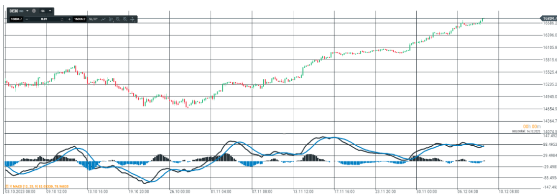
Obrázek 3 MACD

Moving average Convergence Divergence (MACD), je oscilátor, který je považován za nejspolehlivější ukazatel technické analýzy. Je tvořen odečtením hodnoty exponenciálního průměru s delší periodou (obvykle 25 nebo 26 dnů) a hodnoty obdobného průměru, ale krátkodobého (zpravidla 12denního). Za vstupní signál se zde považuje průnik dvou křivek, který MACD zobrazuje, čím dále je tento průsečík od nulové hodnoty, tím se považuje za silnější. (Rejnuš, 2014)