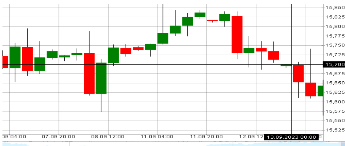
Obrázek 9 Výstupní informace

Po zaznamenání vstupních informací je možné vypočítat potenciální zisk, který se určuje na základě aktuální ceny indexu k datu 13. září 2023, kdy hodnota indexu DAX dosáhla hodnoty 15 700 bodů. Po vynásobení této ceny objemem 10,69 lotů dosáhneme hodnoty 167 833 EUR. Čistý zisk je následně vypočítán jako rozdíl mezi počáteční investicí a konečnou hodnotou pozice, což v tomto případě představuje zisk 37 833 EUR, což po přepočtu na americké dolary činí přibližně 41 485 dolarů.