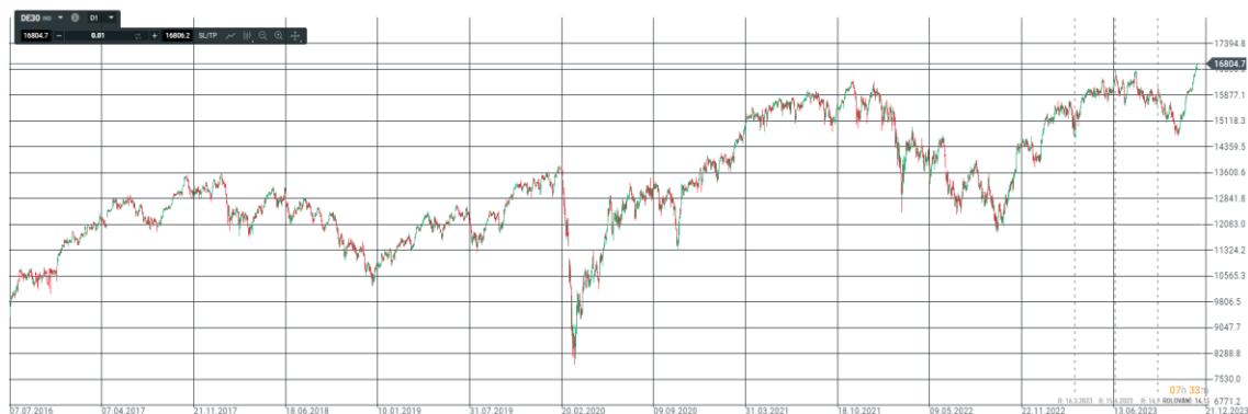
Obrázek 4 Bollinger bands

Bollinger Bands (BB) neboli Bollingerova pásma je pásmový indikátor, jehož rozptýlení pásma indikuje volatilitu trhu. (Rejnuš, 2014) Tento indikátor využívá standardní odchylku k vytvoření pásma kolem klouzavého průměru. Obchodním signálem je zúžení pásma a následně vystoupení cenové hladiny z Bollingerových pasem. (Rejnuš, 2014)