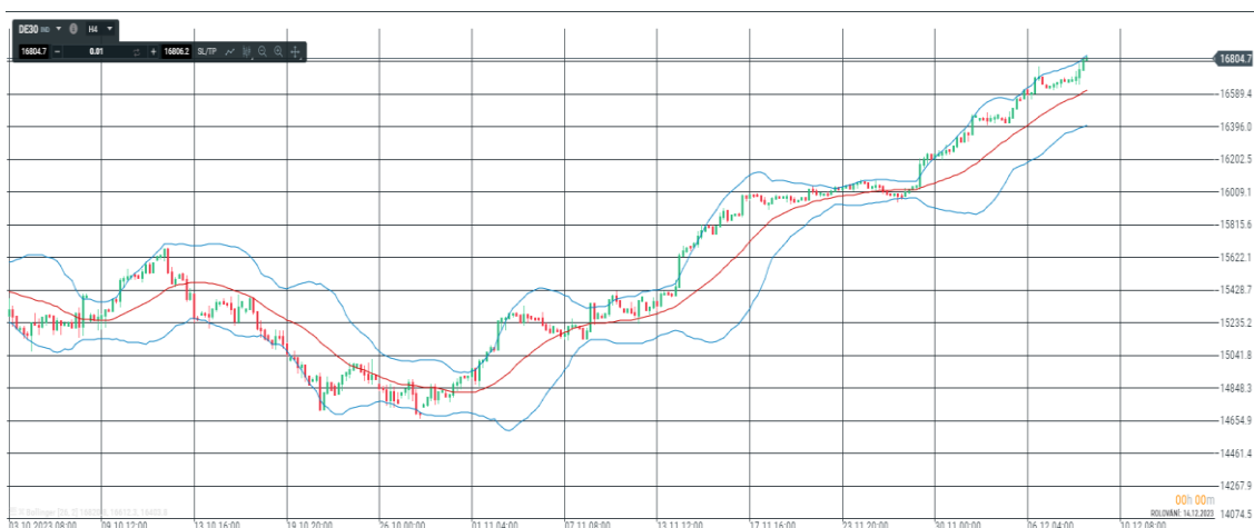
Obrázek 5GDAXI TRH