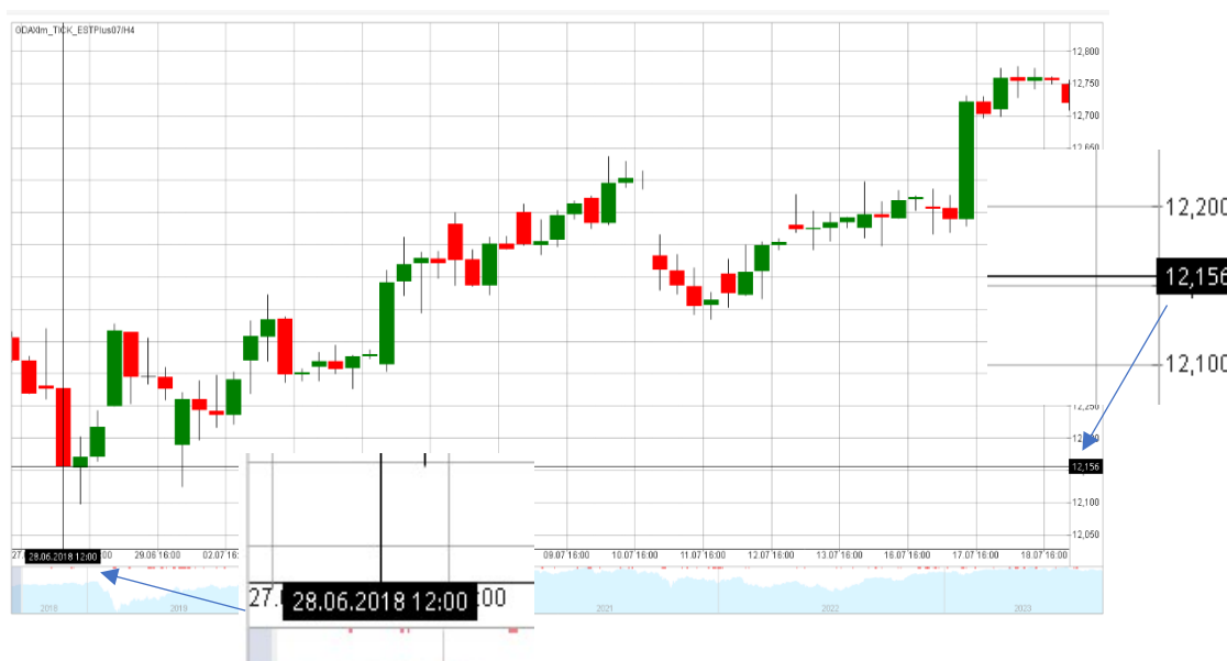
Obrázek 8 Vstupní informace