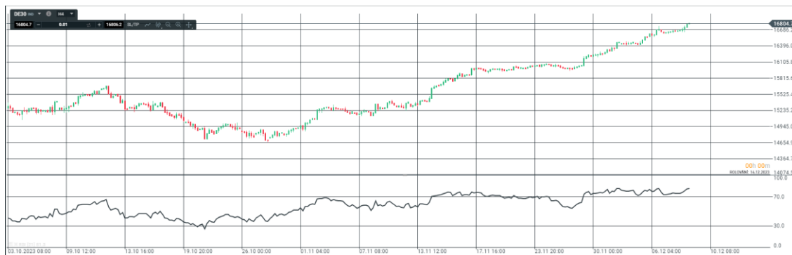
Obrázek 2 RSI

Relative strength index (RSI), je oscilátor indikující překoupenost a přeprodanost trhu, v praxi se používá jak k identifikaci trendu, ale také k indikaci signálů doporučujících vstup na trh, resp. jeho opuštění. (Rejnuš, 2014)