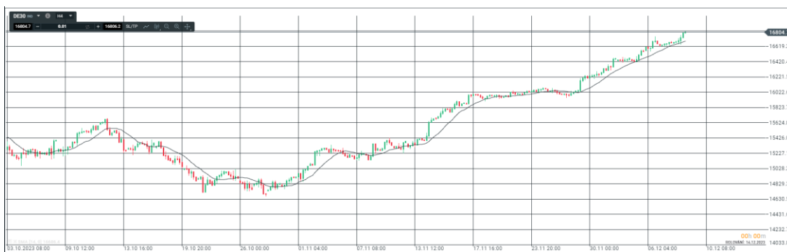
Obrázek 1 Moving Average

Mezi nejpopulárnější indikátory patří například klouzavé průměry (Moving average nebo MA), které vyhlazují prudké odchylky trhu a lze podle nich identifikovat trend, případně tyto průměry bereme jako významnou cenovou hladinu. (Rejnuš, 2014)