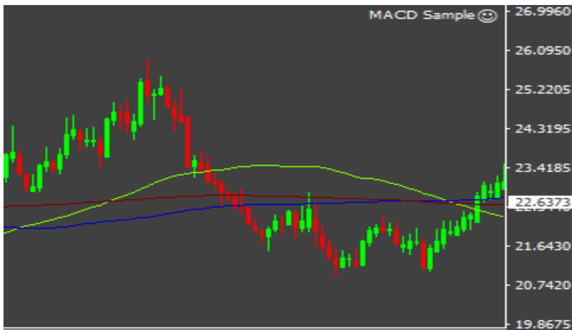
Obrázek 6 MT4 chart

Tato fáze implementace je kritická, protože představuje přechod od teoretického modelování k praktické aplikaci strategie. Je to první krok k ověření, zda strategie, která byla úspěšná v testovacím prostředí, bude schopna obstát i v proměnlivých podmínkách reálného trhu.