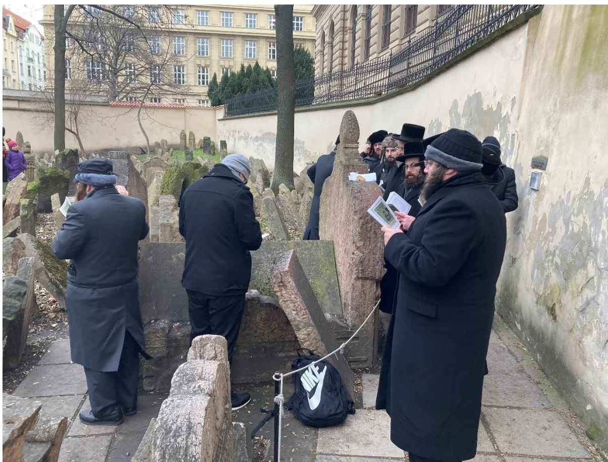
Obrázek 9: hrob Maharala