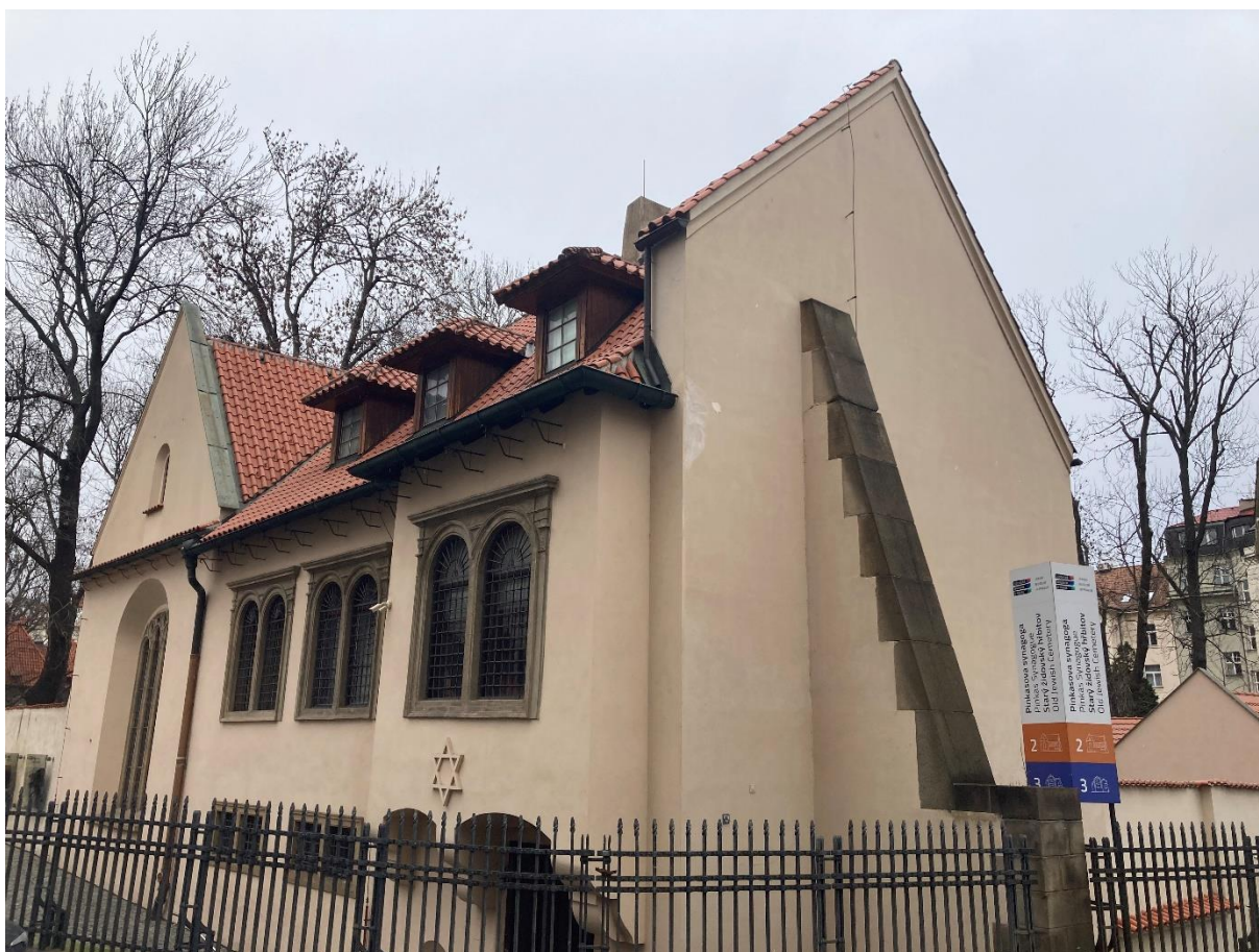
Obrázek 5: Pinkasova synagoga