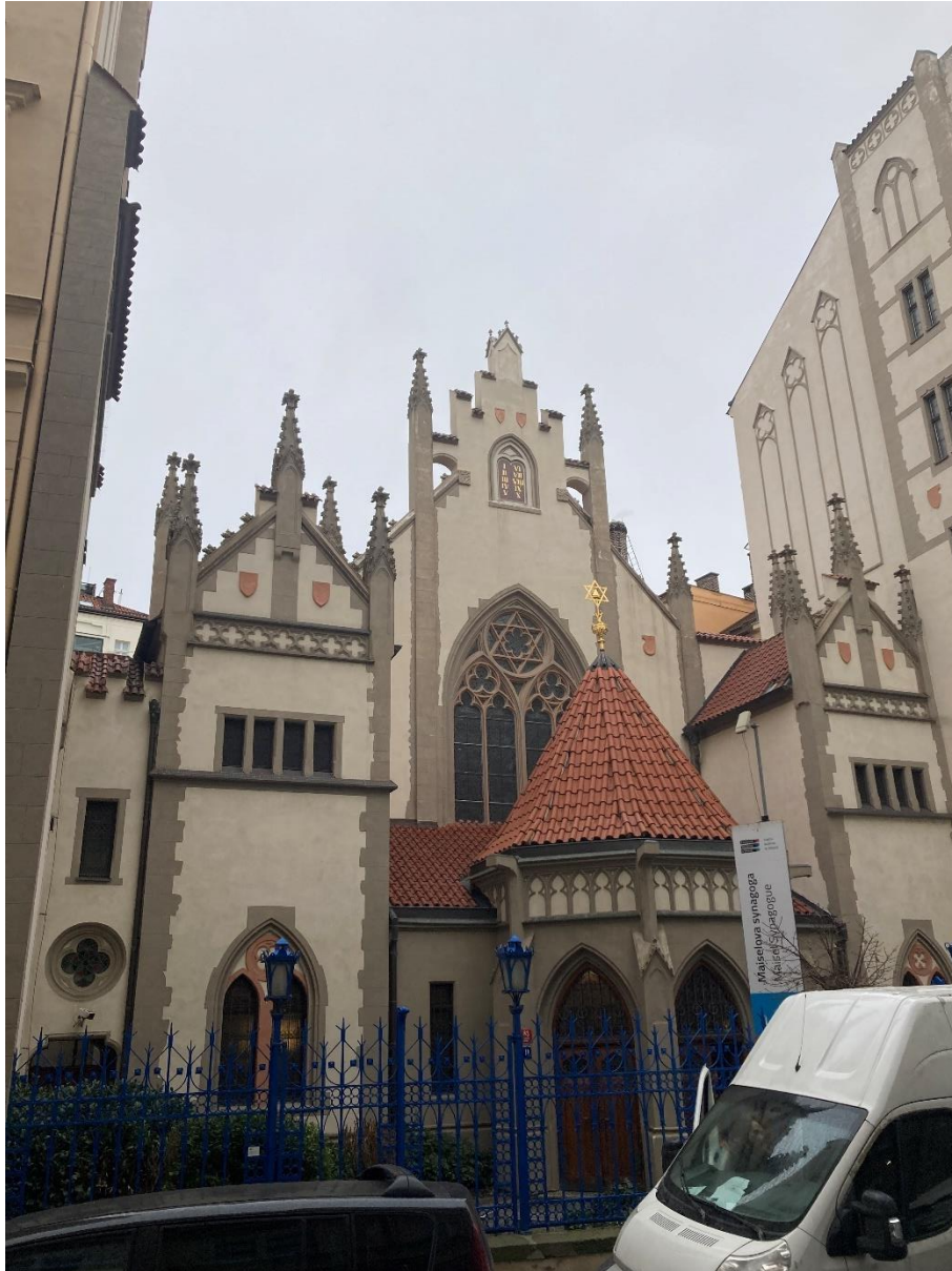
Obrázek 4: Maiselova synagoga