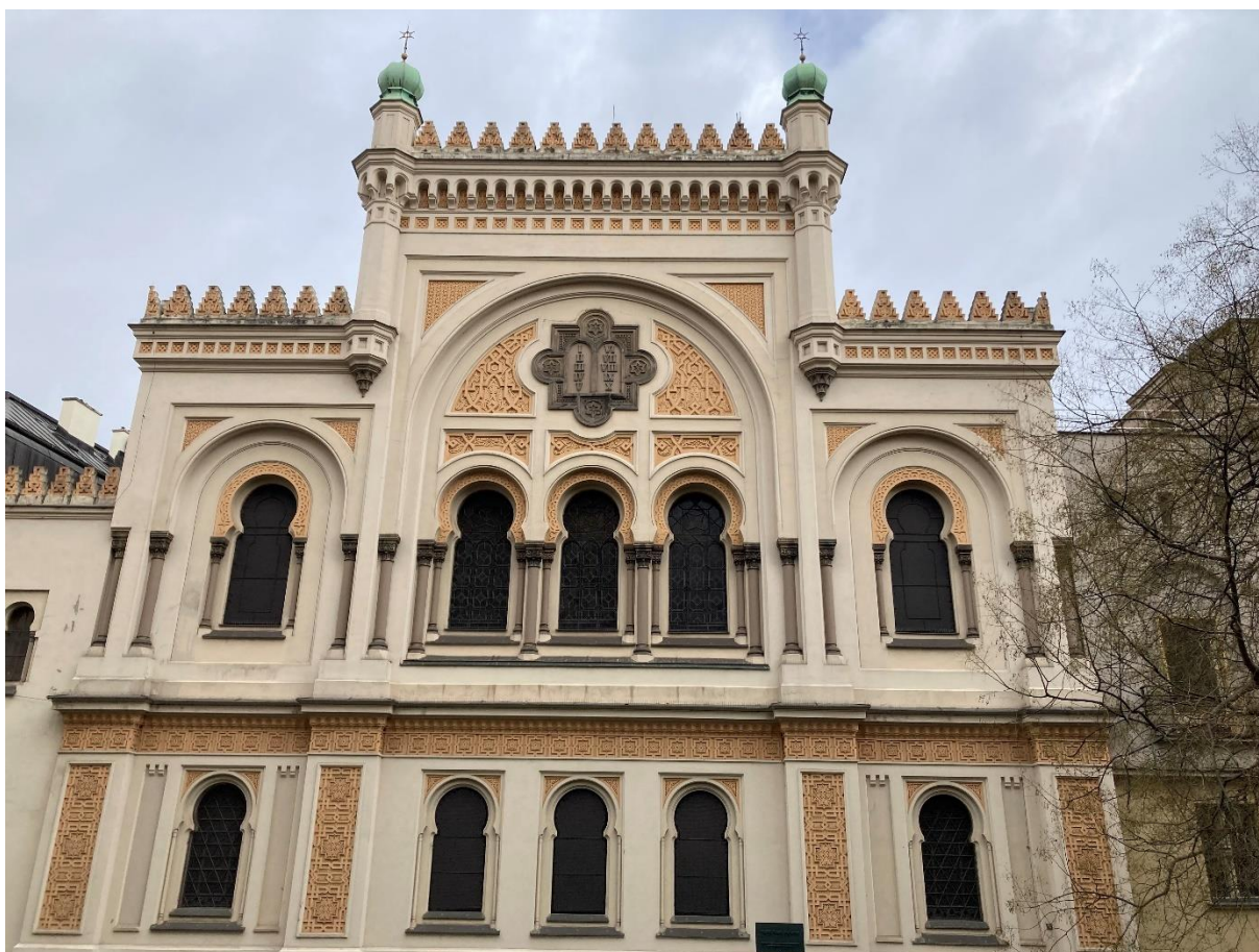
Obrázek 6: Španělská synagoga