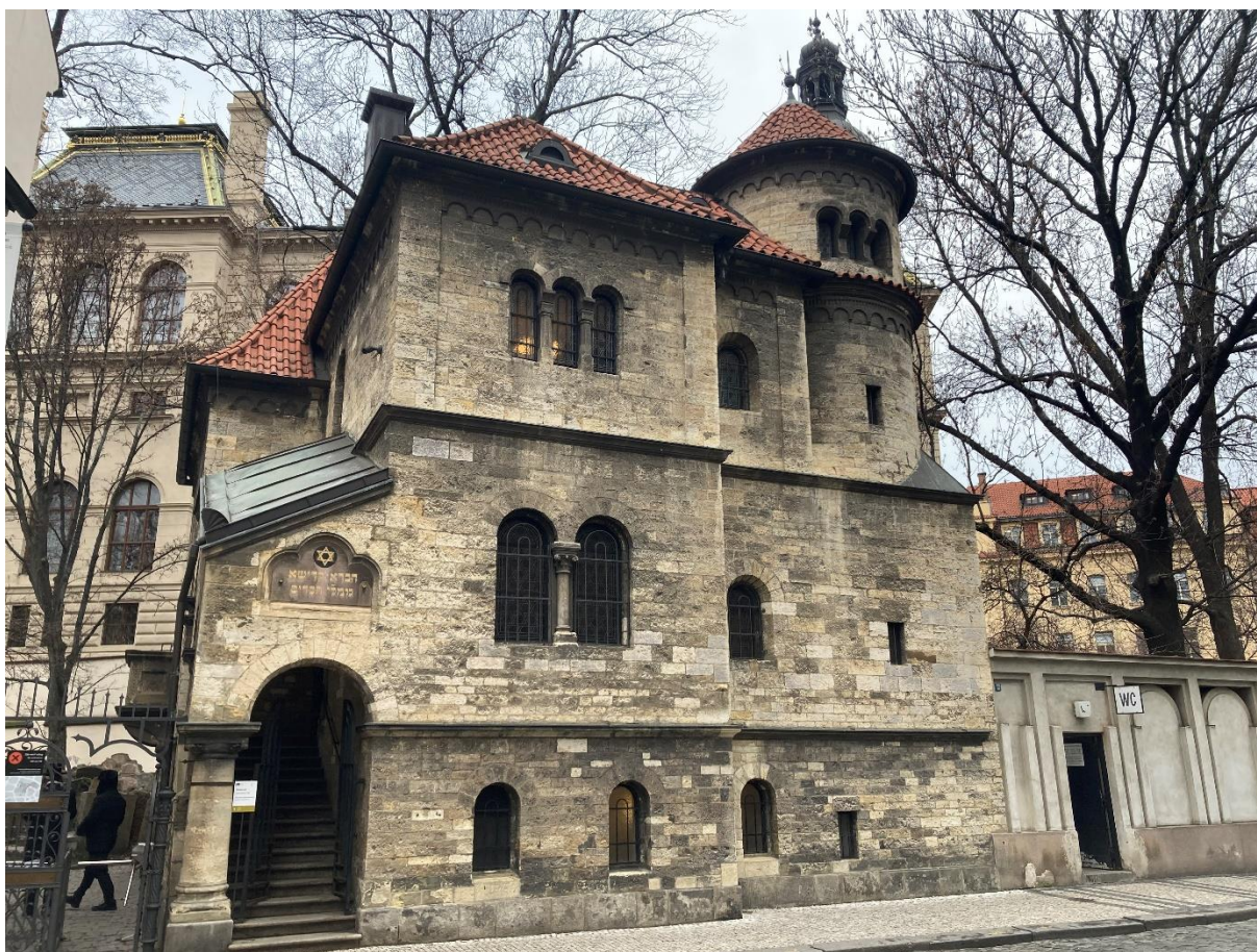
Obrázek 10: Obřadní síň