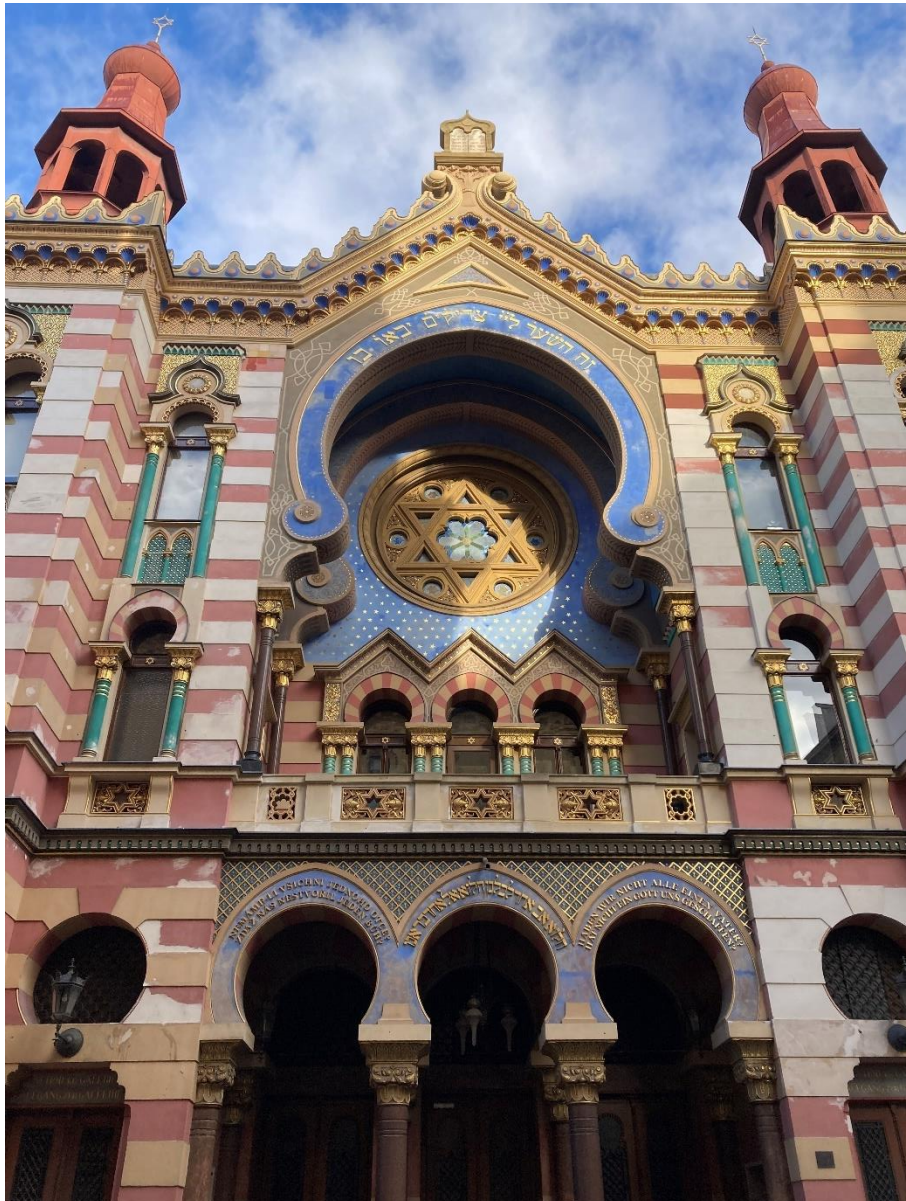
Obrázek 7: Jeruzalémská synagoga