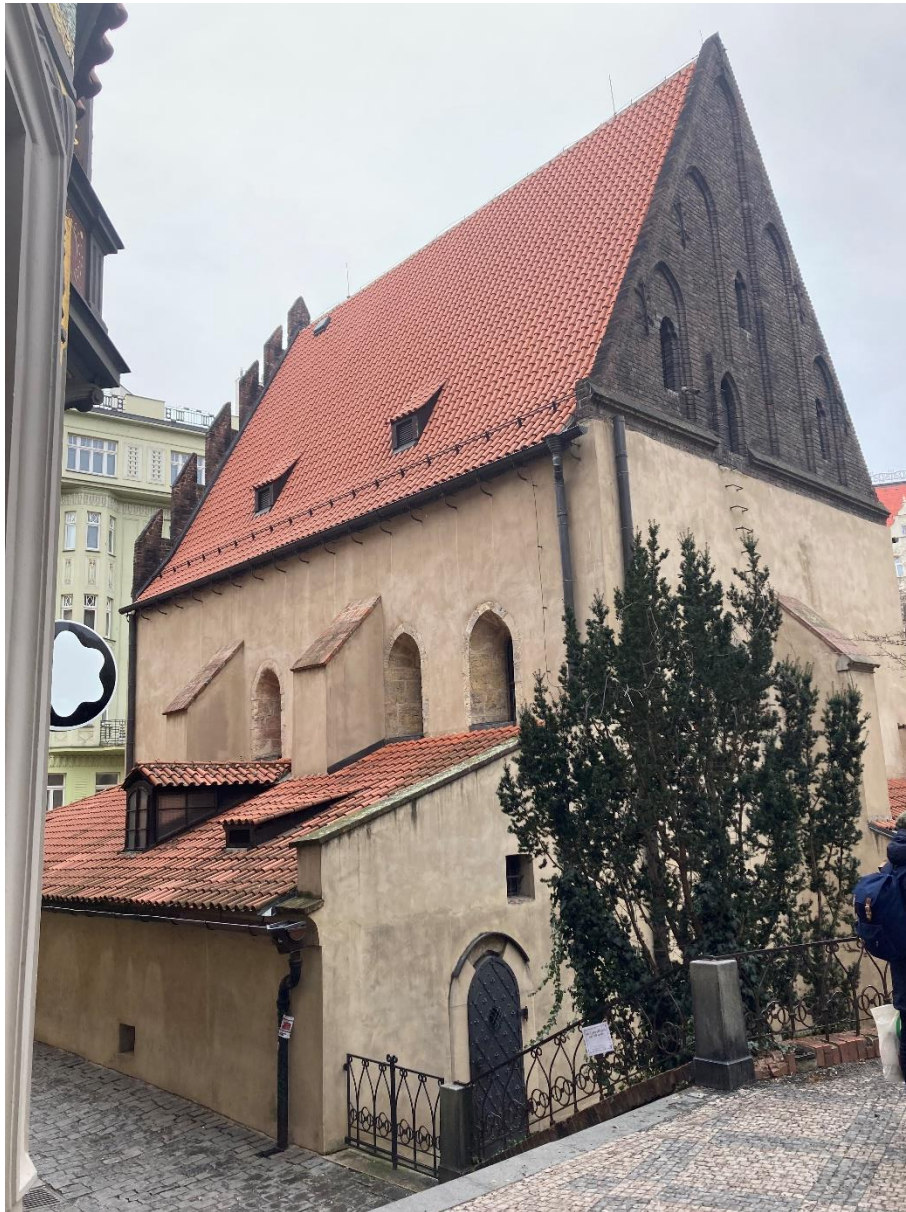
Obrázek 2: Staronová synagoga