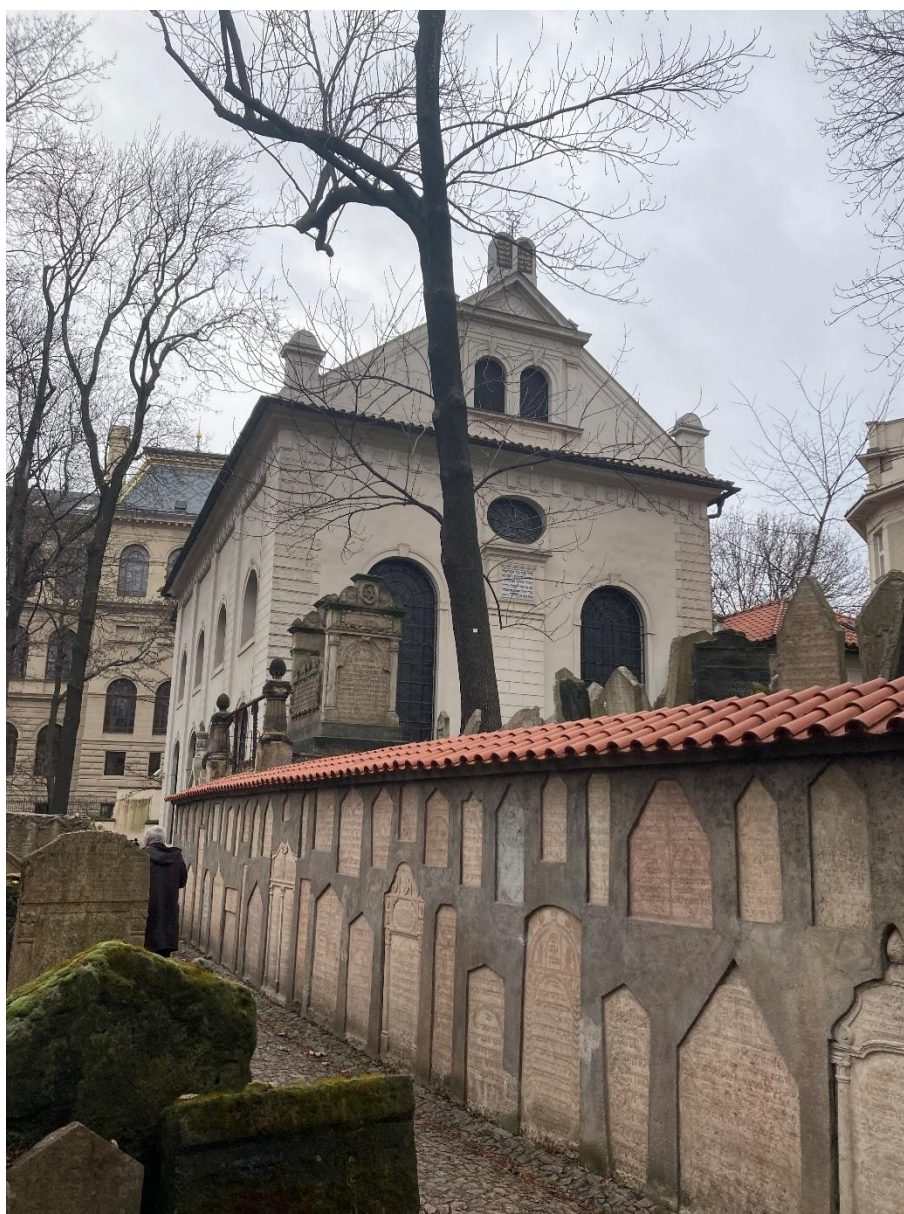
Obrázek 3: Klausová synagoga