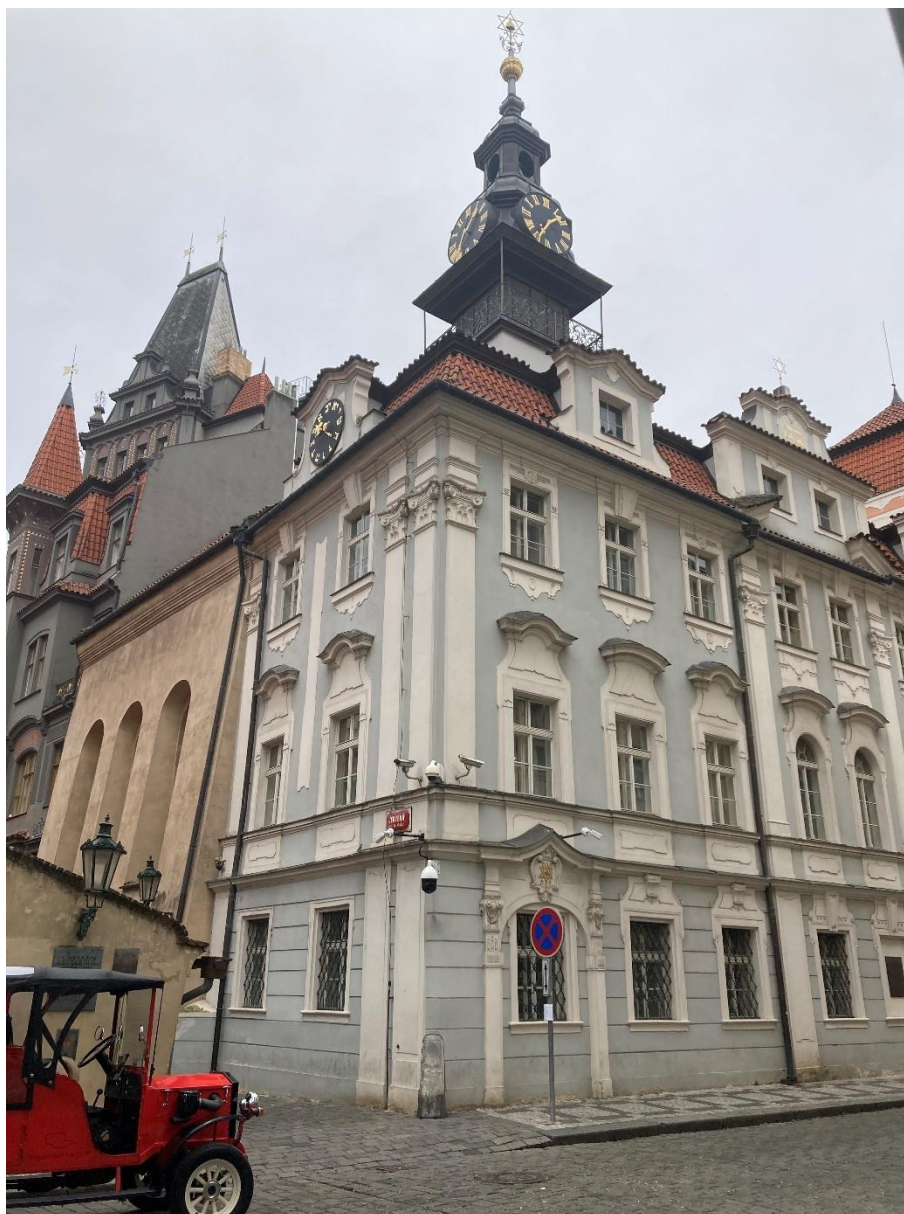
Obrázek 1: Židovská radnice a Vysoká synagoga