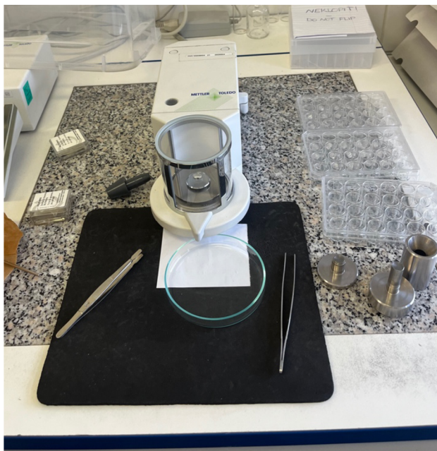
Obrázek 3 příprava vzorků pro stanovení CHNS (Franců 2024)

generoval elektrický signál na základě tvaru píku, což umožnilo vypočítat druh a koncentraci měřených látek.