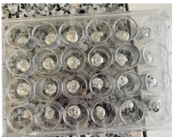
Obrázek 4 připravené zabalené vzorky (Franců 2024)