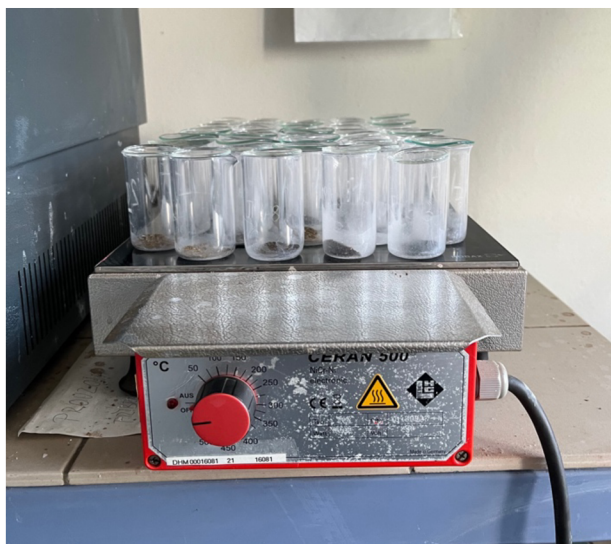
Obrázek 2 Rostlinná biomasa přikrytá sklíčkem na topné desce (Franců 2024)

Následně byly vzorky přelity do zkumavky a doplněny na celkový objem 20 ml, zkumavka byla uzavřena parafilmem a dobře promíchána. Nakonec následovalo stanovení pomocí optické emisní spektrometrie s indukčně vázanou plazmou (ICP-OES).