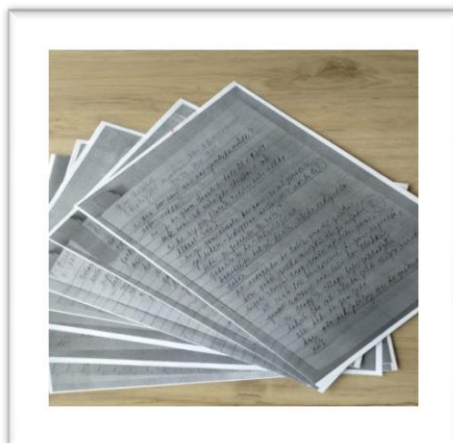
Obrázek 2: Ofocení textu a postupný tisk