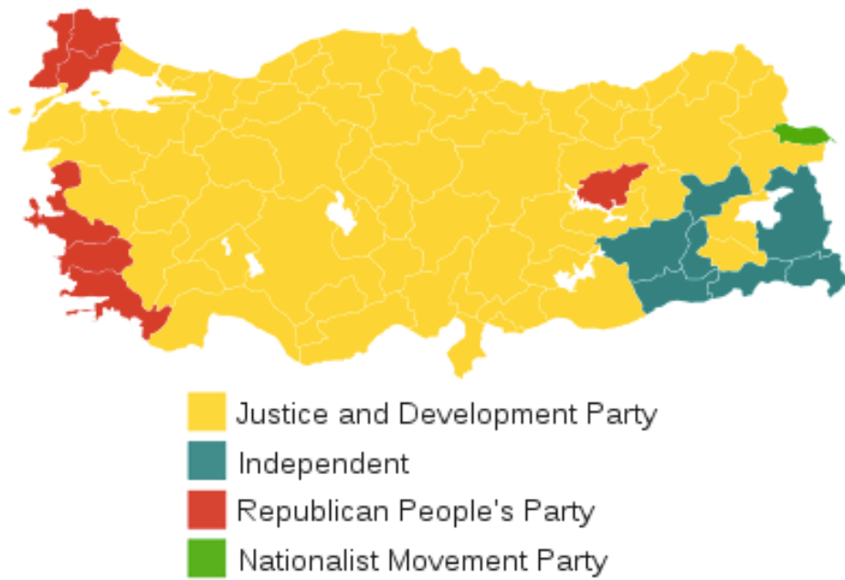
Mapa č. 4 – rozložení hlasů během parlamentních voleb v Turecku roku 2011