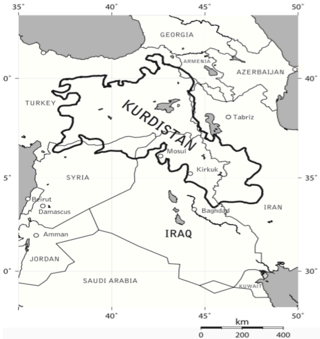
Mapa č. 1 – Území obydlené převážně Kurdy